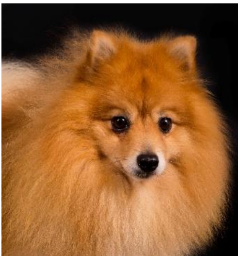
Röd hane med korrekt ansatt öron av bra storlek