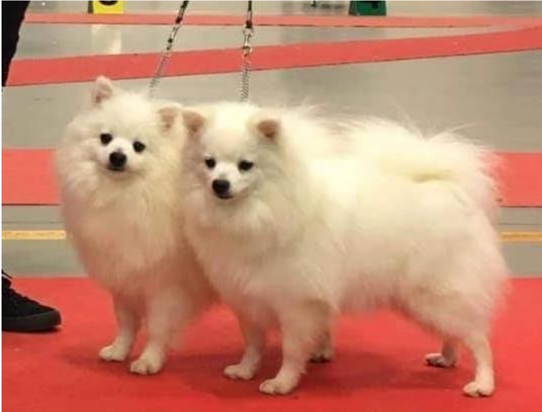
Hane bakerst; tik med något veka mellanhänder