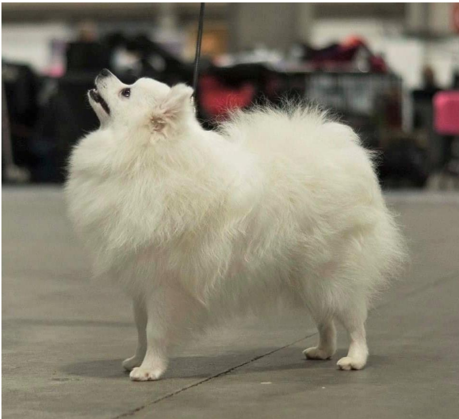
Tik (exempel på bra pälskvalitet för tikar)