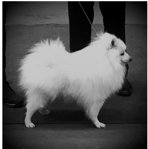
Bra proportioner på en hane