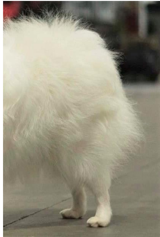
Bra bakställ, raka mellanfötter och ovala tassar

Som helhet skall en volpino italiano vara något knappt vinklad.