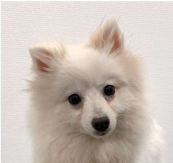
Tikhuvud med korrekt ögonform, bra pigment

Från 2000-talet och framåt har flera uppfödare importerat ett antal hundar, både tikar och hanar från främst Italien men även från andra europeiska länder. Dessa hundar, tillsammans med egna uppfödningar ligger bakom de volpino italiano som finns i Sverige idag.