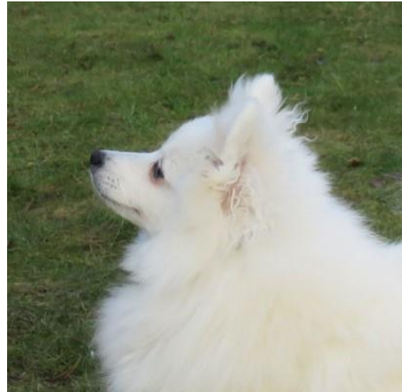
Ett lagom markerat stop

Skallen skall vara längre än nospartiet och vara äggformad.