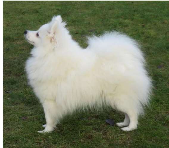
Tik med bra pälskvalitet

En tik får oftast inte samma pälsmängd som en hane i utmärkt pälscondition. Tikarna får sällan lika strittande päls som hanarna.