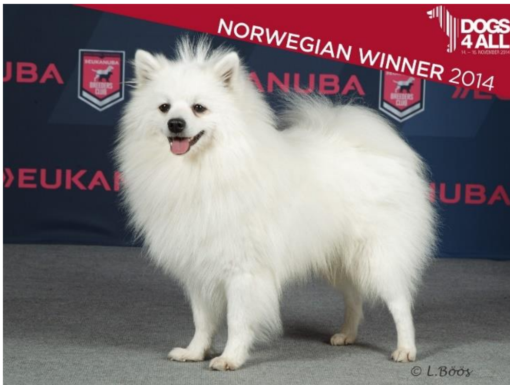
Hane med utmärkt resning