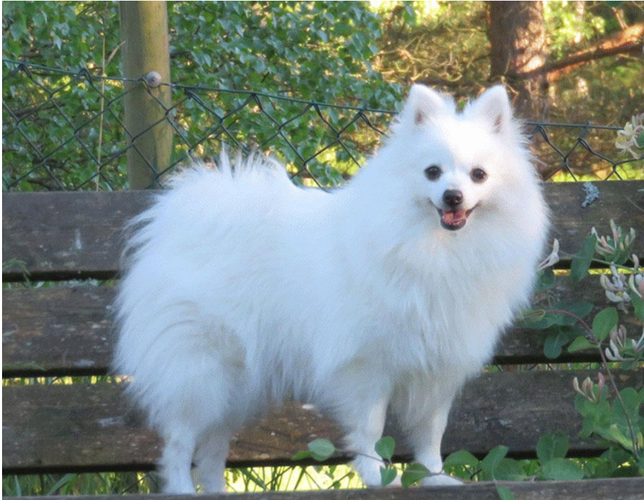
Ung lovande tik