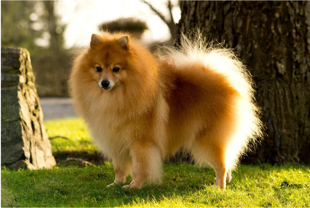
Hane av bra typ med vacker färg