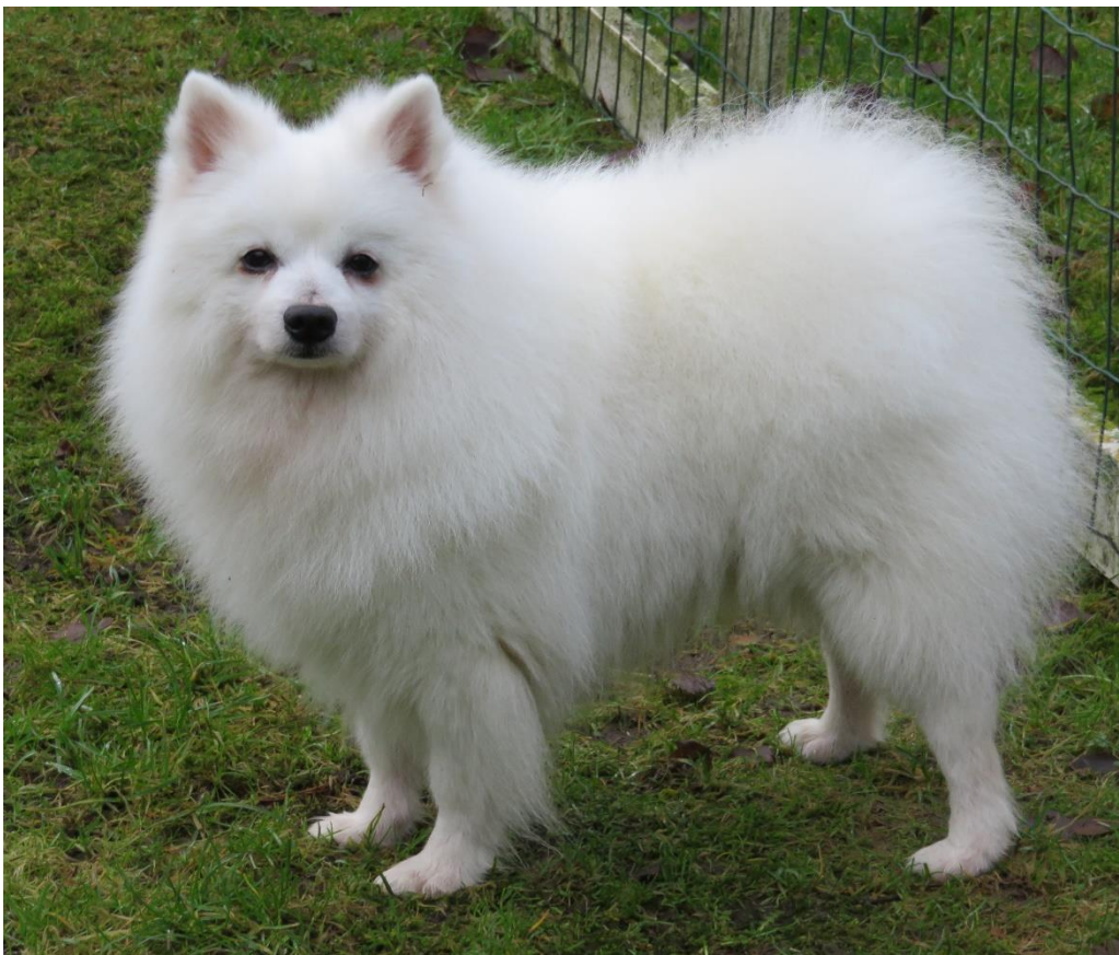
Hane (import från Italien) med utmärkt huvud och den rätta strittande pälsen. Kunde önskat lite mer hals.