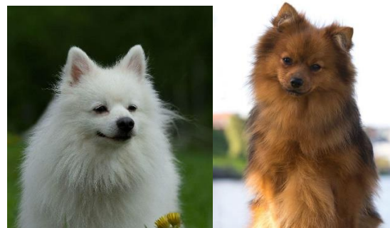
En vit hane och en röd tik

Den slutliga färgen på de röda volpino italiano kan man först se när de är 2-3 år gamla.