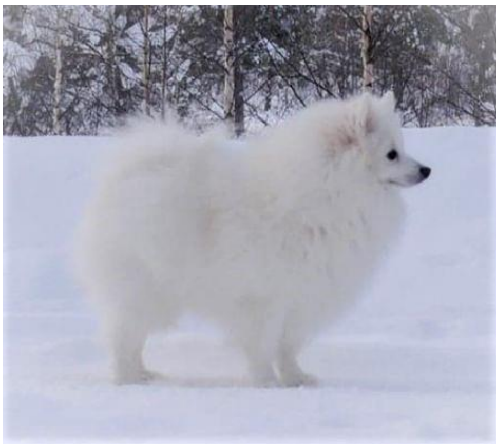
En fullpälsad två-årig hanhund med den korrekta strittande pälsen.