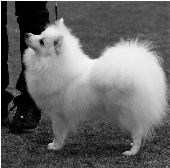
Ung tik med bra proportioner

Det är inte ovanligt att en volpino italiano är ovillig att visa öronen när domaren kallar på dess uppmärksamhet.