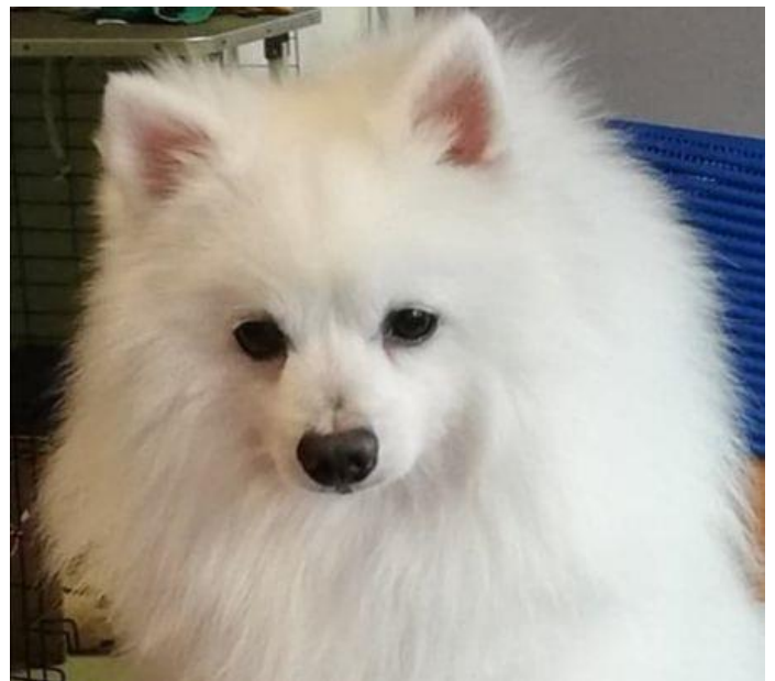
Uttrycksfullt maskulint huvud