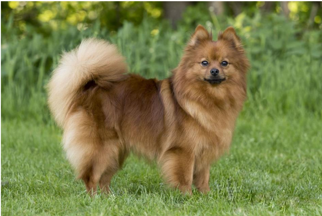
Kvaliteten hos röda volpino är något ojämn. Denna tik är lite lång i kroppen och svansansättning kunde varit bättre. Pälsen borde varit mer strittande.