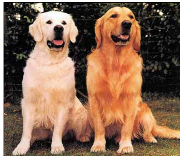
Två hundar av olika familjetyp.

Rasen förekommer i olika så kallade familjetyper. Det beror på att standarden är allmän och ger få detaljerade angivelser. Det ger utrymme för egna tolkningar och är bakgrunden till den variation i utseende som finns, och alltid har funnits, i rasens hemland. Uttrycket familjetyp måste klart särskiljas från begreppet rastyp. Anledningen till att vi kan se en så stor variation av familjetyper, härrör från den hårda uppdelningen mellan olika typer av hundar som fanns hos uppfödare i södra respektive norra England. Man kan generellt säga att hundarna i södra England hade bättre fronter, halsar och skuldror. De var lättare i stommen, hade inte så kraftiga huvuden och var mörka till färgen. Hundarna i norra England var grövre med kraftigare huvuden, bra överlinjer och starka bakställ samt ljusare. Denna markanta uppdelning var gällande från efterkrigsåren fram till slutet av 60-talet. I mitten av 60-talet gjordes några kombinationer där de södra och norra linjerna blandades som fick ett starkt genomslag då de var framgångsrika och fick många efterföljare. Resultatet har blivit att de två gamla typuppdelningarna inte längre finns kvar med samma tydlighet. Eftersom rasstandardens tillåter en bred variation kan man inte framhålla att någon familjetyp är mer korrekt än en annan. I Sverige liksom i England accepteras de olika varianterna i familjetyp så länge de faller inom rasstandardens ramar och kvaliteten och helhet prioriteras över personlig preferens av familjetyp.