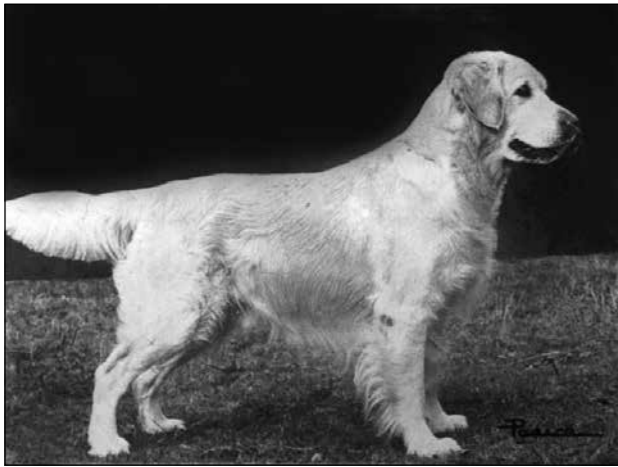
Hane från 1960-talet