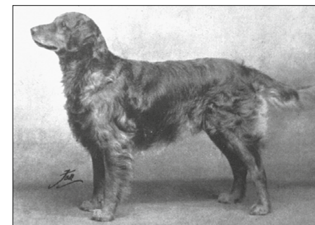
Hane från 1930-talet

Under 1930-talet infördes avsnittet om storlek och färgen gräddfärgad adderades till standarden där det fortfarande står "any shade of gold or cream, but neither red nor mahogany".