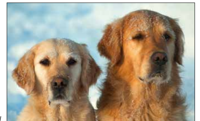
En tik och hane med bra könsprägel