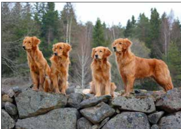
Hundar med jaktlig härstamning

Idag finns många seriösa uppfödare av rasen, uppfödare som lagt ner mycket arbete på att bibehålla det goda från de tidigare hundarna. Samtidigt har man ombesörjt att det hela tiden importeras nytt, högklassigt avelsmaterial från rasens hemland. Detta har också burit frukt och internationellt har svenska golden retrievers ett mycket gott anseende och har exporterats ut till många länder i världen.