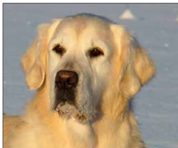
Två hanar med utmärkta huvuden