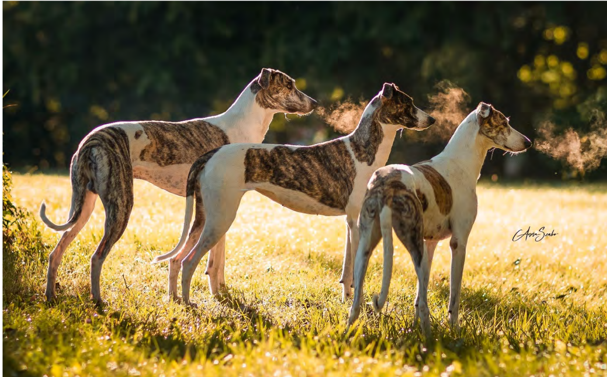
Starka välmuskade bakställ med utmärkta vinklar.