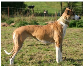
Magyar agár - mest kortlinjerad