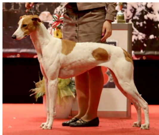
Hane och tik med passande benstomme, som står väl på sina ben.