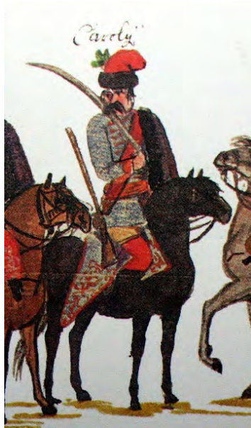
Ungersk husar i kejsarens tjänst 1734.