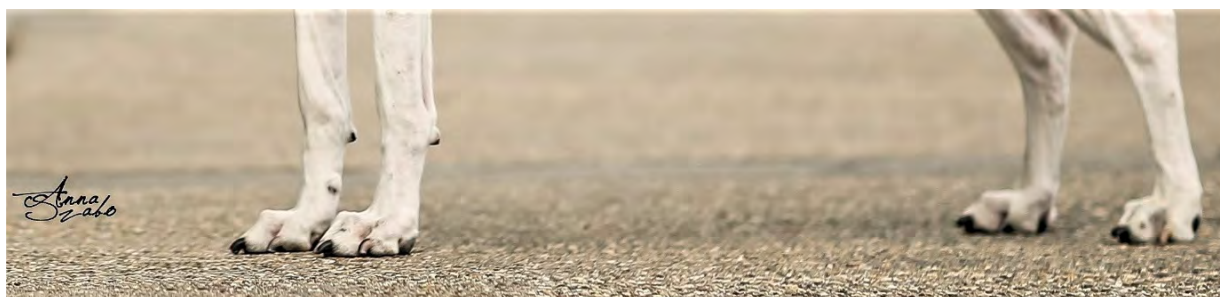
Tassarna ska vara tämligen stora och avlånga. Trampdynorna ska vara kraftiga. Klorna ska vara starka och hållas korta.