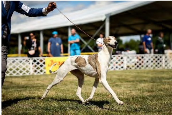
Lätta elastiska rörelser.

Lätta energibesparande rörelser för att orka med en hel dags arbete.