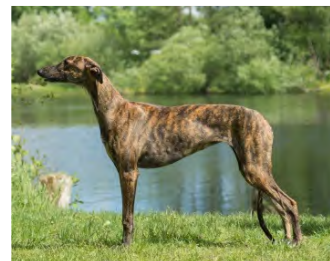
Galgo español – mest eleganta linjer