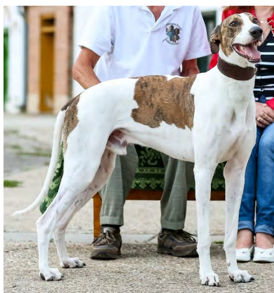
En typisk front med bra benställning.