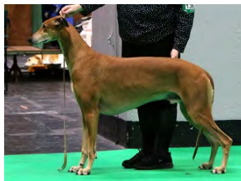
Greyhound - mest långlinjerad