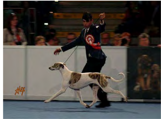
Hund som visas i högt tempo men behåller siluett och balans.