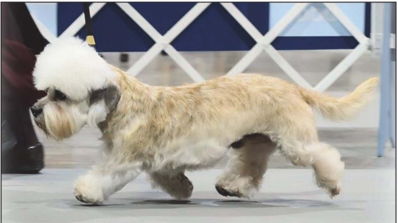
Dandie i rörelse.

Framben hos kondrodystrof hund. Hos dandie dinmont terrier bör vinkel A vara 110 - 120 grader. Vinkel B bör vara 90 grader. Högra benet har för öppen vinkel = dåligt förbröst.