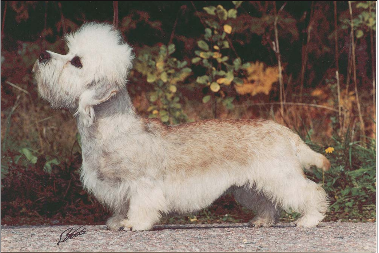
Tik av utmärkt typ.