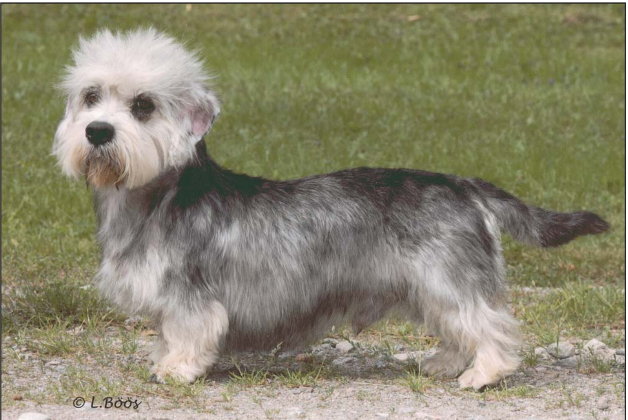
Hane av utmärkt typ.