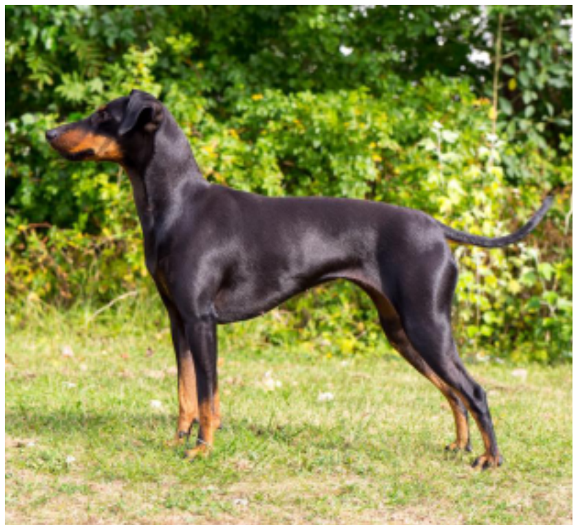
Elegant tik med korrekta proportioner.

Manchesterterriern är tillgiven sin flock, men är generellt något avvaktande till främlingar. Den tolererar hantering på bord, men tycker nödvändigtvis inte om det. Den bör vid bedömning hanteras sansat och samlat, men inte tveksamt eller försiktigt. En manchesterterrier ska däremot aldrig vara rädd eller ohanterlig.