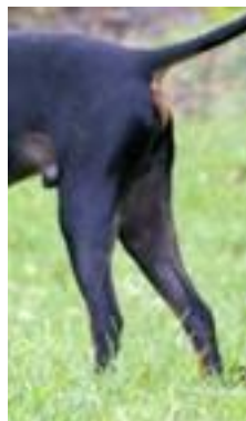
Alltför knapp hasledsvinkel.

Man ser tyvärr inte ofta välvinklade bakställ idag. Detta är det viktigt att förbättra. Ett gott bakparti är A och O för goda, sunda rörelser.