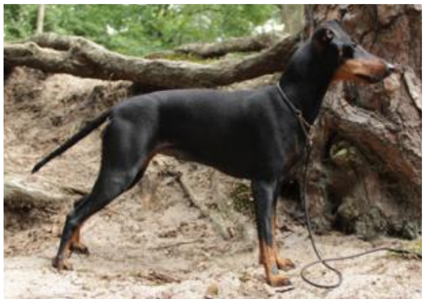
Korrekt konstruktion och silhuett.

Svansen ska nå ner till just ovan hasleden och ska bäras som en förlängning av ryggraden. Den avsmalnande spetsen liknas vid gadden hos en geting. Svansen kan bäras högre i rörelse än i stående, men ska aldrig vara högre än rygglinjen.