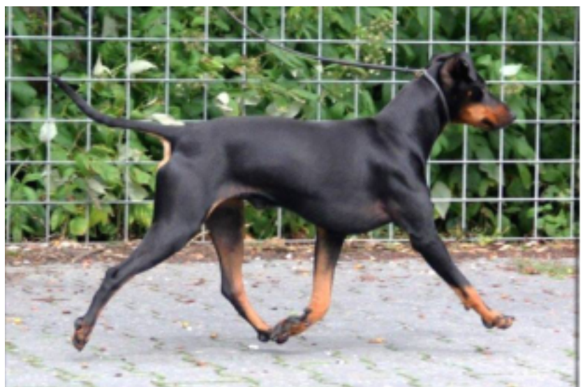
Utmärkta, fria och välbalanserade rörelser.

Det är under rörelse som en manchester visar upp sitt rätta jag. Genomgång på bordet bör vara till för att bekräfta det som ögat sett i rörelserna.