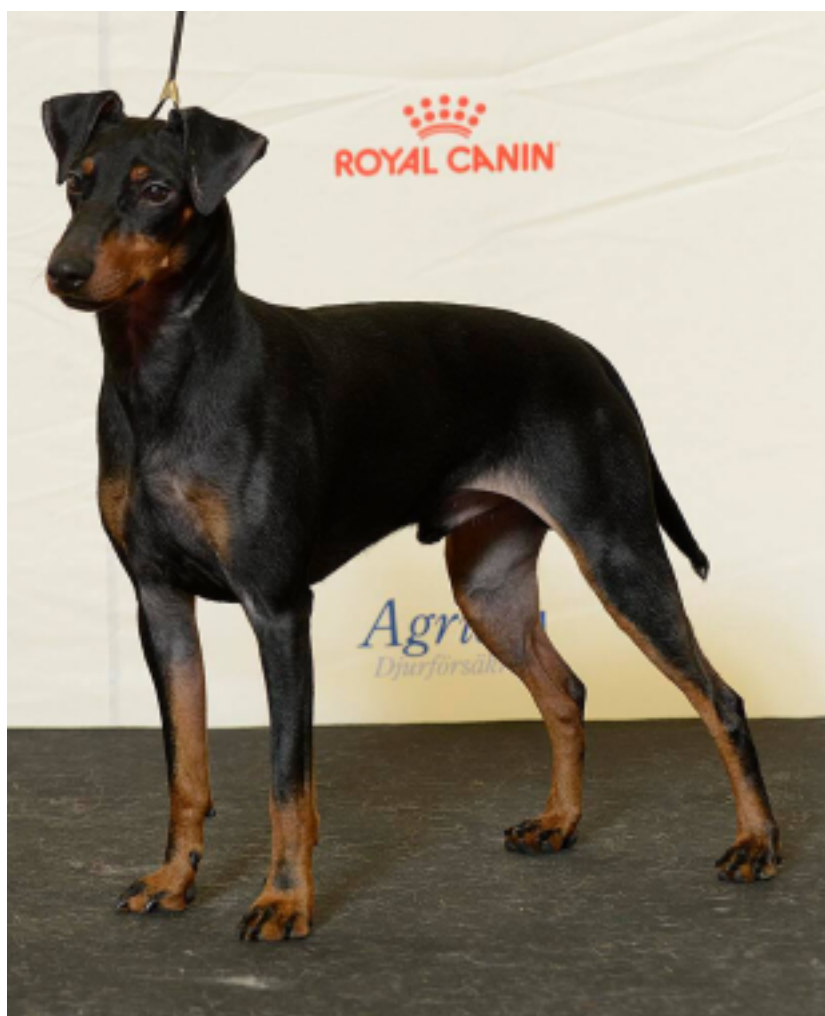
Hane med utmärkt färg och teckning.

Rött på baksidan av benen vanligen kallat "breeching" är fel. Inte i något fall skall det svarta blandas med det röda eller tvärtom, utan gränsen mellan färgerna skall vara tydligt markerad.