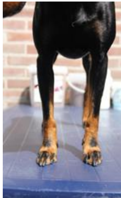
Korrekta tumavtryck och penselstreck.

Den korrekta färgteckningen är en viktig del av hunden, men avsaknad av tumavtryck eller mindre väl avgränsade färgfält bör inte väga tyngre än konstruktionen och helheten hos hunden.