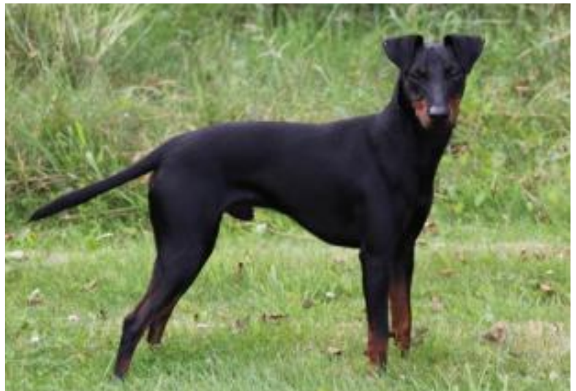
Hane med utmärkt överlinje, vinklar och svans.

En korrekt överlinje är viktig för helheten. Överlinje och svans bör alltid bedömas när hunden är i rörelse. Det är tyvärr många hundar som då tappar rygglinjen, blir bakhöga och bär sin svans alltför högt. Idag ser man många plana överlinjer som reser sig mot svansfästet utan tendens till något avfallande kors — detta ofta i kombination med för högt ansatt och buren svans.