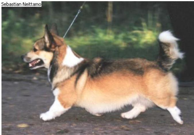
Hane som bär svansen upprätt i rörelse