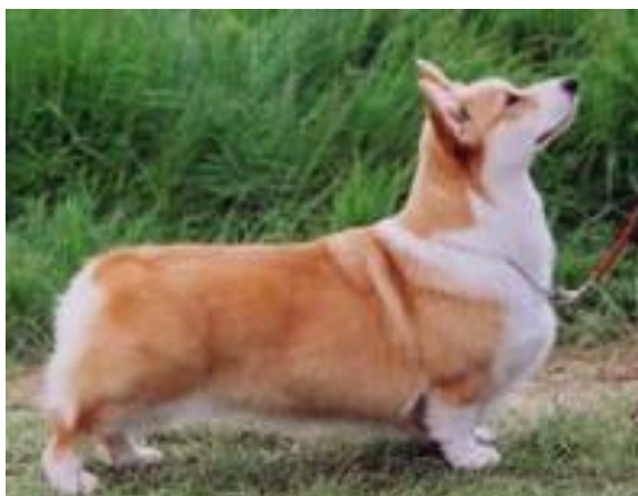
Tik av utmärkt typ