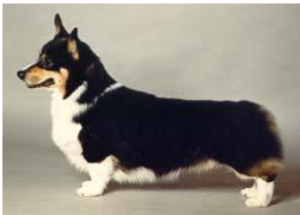
Black and tan med vita tecken bröst och tassar