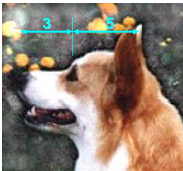
Bild på huvud från sidan