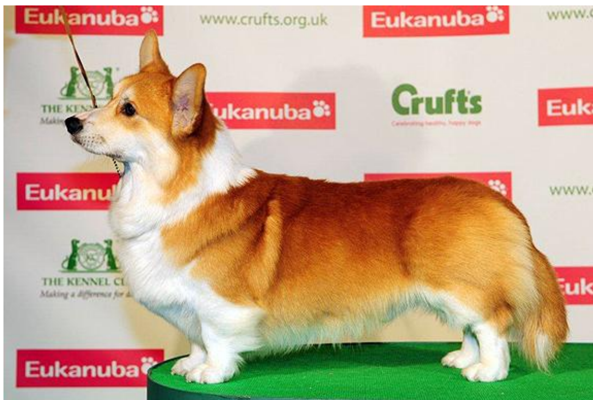
Hane med utmärkt front och bröstkorg av god längd och djup. Utmärkta proportioner