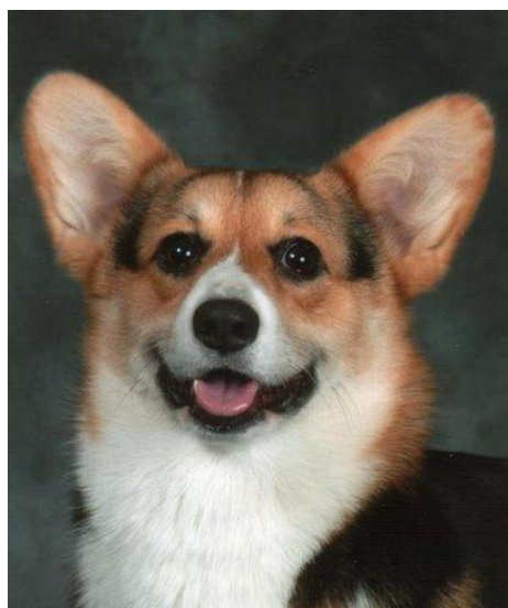
Tik och hane som visar tydlig könsprägel. Båda har välpigmenterade ögonlockskanter samt utstrålar det hos rasen karakteristiskt livliga och intelligenta uttrycket

ÖRON: Öronen skall vara upprättstående, medelstora och något rundade. En tänkt linje dragen från nospetsen genom ögat skall passera genom eller nära öronspetsen.