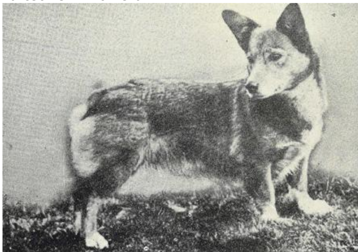
Bild 4.1 Rose, första corgi som registrerades hos the Kennel Club

De två raserna levde i århundraden relativt isolerade från varandra i det bergiga Cardiganshire respektive det mera platta Pembrokeshire. Då transportmöjligheterna blev bättre i början av 1900-talet började raserna sammanblandas. Denna sammanblandning fortsatte till 1934, då de fick var sin standard.