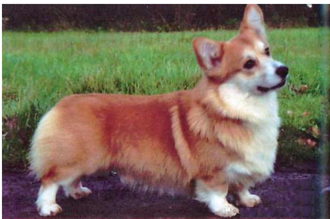
Hane av utmärkt typ