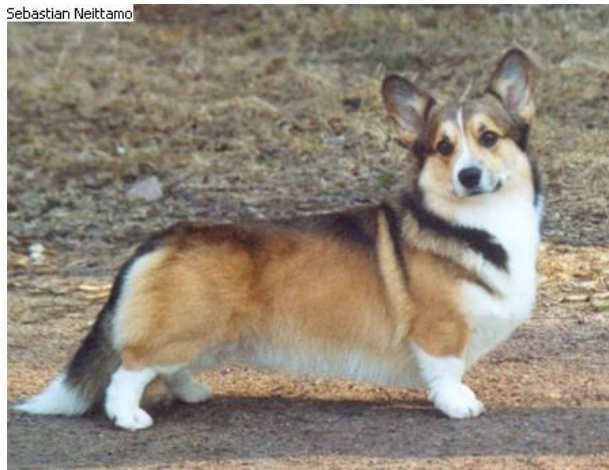
Hane som står med hängande svans