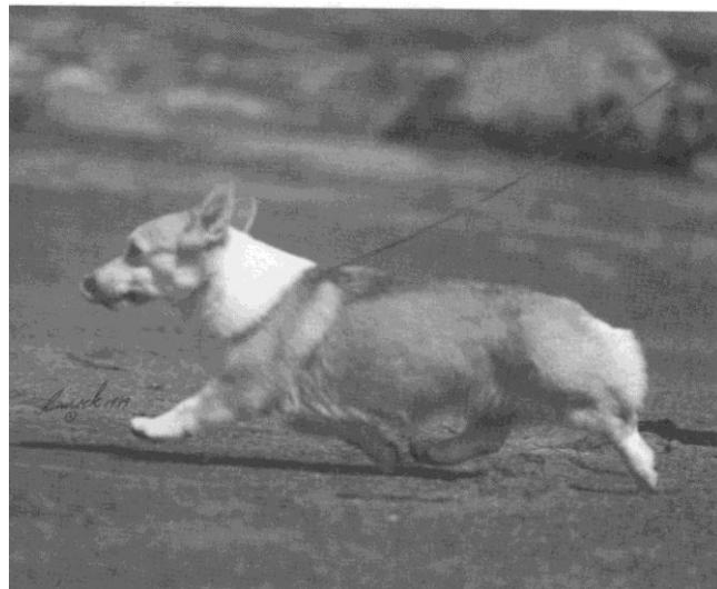
Rörelserna ska vara fria och vägvinande

Bakifrån sett är inte benen parallella utan rör sig svagt inåt, ju snabbare hunden travar desto mer sätts tassens in mot mittlinjen.