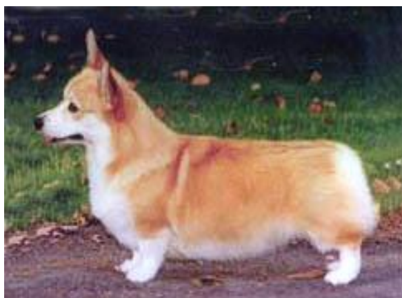
Röd med cremefärgade tecken