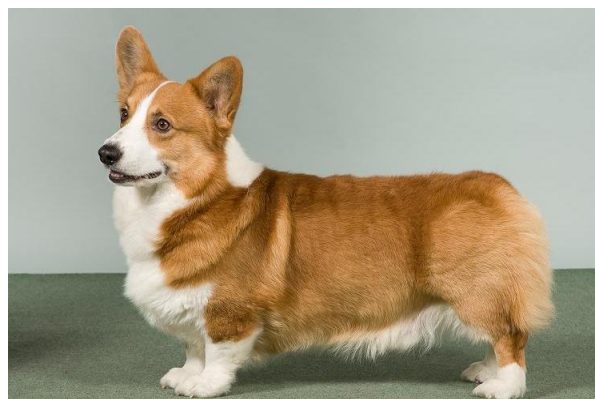
Röd med vita tecken