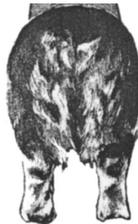
I stående skall bakbenen bakifrån sett vara raka