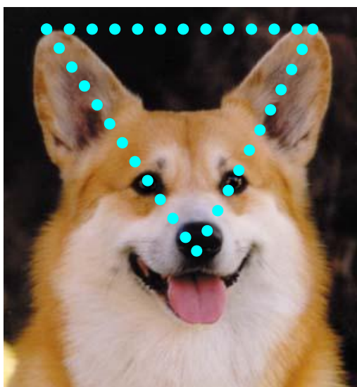
Utmärkt triangulärt huvud

Läpparna skall vara torra och åtliggande. Både läppar och nosspegel ska vara svarta och fullständigt pigmenterade.