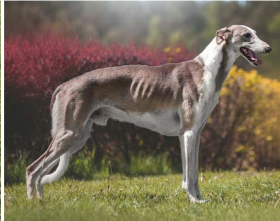
De flesta färger/färgkombinationer är illustrerade i kompendiet. Fläckar på vit botten är också en vanligt förekommande teckning så också diluterade färger.