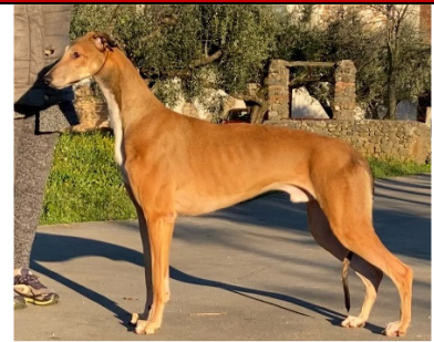
greyhound kurvig och långlinjerad