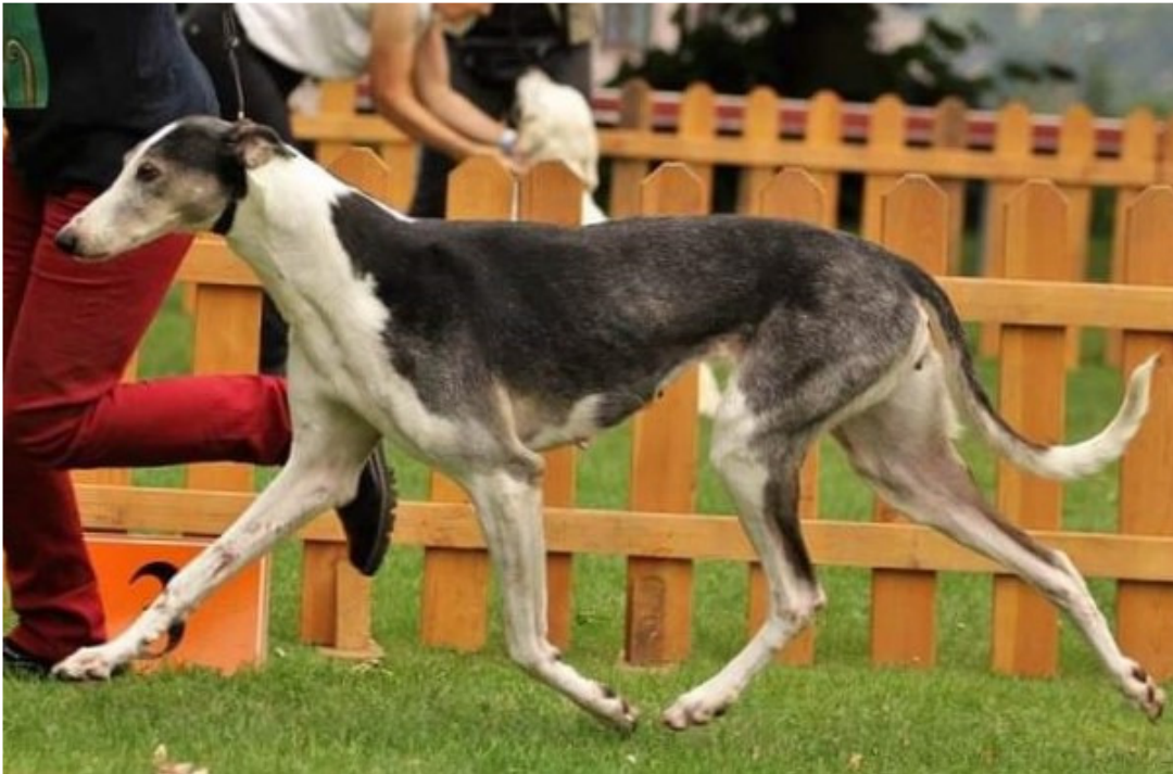
Här visar hundarna upp korrekta rörelser med bibehållen profil med lagom resning.