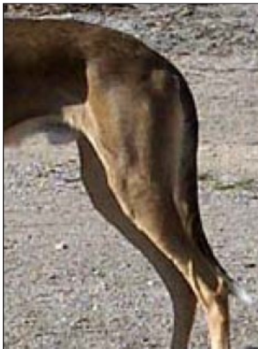
Svans på helt avslappnad hund

Svansen ska vara lång och ganska kraftig, den ska nå halvvägs till marken från hasen mätt. Man ser helst att svansen vid anspänning och i rörelse bildar en skära eller ring. Den ska inte bäras över ryggen. Pälsen på svansen ska vara något längre och bilda en antydning till fana.