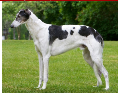
chart polski kort och kraftfull