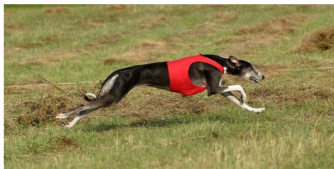
Lure coursing är rasens officiella bruksprov och här kan man tydligt se hur agila de är.