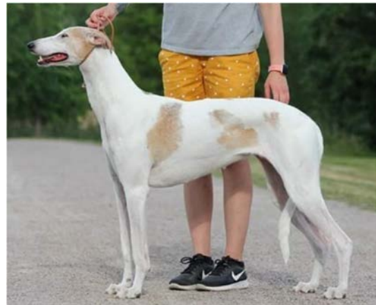
CHART POLSKI – några viktiga punkter att komma ihåg