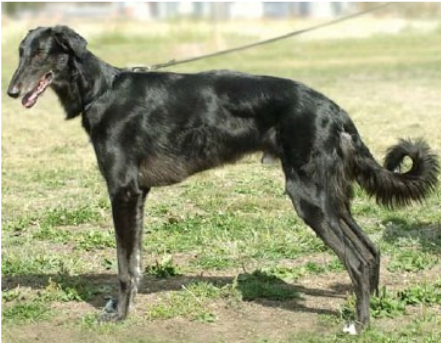
På de övriga bilderna i kompendiet visas korrekt päls. Här har vi valt att även visa en hund men långhårig päls, vilket är felaktigt.

Det finns också en helt långhårig variant av chart polski och är inte helt ovanlig. Detta hårlag ska inte accepteras.