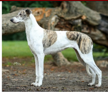
magyar agár lätt rektangulär, kraftfull