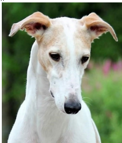
Rasen visar ofta upp öronvickningen som på bilderna, speciellt vid intresse.