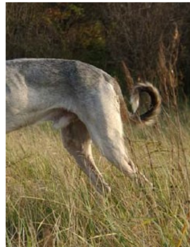
Ännu en variant av önskvärd svans.