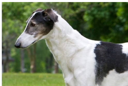
Två utmärkta kraftiga halsar med korrekt halsansättning.