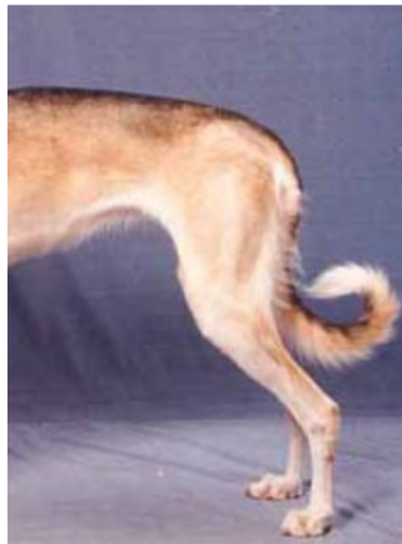
Här ses den önskvärda ringen.