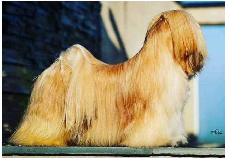
Ung hane med utmärkta proportioner. Vacker överlinje, väl ansatt svans med fin båge. Pälsen är fortfarande ungdomlig.