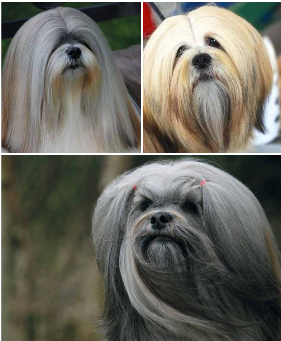
Tre vackra uttryck med mörka välformade ögon.

Ett av de viktigaste karaktärsdragen i ett Lhasa Apsouttryck är ögonen som måste vara framåtriktade och sitta väl isär, vara mörka och mandelformade. Varje likhet med Shih Tzuns runda ögonform är ett allvarligt fel.