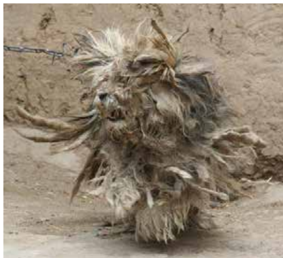
Lhasa Apso i Sverige och Tibet utför en "Drakdans".