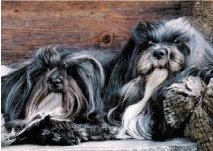
Två härliga rasrepresentanter med tydlig könsprägel. Till höger hane och till vänster tik.