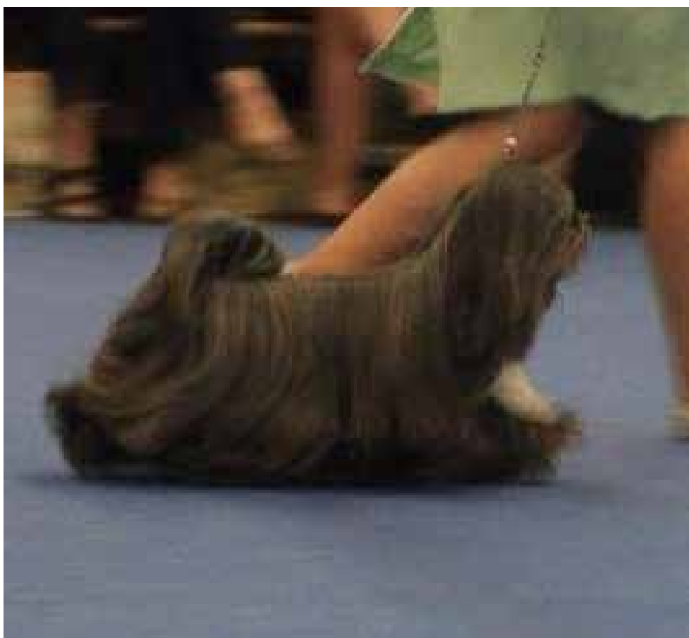
Harmonisk hane med rastypiska rörelser, utan överdrifter.

En Lhasa Apso med korrekta proportioner har vikten väl fördelad över hela kroppen, detta innebär att rörelserna får en mycket god räckvidd och bra påskjut. Påskjutet ska vara utan flic-ups – som inte är önskvärt. Rörelserna ska vara stabila, kraftfulla och obehindrade. Ett välburet huvud och en vacker svansbåge tillsammans med korrekta rörelser ger den önskvärda siluetten.