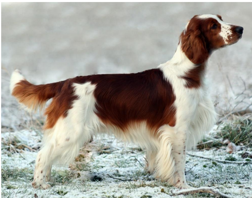
Hanhund ovan, tik nedan

Det är viktigt för ett korrekt helhetsintryck att hunden är stram och muskulös och således behåller sin fysiologiska överlinje även i rörelse. Tänk på helhetsintryckets : "byggd för uthållighet och hårt arbete".