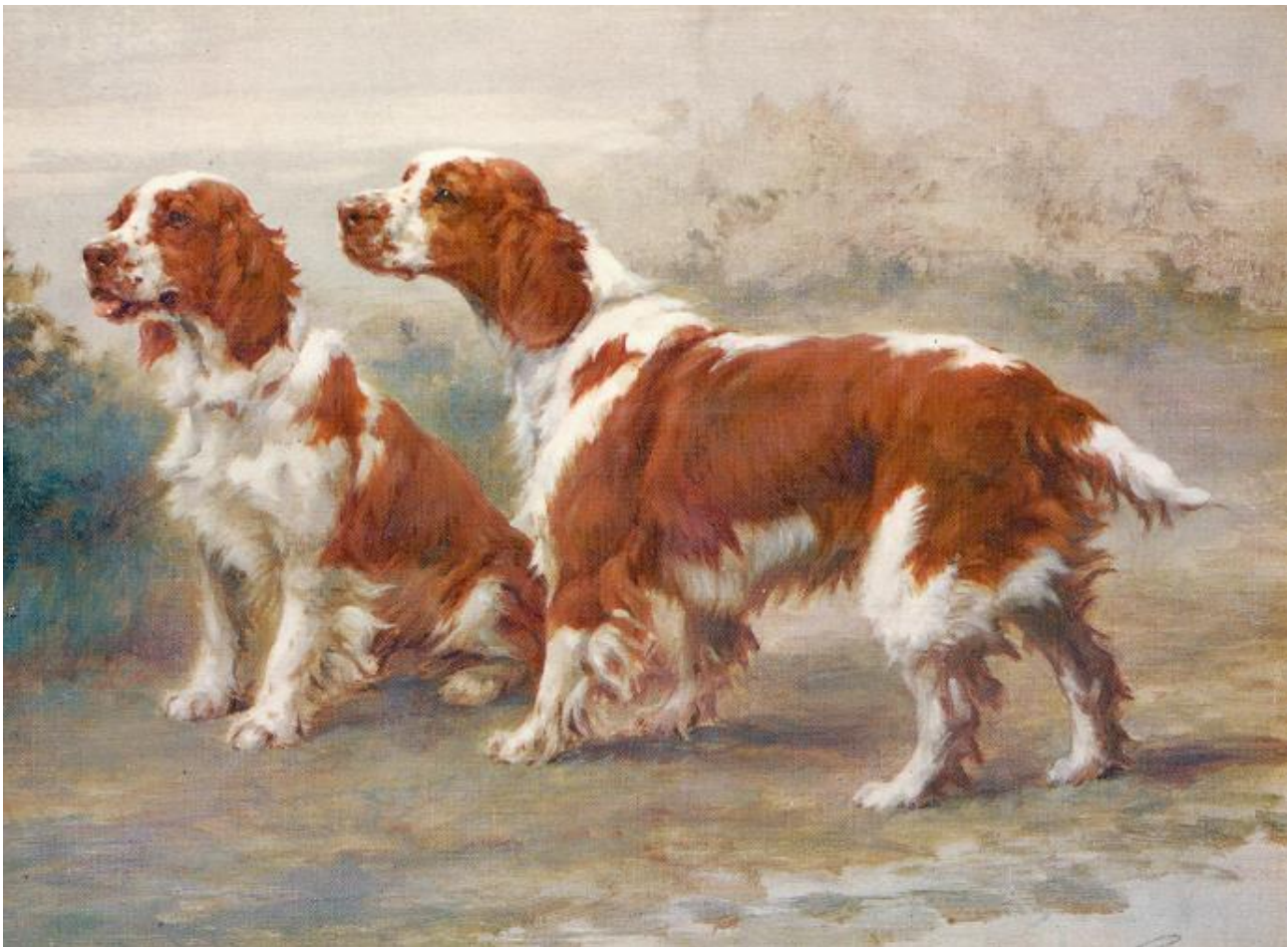
Tavla målad av Maude Earl 1906 föreställande Ch Longmynd Fach och Ch Longmynd Megan. Tavlan tillhör The Kennel Club och anses vara den främsta bilden av rasen genom tiderna.

Denna gamla engelska versstrof är givetvis en sanning med modifikation. Welshen är dock, liksom övriga spaniels, en oerhört mångsidig ras. Anledningen hittar man givetvis i rasens ursprungliga användningssätt. Medan många av de övriga spanielraserna i huvudsak var den engelska aristokratins hundar, så utvecklades den spanieltyp som idag är welsh springern i det då mycket fattiga Wales.