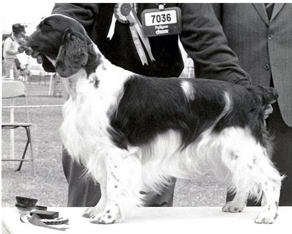
GB Sh Ch Wainfelin Barley Mo var länge rasens rekordhållare avseende antal CCs. Han föddes 1984 och är ett utmärkt exempel på den walesiska typen av rasen.