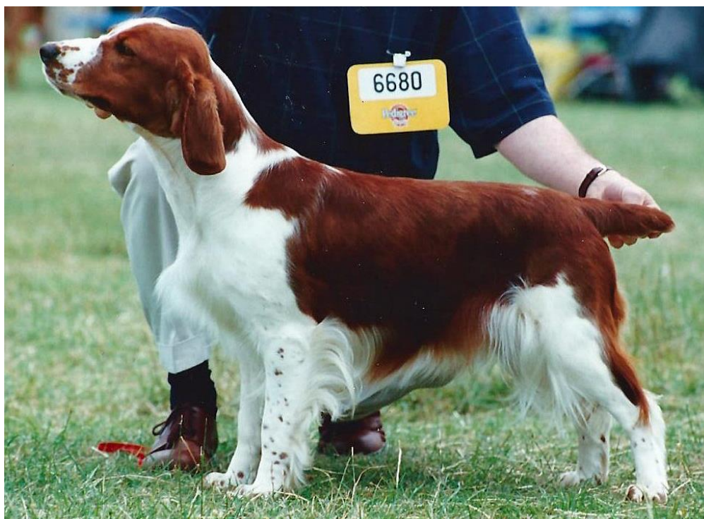
GB SH CH Ferndel Cecilia – nämns ofta när rasfolk ombeds nämna den främsta.