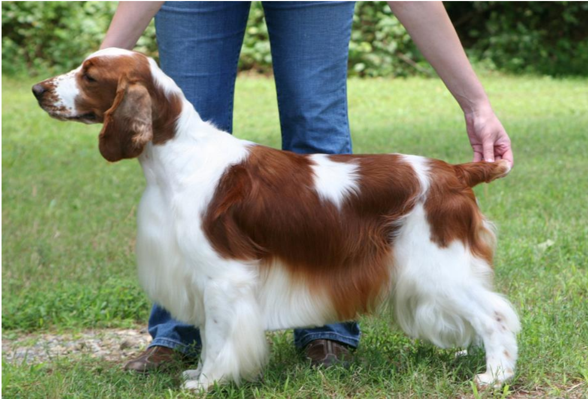
US CH Trystyn Statesman Cactus Blue – aktuell storvinnare i USA.

Rasen är typmässigt homogen internationellt, vilket väl illustreras av dessa två;