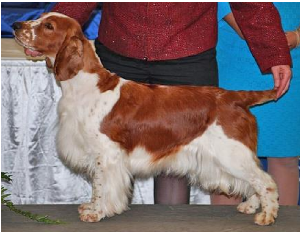
US GCH Rolyart's Full of Grace JH – vinstrikaste tik i USA genom tiderna.