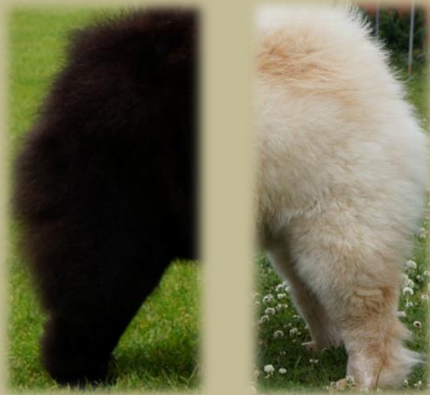
Två bra bakställ

Den för rasen speciella "styltiga" gången kräver ett så rakt bakben som möjligt. Hasen tillåts att vara minimalt vinklad. Dock skall hasleden vara stabil, inte rörlig åt sidan eller framåt och den skall vara lågt ansatt. Bakbenen skall vara raka och parallella bakifrån sett.