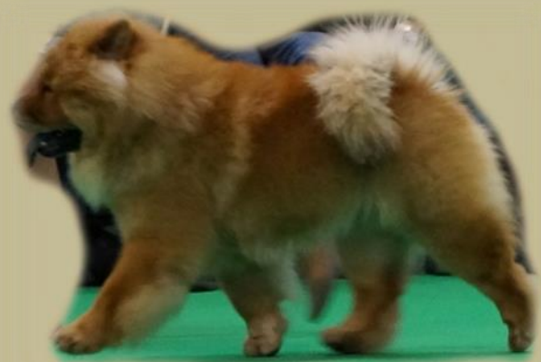
Rastypisk glidande gång

Styلتiga rörelser får inte förväxlas med hälta.