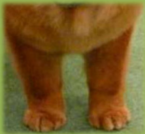
Bra front med "kattassar"

Framtassarna skall vara små och runda (s.k. kattassar). Hunden skall stå högt på tårna.