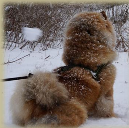
En chow chow trivs ute i alla väder

En chow chow skall ha värdighet, vara stolt och självsäker och den skall vara aktiv och pigg.