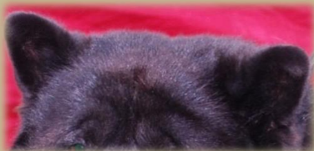
Lågt ansatta öron

Hos schatterade röda accentueras "scowlen" mer än hos enfärgade svarta eller blå.