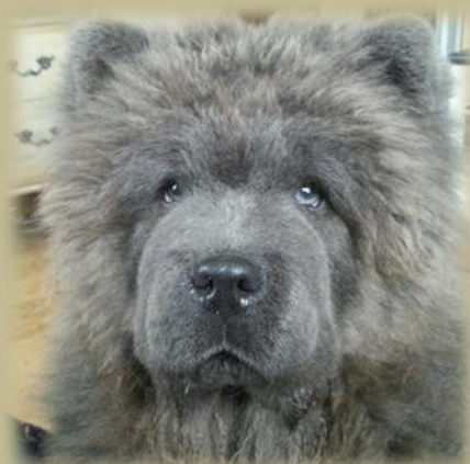
Blå valp, där färgen på ögonen harmonierar med pälsfärgen. Pälsfärgen mörknar oftast med åldern.

Det är vår förhoppning att domarkår såväl som uppfödare ser till att chow chowen som ras får behålla sina särdrag utan överdrifter, så att sundhet och livskvalité sätts i första rummet, och att detta kompendium kan vara till god hjälp härtill.