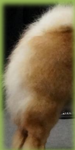
Väl ansatt svans

Svansen ska vara högt ansatt och bäras väl in över ryggen.