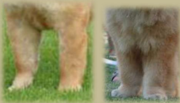
Bra raka framben

Frambenen skall ha kraftiga muskler och kraftig benstomme. Chow chowen skall ha lätt sluttande skuldror för att bibehålla balans med den raka bakdelen.