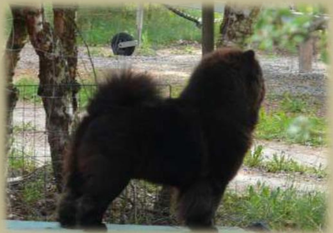
Chow chow av utmärkt modell

Chow chow är en aktiv hund, varför en stark muskulatur och starka leder är en förutsättning. Helhetsintrycket måste vara en kvadratisk hund, inte för lång och inte för kort. Inte för lågbent eller högbent.