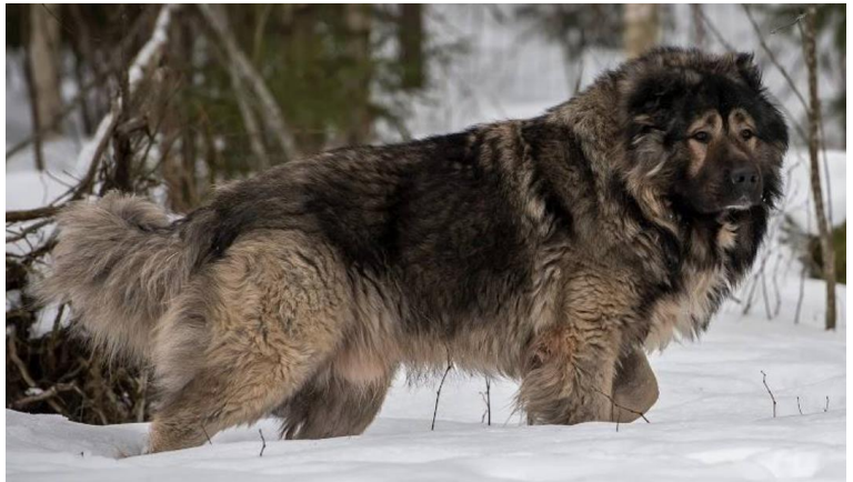
Hanar med utmärkta bröstorgar och buklinjer.