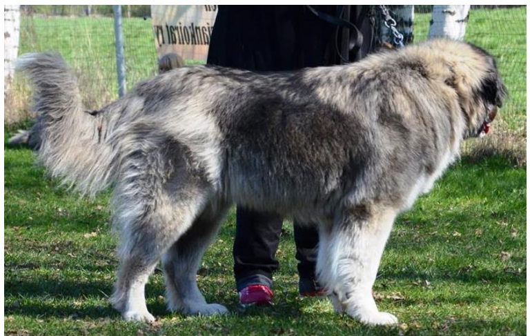
Hane med bra svansföring.