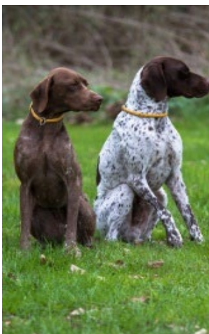
brun resp. brun o vit.

Kommentar: Färgen är antingen brun, brun och vit, brun och vit med många prickar, brun med tanteckning, samma som den gascognska typen, bilder, se nedan.