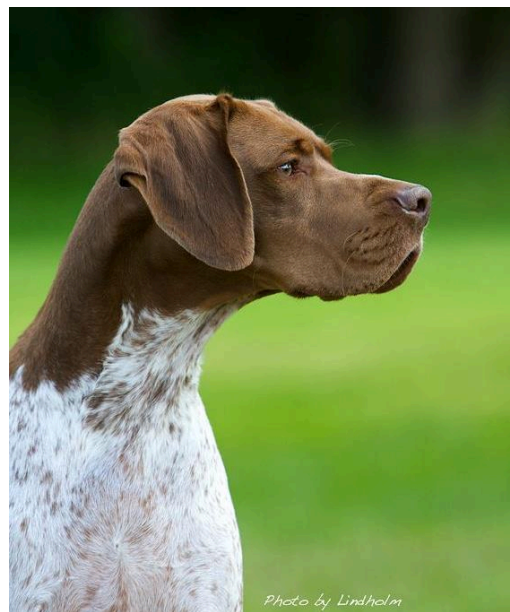
Utmärkt huvud och hals.

Halsen skall ha föga eller ingen hakpåse.