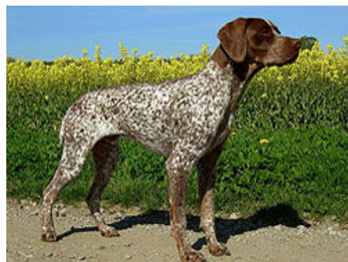
Brun och vit med många prickar.