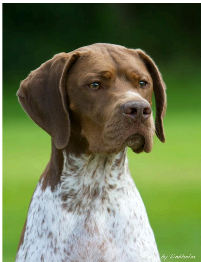
Maskulin hane med vackert huvud och uttryck.

Två individer har startats på fältprov, varav en har gått till såväl första - som andrapris i UKL. De Braque Français, type pyrénées som nu finns i landet är alla utställda och har fått CK.