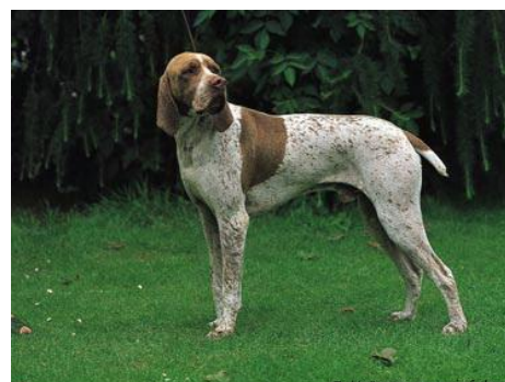
Braque français, type gascogne.