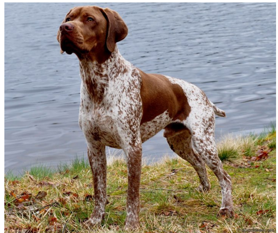
Hane av utmärkt typ.