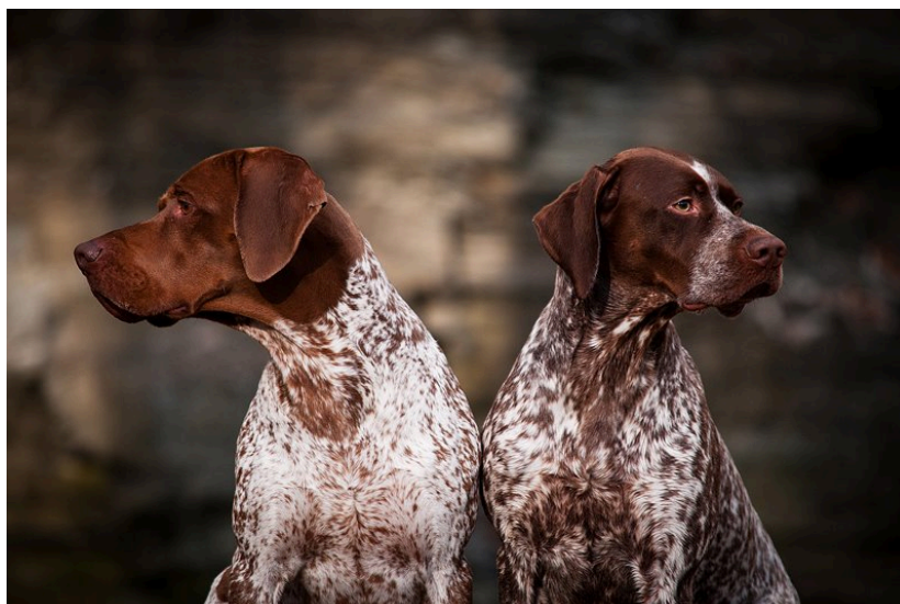
Hane och tik med bra huvuden.