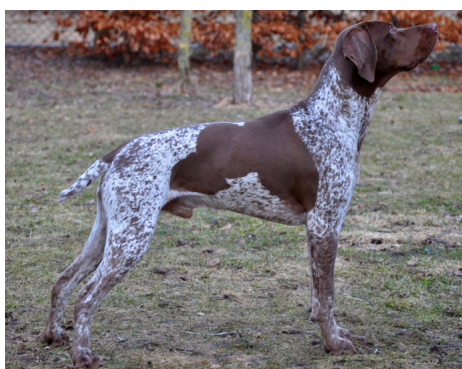
Braque français, type pyrénées.

Rasen skall vara robust utan att vara tung, men tillräckligt musklad. Huden skall vara mer stram än hos den gascognska typen.