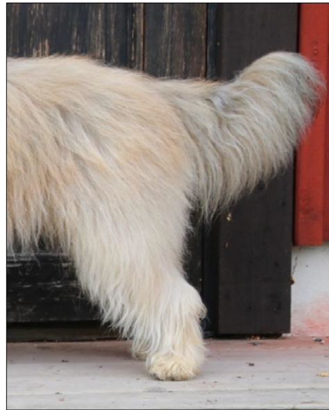
Korrekt vinkel bak

Underbenen skall ha kraftig benstomme och vara väl musklade. Vinkeln mellan lårben och underben skall vara cirka 120°.