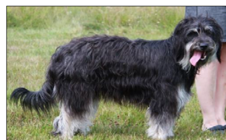
Black and Tan (Svart eld)