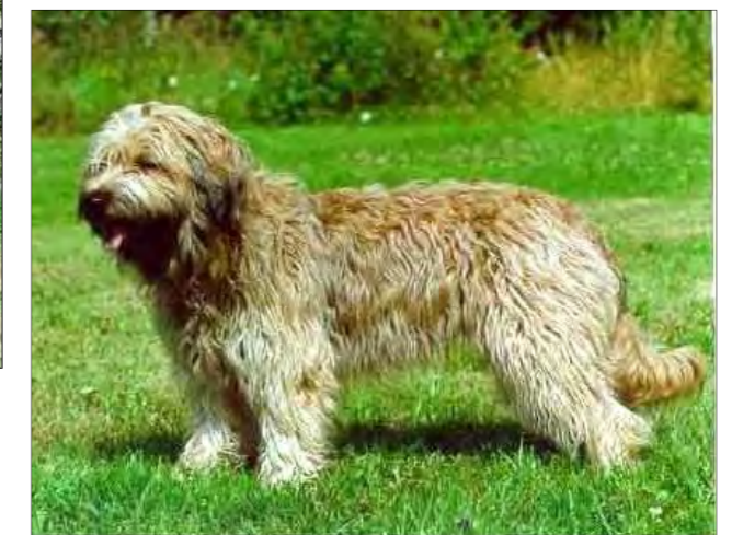
Kraftig tik av utmärkt typ med naturlig hållning, korrekta vinklar fram och bak.