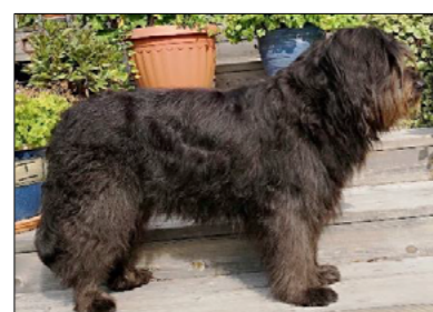
Svart rimfrost / Svart