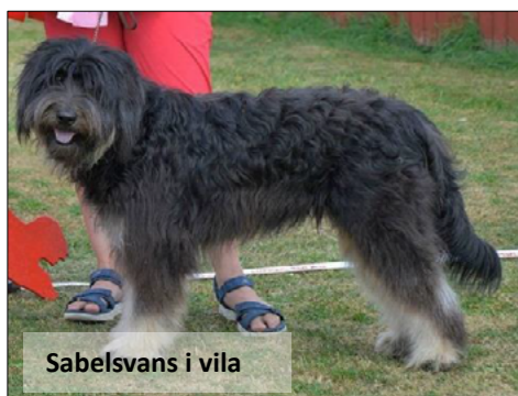
Sabelsvans i vila