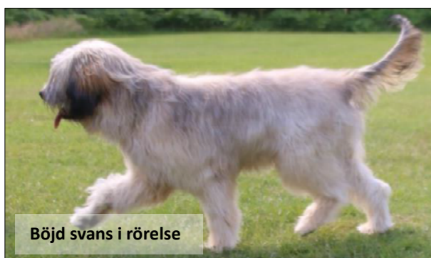
Böjd svans i rörelse