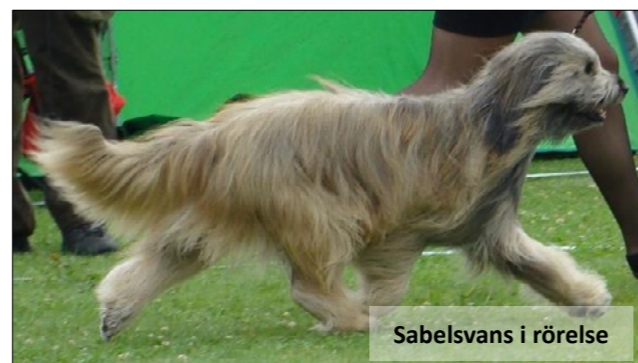
Sabelsvans i rörelse