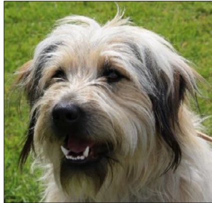
Uttrycksfull och alert blick

De skall vara mörkt bärnstensfärgade, med svartpigmenterade ögonkanter.