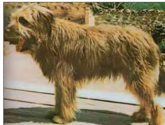
1974 blev Menut rasens första spanska champion.