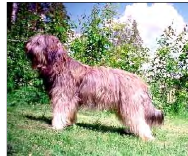
Hane av utmärkt typ med kraftigt maskulint huvud och rätta proportioner.

Tack vare sin storlek, sin vackra päls, sin intelligens och sin stora trofasthet gentemot sina ägare kan den också fungera utmärkt som sällskapshund.