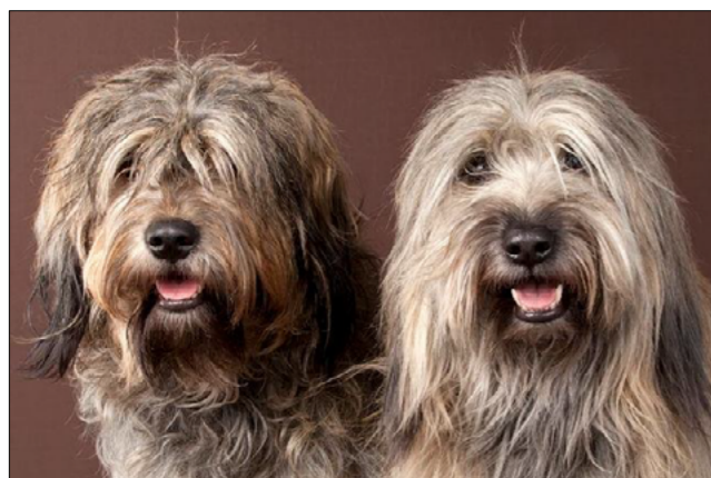
Utmärkta huvuden med korrekta uttryck och korrekt pigmentering.

Enligt FCI standarden så är det diskvalificerande med huvud som liknar Berger des Pyrénées eller Briard.