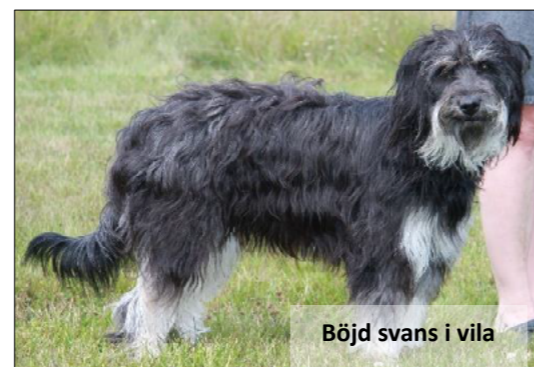
Böjd svans i vila