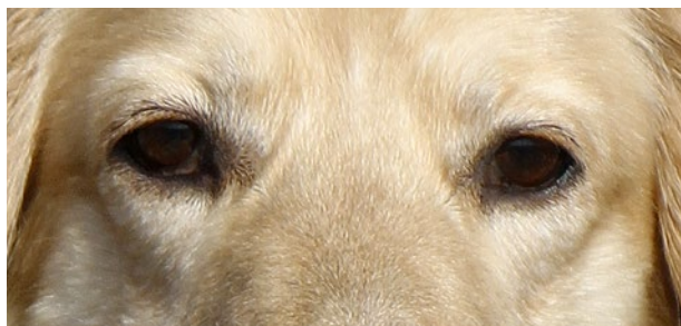
Hund med mörka ögon.

Den kraftiga halsen skall vara medellång och huden stram.