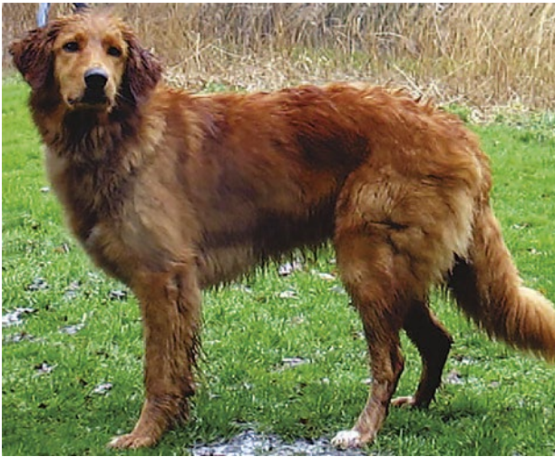
Så kallad "berlinerblond" (diskvalificerande).