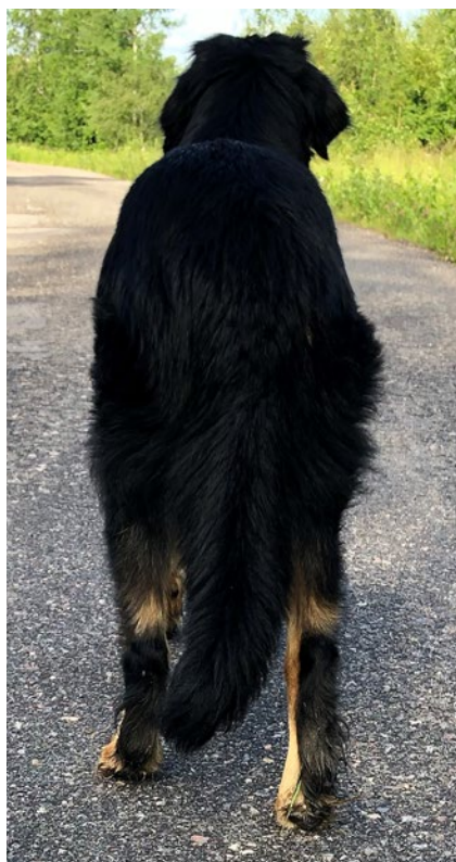
Hovawart med utmärkt bakställ.

Tassarna skall vara runda, kraftiga och kompakta. Tårna skall vara välvda och tätt slutna. Sporrarna skall tas bort utom i de länder som förbjuder detta. Klorna skall vara svarta hos svarta hundar med tan-teckning och hos svarta hundar. Hos de blonda kan klorna vara mindre pigmenterade.