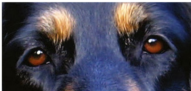
Hund med mellanbruna ögon.