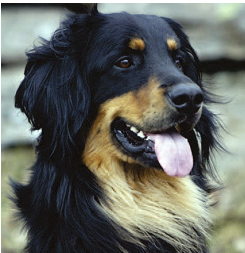
Hanhundshuvud med utmärkt teckning och färg.

Man talar om sk uppljusningar när en blond hovawarts päls ljusnar av mot buken och benen. Ibland, speciellt om hundens grundfärg är väldigt ljus, kan uppljusningarna te sig som nästan vita. Det är dock tillåtet, men det skall inte förväxlas med vita tecken utanför tillåtna områden. Helröda hundar sk "berlinerblonda" är inte tillåtet.