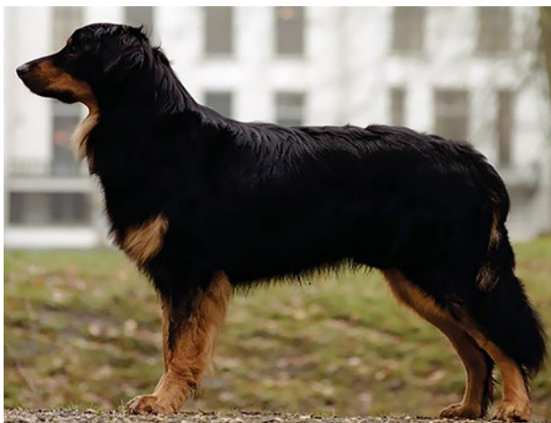
Utmärkt tik med bra pälsstruktur och utmärkt färg på teckningen.