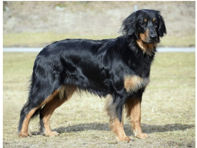
Tikar av utmärkt typ med tydlig könsprägel, bra päls och färg.