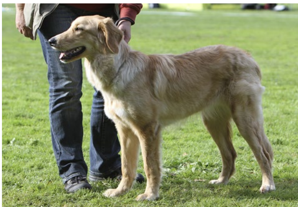
Hovawart med alldeles för kort pälsängd.

Några små vita fläckar på bröstet och några enstaka vita hårstrån på tårna och svansspetsen är tillåtna.