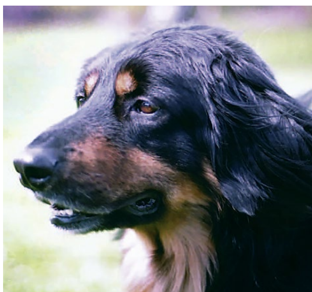
Hanhundshuvud med för lågt ansatta öron samt klen underkäke.

Ögonfärgen påverkar helhetsintrycket av huvudet var uppmärksam på hundar med för ljusa ögon.