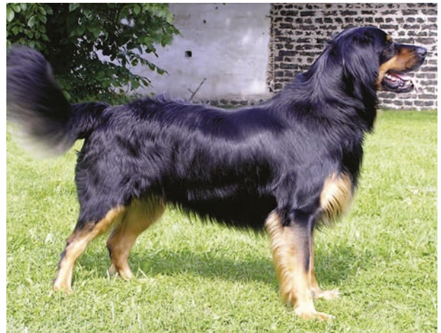
Hane av utmärkt typ med tydlig könsprägel