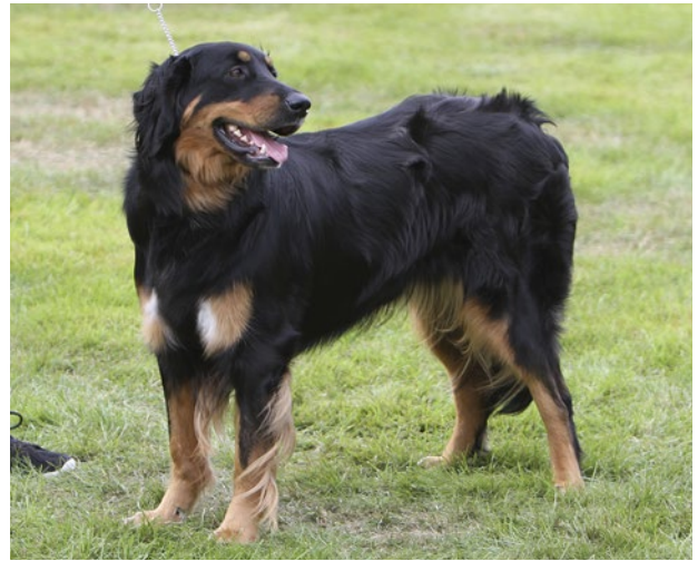
Korrekt separerade bröstfläcka, men de två vita bröstfläckarna medför diskvalificerande fel då endast små vita bröstfläckar tillåts.