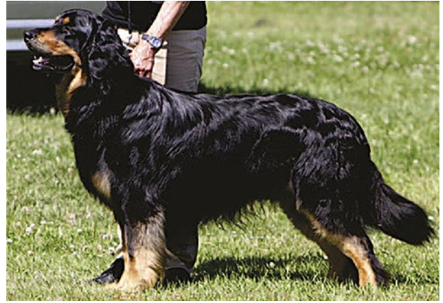
Hanar av utmärkt typ med tydlig könsprägel, bra päls och färg.