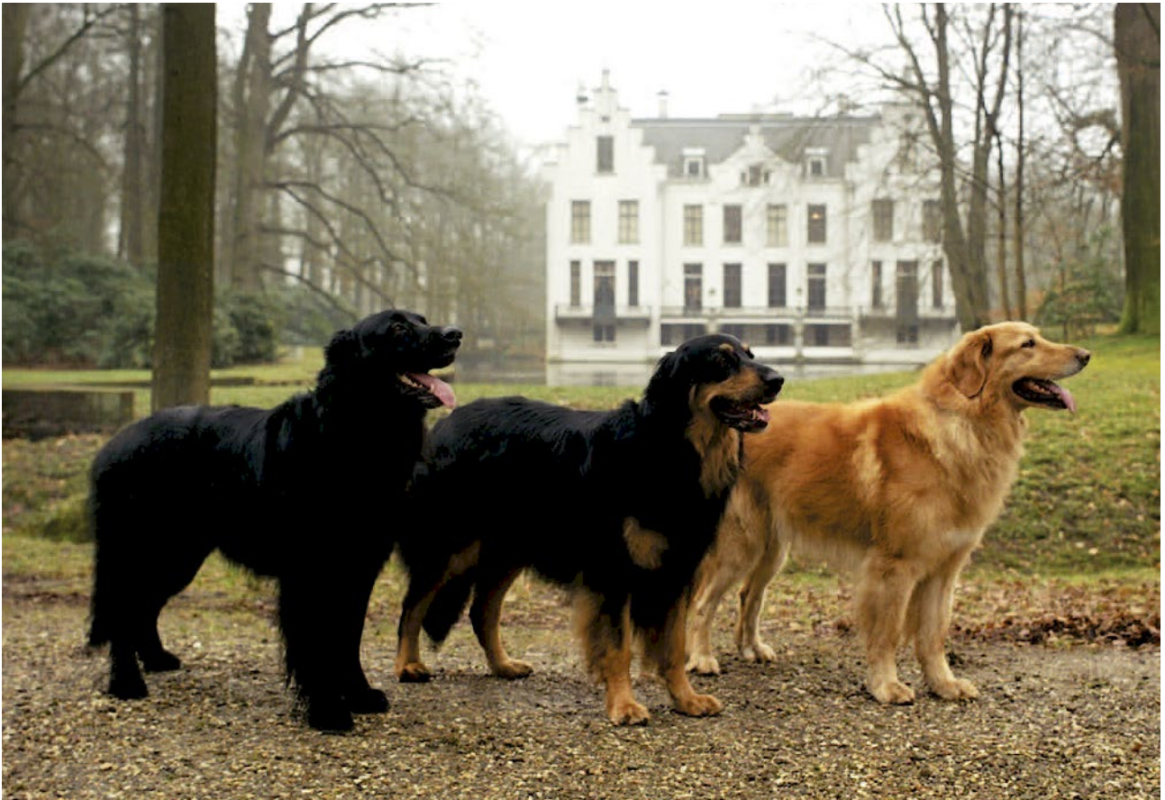
Tre kraftfulla individer i de olika färgerna och utmärkta representanter fångade på samma bild.