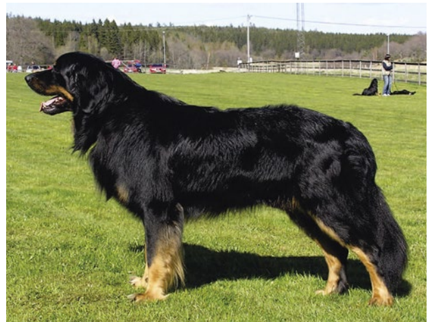
Hane med kraftig benstomme och muskulösa skuldror. Här syns det korrekta framstället tydligt.