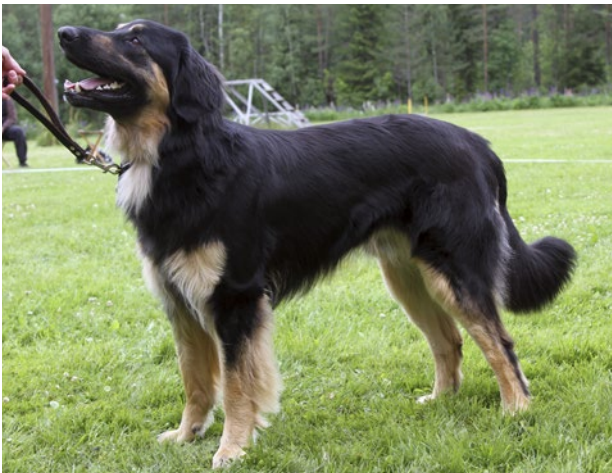
Hane utan tydlig könsprägel.