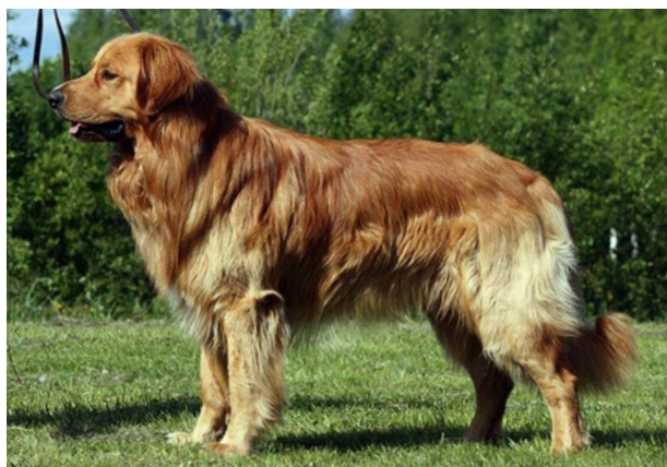
Blond hane med utmärkt päls åt det rödare hållet, fullt tillåtet då den har korrekta uppljusningar.