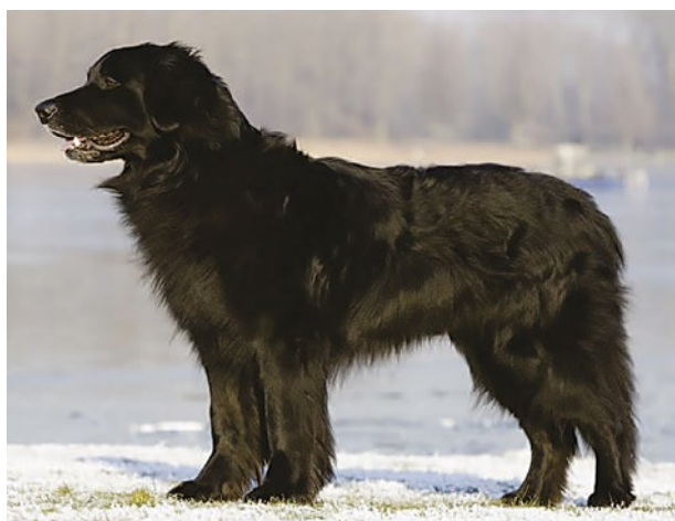
Svart hane av utmärkt typ. Färgen är djupsvart.

Pälsen skall vara svart och glänsande med mellanblonda tecken. På huvudet börjar tan-teckningen på nospartiets sidor och sträcker sig runt mungiporna ner till strupen. De punktformiga tecknen över ögonen skall vara tydliga. Bröstteckningen består av två intilliggande fläckar som kan gå ihop. På frambenen når tan-teckningen från sidan sett från tårna till ungefär handloven och når på baksidan upp till armbågarna. På bakbenen skall tan-teckningen från sidan sett synas under hasorna som breda streck och ovanför hasorna bara