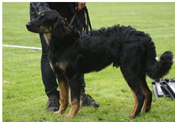
Päls med teddystruktur.

Pigmentet på ögonkanter, läppar och trampdynor skall vara svart.