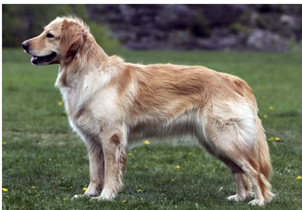
Blond tik av utmärkt modell med korrekt färg och uppljusningar.