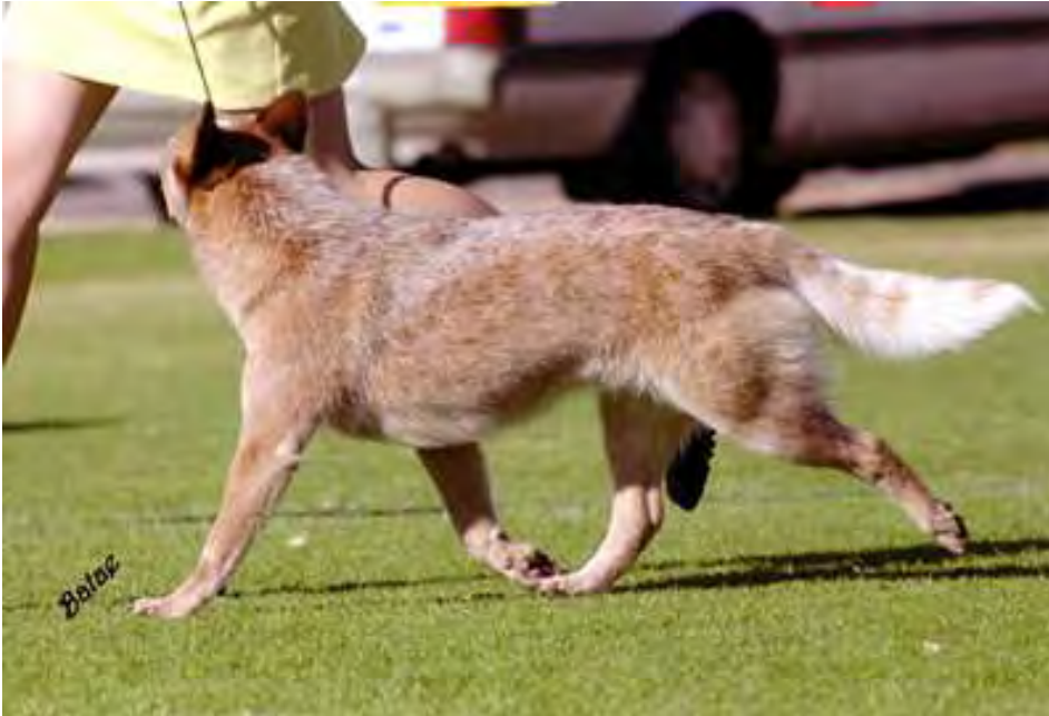
Bild: Tik med utmärkta rörelser och korrekt svanshållning.

Svans: Svansen skall vara tämligen lågt ansatt och följa konturen av det sluttande korset. Den skall räcka ungefär till hasen. I vila skall den hänga i en mycket lätt båge. Under rörelse eller upphetsning får den höjas men under inga omständigheter får någon del av svansen bäras in över ryggen. Svansen skall vara väl behårad.