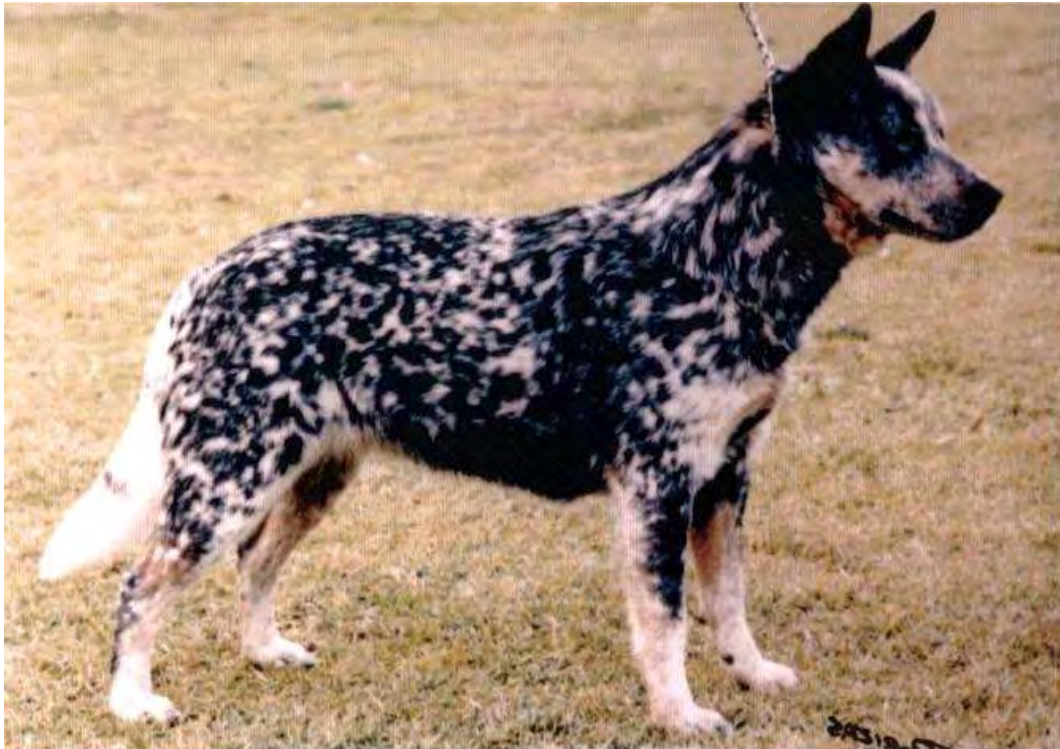
Bild: Tik av CK-kvalitet med godkänd färg. De vita fläckarna skall vara högst 1,5 till 2 cm i diameter, inte större.

Rödfläckig: Färgen skall vara klart rödspräcklig överallt inklusive underullen (färgen får inte vara vit eller gräddfärgad) med eller utan mörkare röda tecken på huvudet. Symmetriska tecken på huvudet är önskvärda. Röda tecken på kroppen är tillåtna men inte önskvärda.