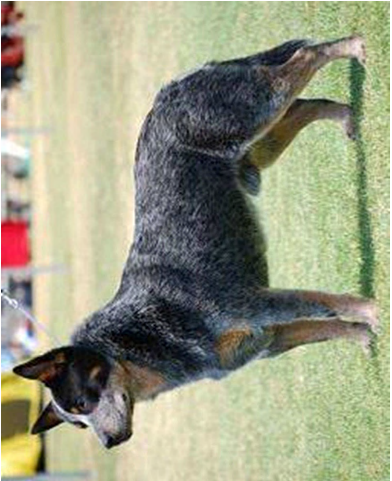
Bild: Champion-hane nära idealet.