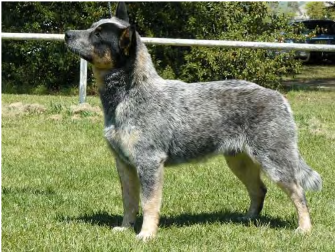
Bild: Tik av CK-kvalitet med bra spräcklig färg.