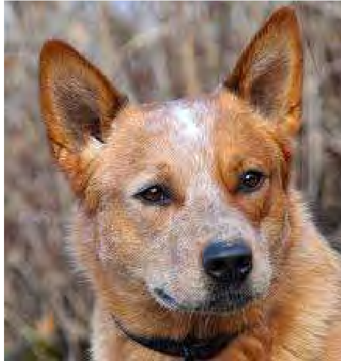
Bra huvud med korrekta ögon och öron

En ACD skall ha ett svagt men dock tydligt stop. Hos en del hundar saknas stopet nästan helt och sådana avvikelser skall därför alltid noteras liksom ett alltför markerat stop.