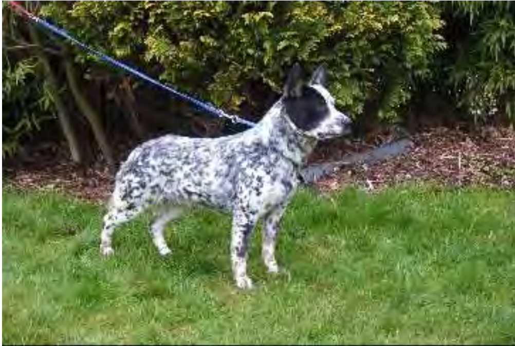
Bild: Tik som enligt standarden inte har godkänd färg.

Färgen kallas reversed mottled i Australien och är inte godkänd där. Hundar med denna färg har rönt framgångar på utställningar runt om i Europa och även USA. Dessa hundar förefaller vita med blå fläckar i stället för korrekt blå med vita fläckar.