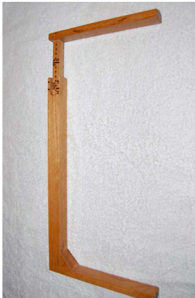
Mätsticka av trä