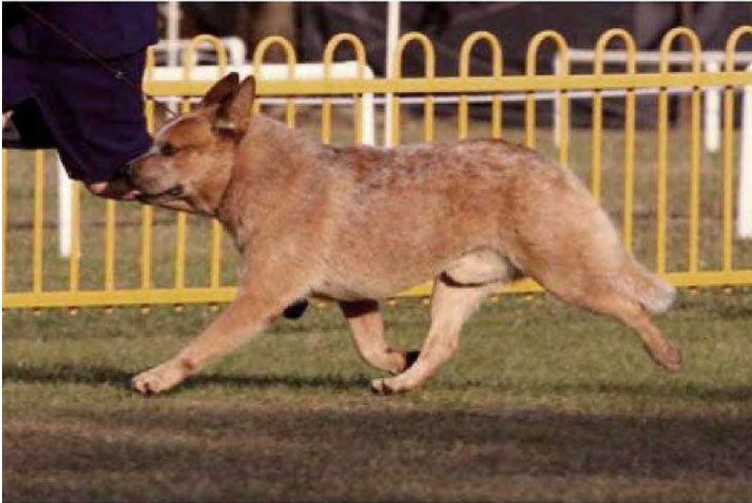
Bild: Hane med utmärkta, vägvinnande rörelser.