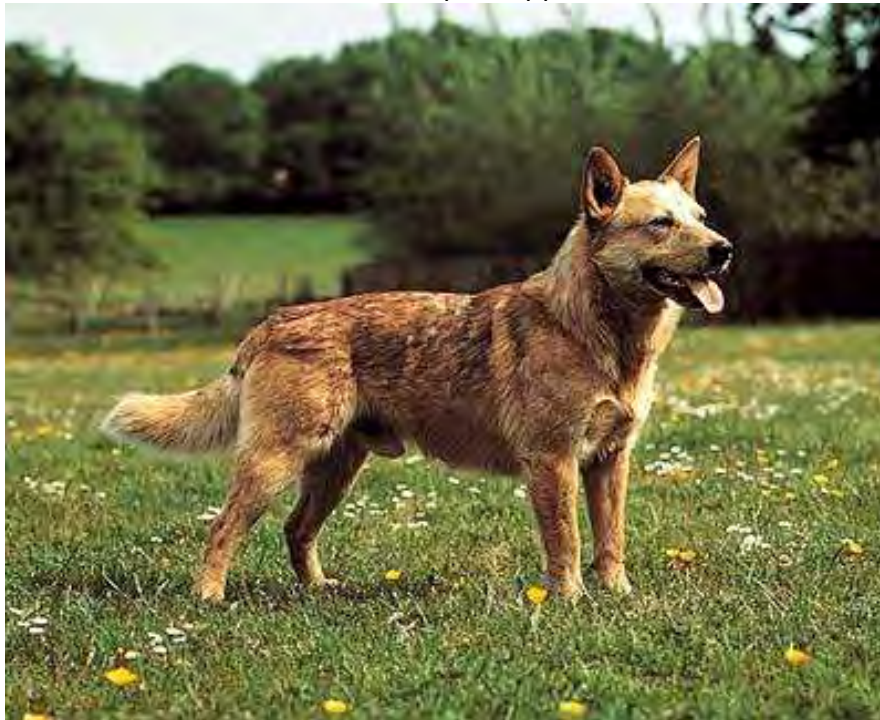
Bild: Hane med korrekt färg

Rödfläckig: Färgen skall vara klart rödspräcklig överallt inklusive underullen (färgen får inte vara vit eller gräddfärgad) med eller utan mörkare röda tecken på huvudet. Symmetriska tecken på huvudet är önskvärda. Röda tecken på kroppen är tillåtna men inte önskvärda.