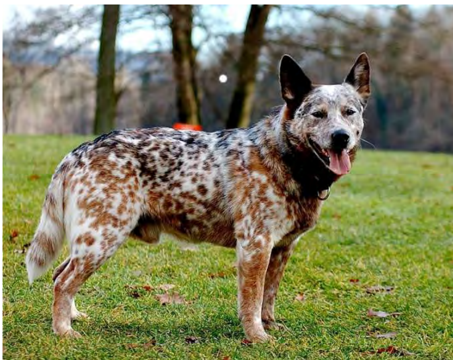
Bild: Hane som enligt standarden inte har godkänd färg.