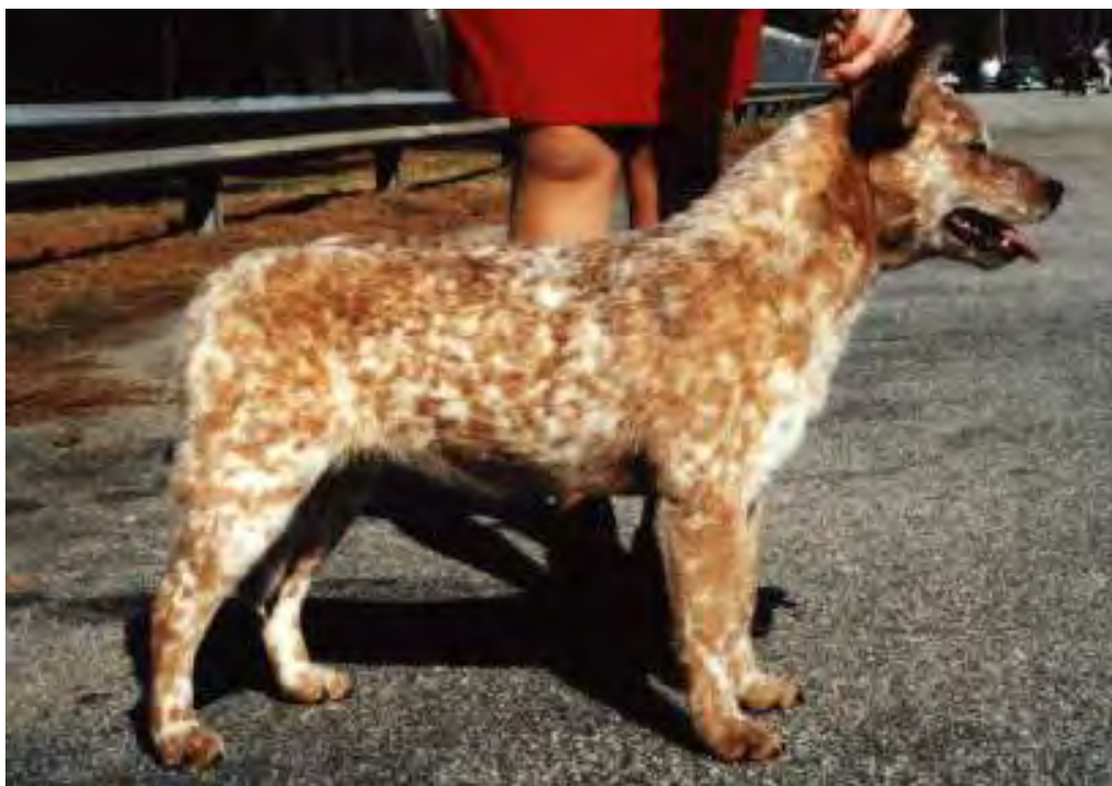
Bild: Tikvalp som enligt standarden inte har godkänd röd färg.