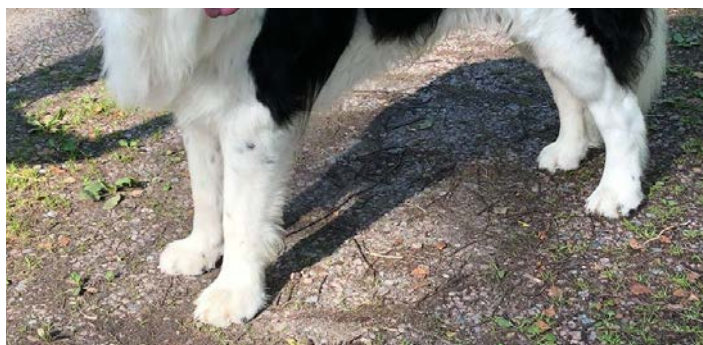
Kraftiga och välformade framtassar, så kallade kattassar