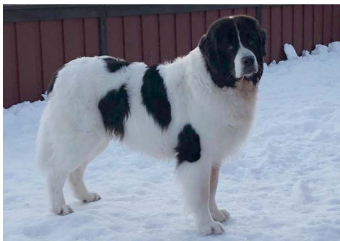
En hund med utmärkt rygg, muskulöst ländparti. Den här hunden har också utmärkta proportioner, kroppen är bred och kraftig.