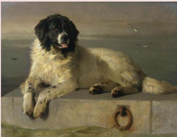
A Distinguished Member of the Humane Society by Sir Edwin Landseer (1831/1838) "En framstående medlem av livräddningssällskapet"

Utvecklandet av landseer-raserna i Europa gick dock långsamt och första världskriget fick det hela att stanna upp. Men 1933 skrevs de första landseervalparna från kennel von Scharthenberg in i stamboken. Utan den engagerade och målmedvetne uppfödaren Otto Walterspiel från München hade det inte funnits någon landseer av kontinental typ. 1961 blev rasen officiellt erkänd av FCI.