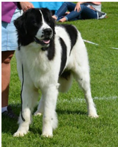
En hund med korrekt hals, bra och bred nacke.

Korset skall vara brett. Den fasta muskulaturen gör korset vackert avrundat på sidorna och baktill.