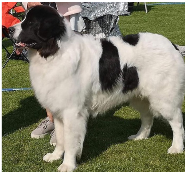
En hund med korrekta vinklar på armbågar och framställ, muskulösa överarmar och kraftiga underarmar. Korrekta armbådar som sluter an mot bröstkorgens djupaste del.