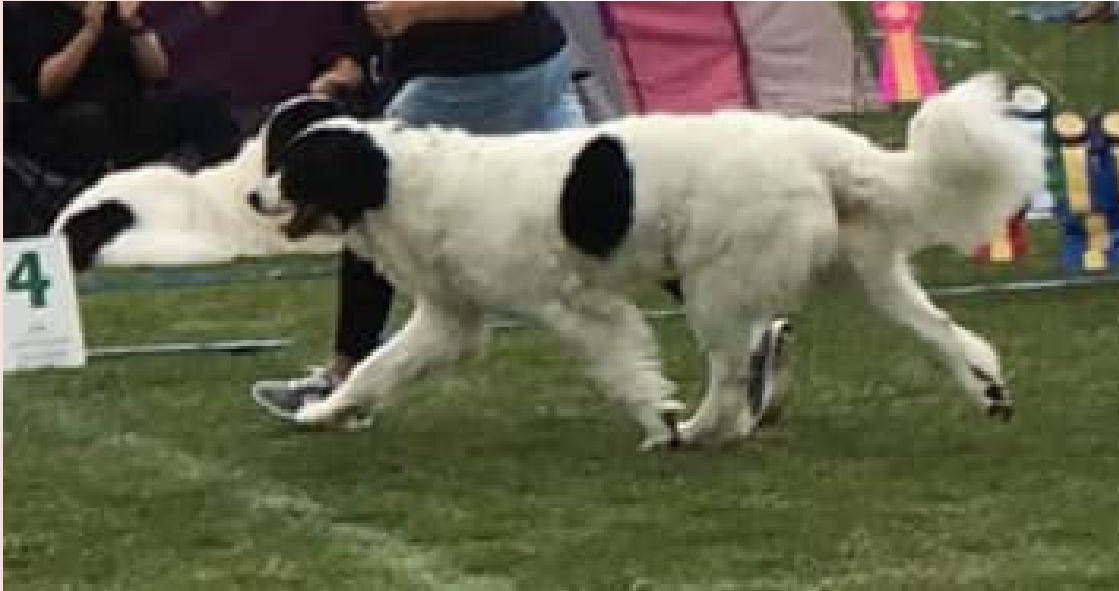
En Landseer som rör sig effektivt och vägvinnande