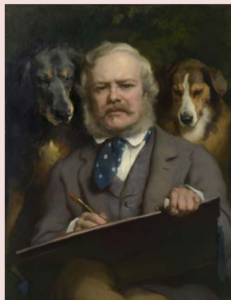
Sir Edwin Landseer (1802-1873)