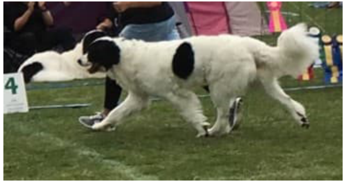
En hund som rör sig utmärkt, spänstigt och vägvinnande.