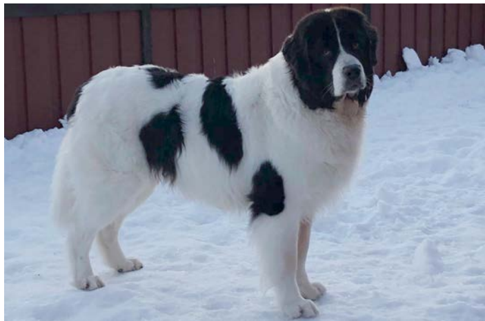
En hanhund med korrekta proportioner på skallpartiet, brett och massivt. Nackknölen ska vara väl utvecklad, vilket kan vara svårt att se på bild på en hund med svart päls.