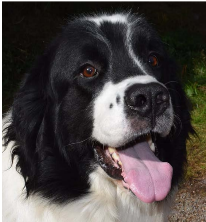
En hund med mörka mandelformade ögon och vänligt uttryck. Fina färger på både ögon och päls.