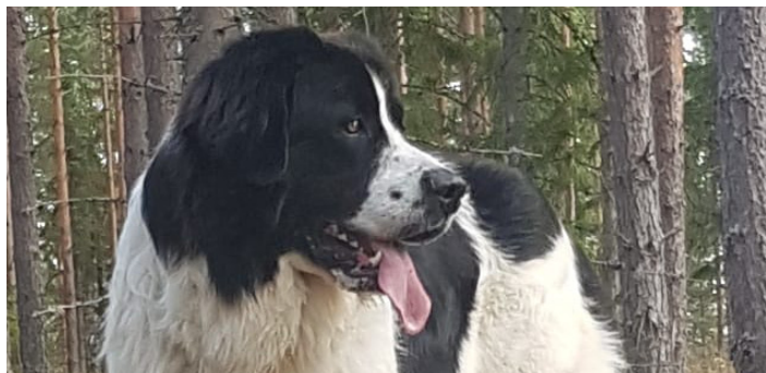
En hanhund med korrekt svart nostryffel och välformat nosparti.

Bilderna på denna sida visar hanhundar med tydlig könsprägel