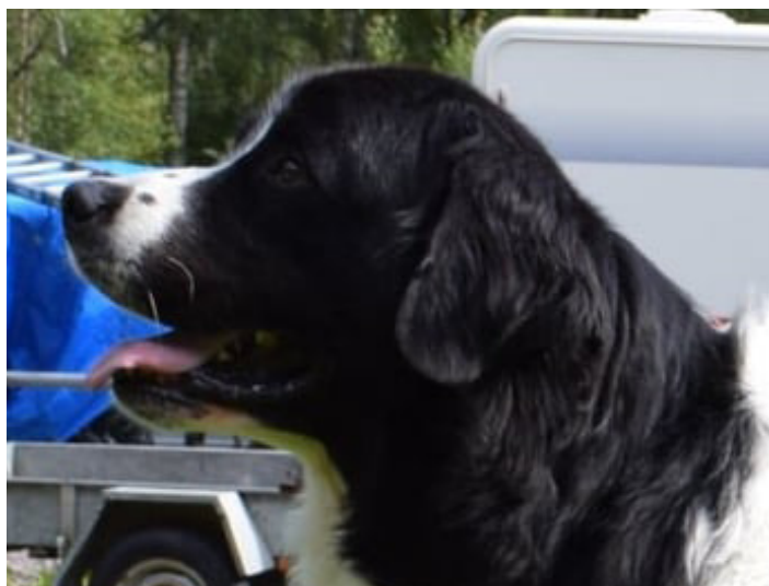
Ett öra med fin form, trekantigt och avrundat nertill. Pälsen på öronen är fin och kort, men det är ibland svårt att urskilja detaljer på bild då hundens päls är svart.