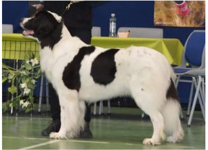
Den här hunden har muskulösa och välformade lår.

Med hjälp av de muskulösa benen rör sig landseer spänstigt och vägvinnande.