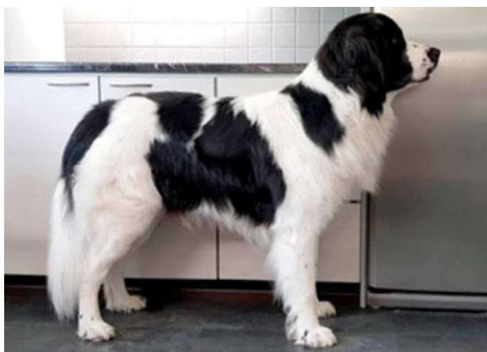
En ung hanhund med utmärkt bakställ, kraftiga och välutvecklade bakben.