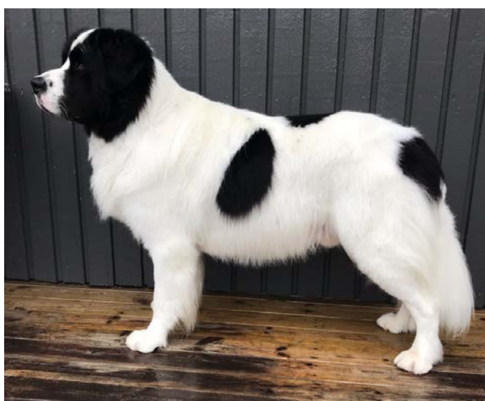
En hanhund med fin proportion och utmärkt kropp, ryggen är fast och plan. Ländpartiet är muskulöst, korset är brett och den fasta muskulaturen är vackert avrundat baktill.