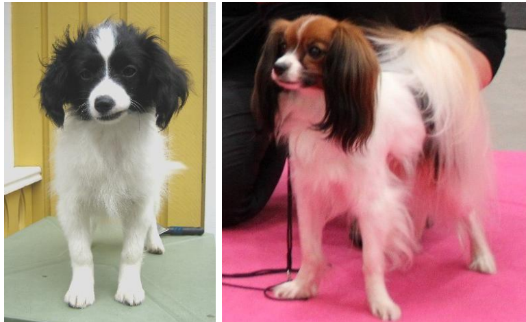
Korrekt framställ och fransyskt framställ

Framtassarna skall vara ganska långa, s.k. hartassar. Belastningen på trampdynorna skall vara jämn. Klorna skall vara starka och helst svarta, men kan vara ljusare hos hundar med rödbruna eller vita pälsar (vita klor hos vita hundar eller hundar med vita ben är inget fel om hunden i övrigt har god pigmentering). Tårna skall vara starka och trampdynorna hårdiga. Behåringen mellan tårna kan nå framför tåpetsarna och bilda en tofs.