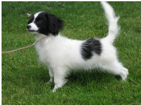
valp o vuxen

Svansen ska vara ganska högt ansatt och ganska lång. Den skall ha en riklig fana som ska bilda vacker plym. När hunden är alert skall svansen bäras lyft i en båge över rygglinjen, varvid svanspetsen får vidröra ryggen. Svansen får aldrig vara rullad eller ligga platt på ryggen.