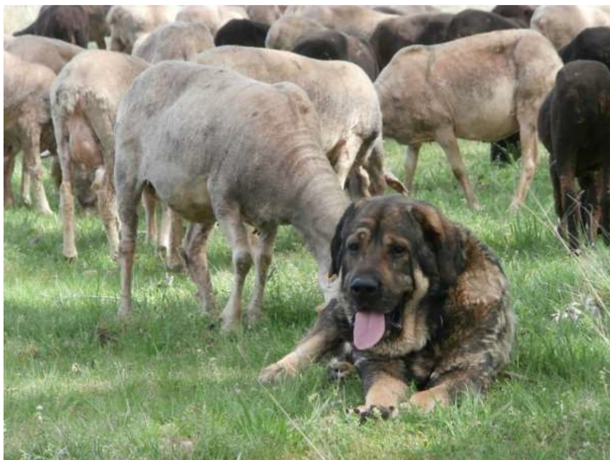
Illama Trabanco de Abelgas

Förenklat RAS där avel för närvarande inte bedrivs i Sverige