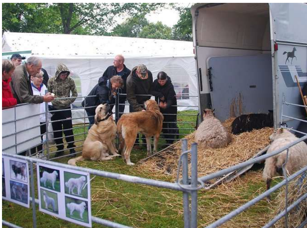
Bilderna nedan är tagna på husdjursmässa i Småland 20140830