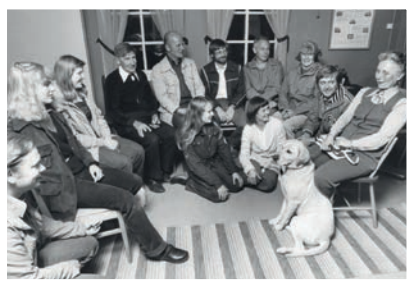
Den sociala samvaron med fodervårdarna var viktig och det var aldrig svårt att få folk att delta i de aktiviteter man ordnade. Här en sammankomst i klubbstugan hos Nyköpings BK.

När det till slut blev aktuellt att ta tag i det här och såväl översyn som förbättrande åtgärder var på tal, insåg man att det var mycket