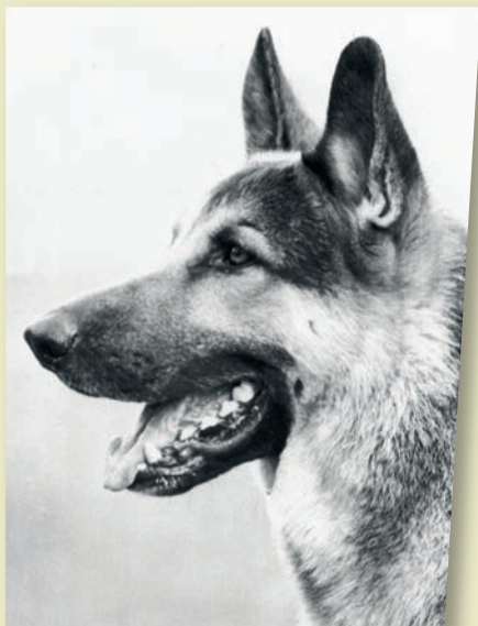
Cools Higgins, till vardags Greif, blev den första schäfern i det blixtska hushållet.