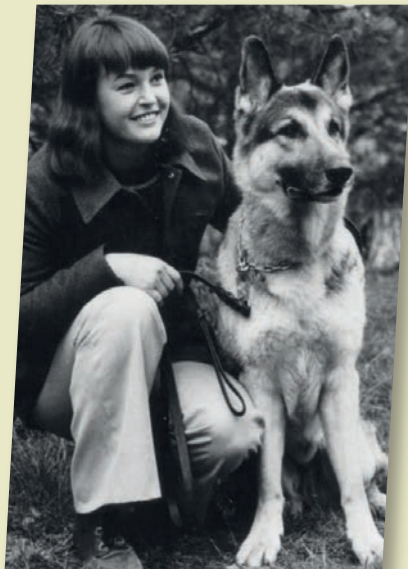
Ingalill och Silverpilens Yster, som blev schäfer nr 2 efter Greif. Han tävlade en del, men vid det här laget konkurrerade många andra hundengagemang om paret Blixts tid och intresse.