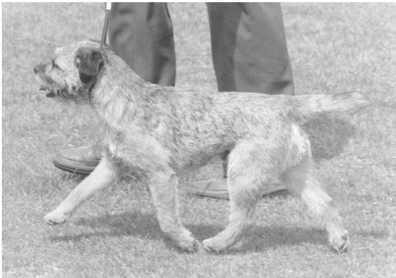
Långa marknära steg. Fram- och bakben sträcks ut i hela sin längd.

En borderpäls skall skydda mot väder och vind. Mjuka pälsar, mycket korta pälsar eller pälsar som inte har tät underull är inte användbara till detta ändamål. Huden (eng. pelt) skall vara tjock och lös på kroppen. Pälsen och huden skyddar även mot skador både i gryt och stenig natur med taggiga växter.