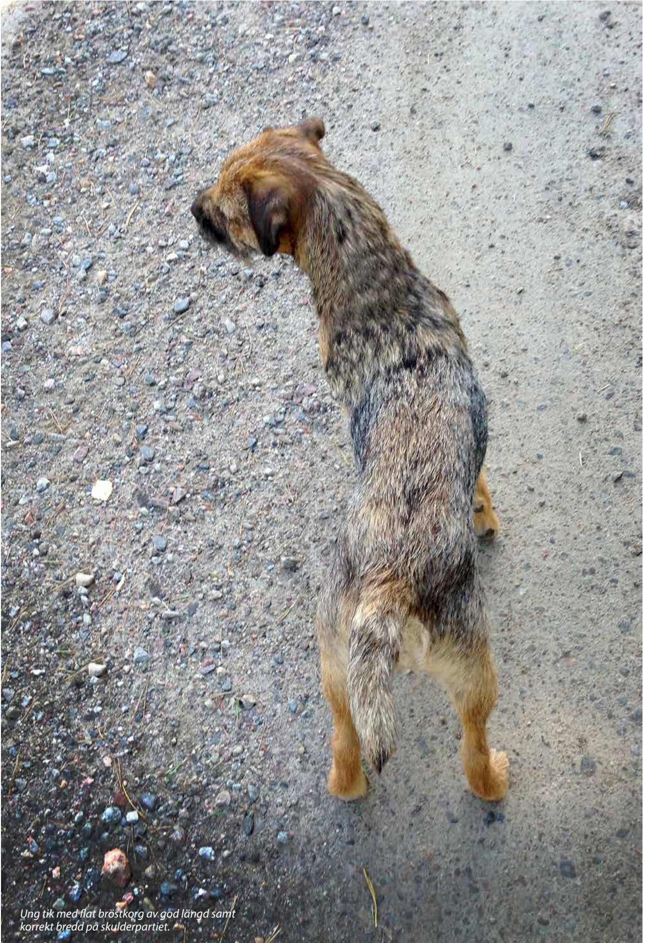
Ung tik med flat bröstorg av god längd samt korrekt bredd på skulderpartiet.