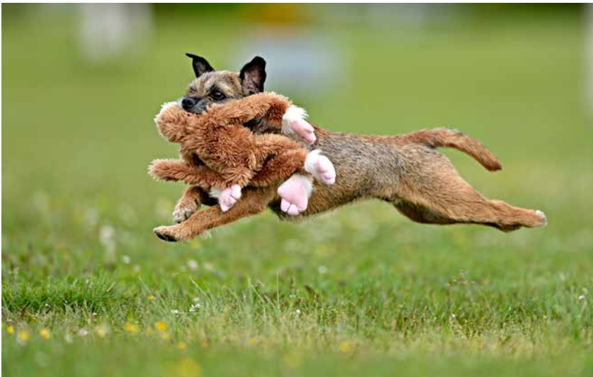
Borderterriern är en aktiv, smidig och snabb hund.