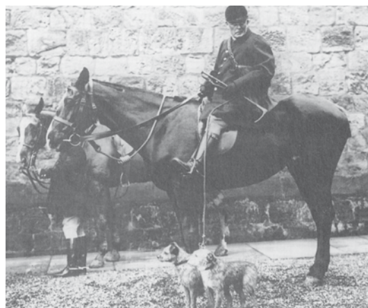
The Percy Hunt" 1912 Borderterrierna heter Weddels Rap och Nailor, och de finns bakom många av dagens borderterrier

Borderterriern kunde också hålla efter råttor på gården, och i fattigare hushåll kunde den hålla familjen och sig själv med mat genom att ta kaniner, fasaner mm.