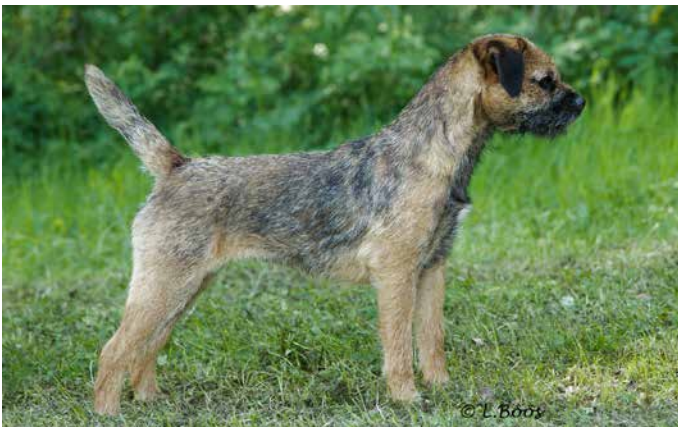
Grizzle and tan har olika mycket inslag av svarta strån.