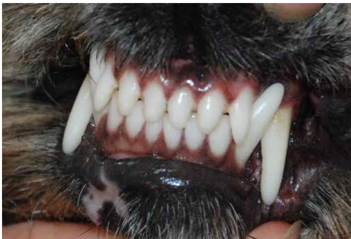
Korrekt bett med stora tänder och rejäl underkäke.