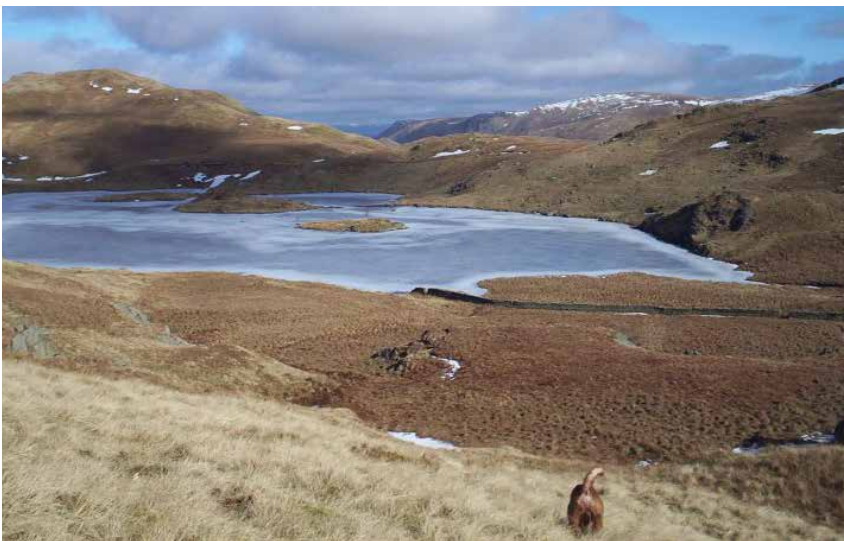
Borderterrierns hemland landskapet i Northumberland