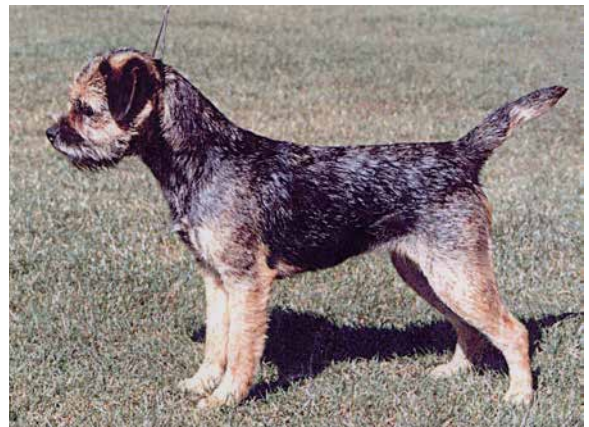
Korrekt blå färg.

Man ska kunna nå runt om bröstkorgen med båda händerna – "spanning"