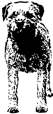
Grov skuldra, bred