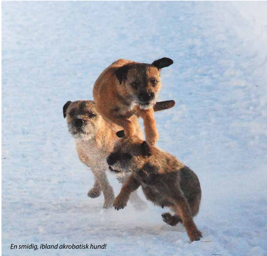
En smidig, ibland akrobatisk hund!