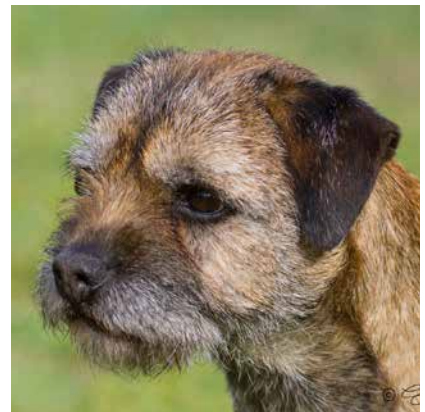
Exempel på huvuden med goda proportioner, måttligt stop, kraftiga käkar och väl utfyllda nospartier.