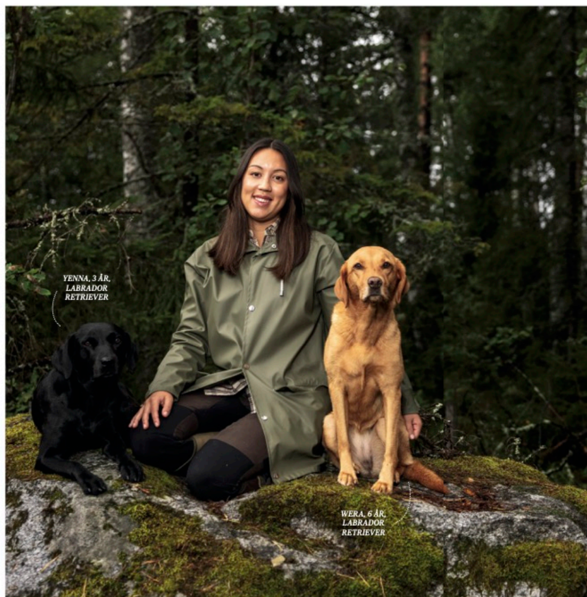
YENNA, 3 ÅR, LABRADOR RETRIEVER