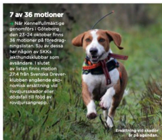
Ersättning vid skador är på agendan.

Läs mer om hur du kan skydda din hund på sidan 12.