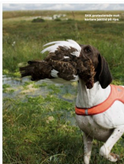
SKK protesterade mot kortare jakttid på ripa.