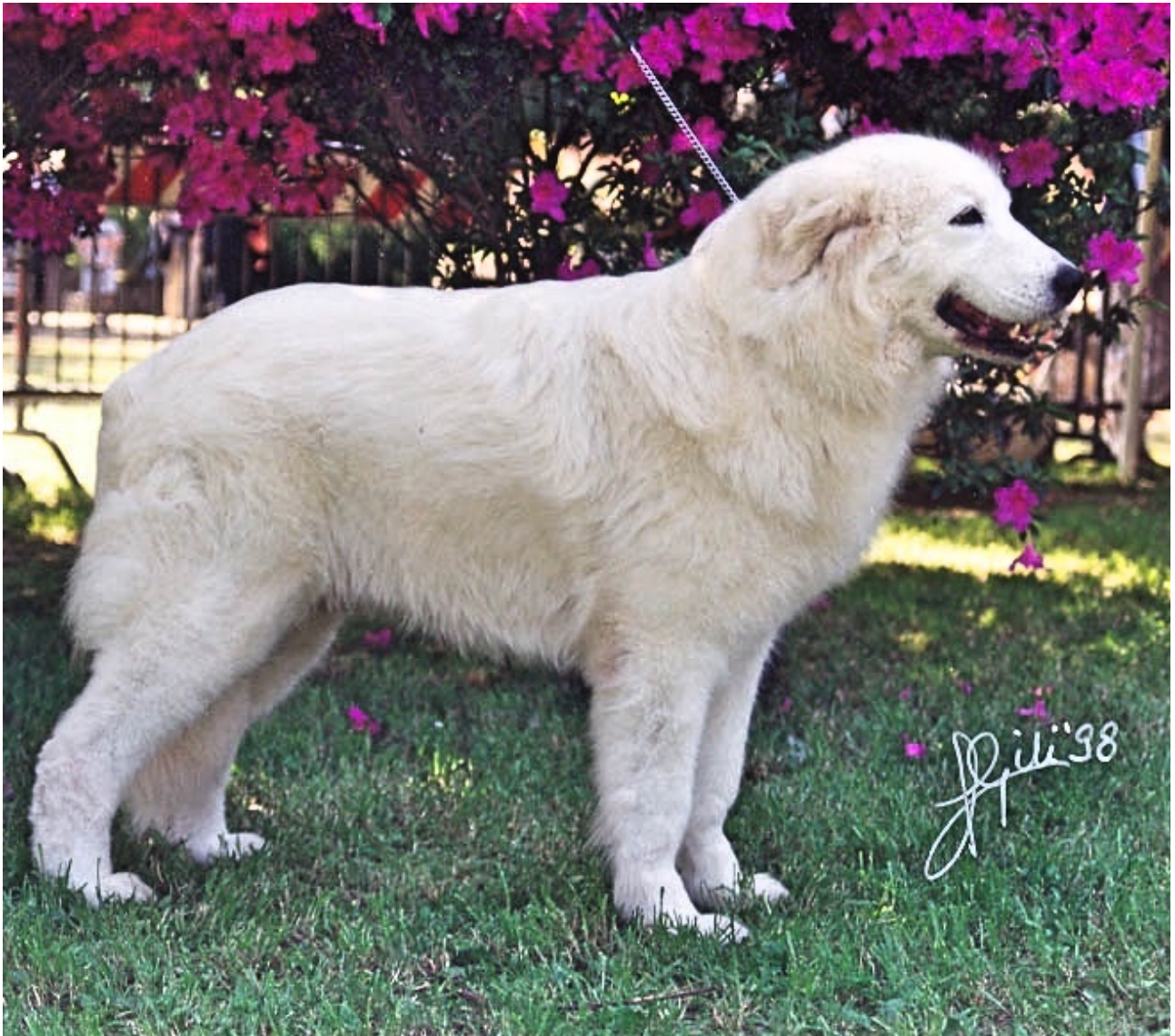
Utmärkt typ med utmärkt fram och bakställ