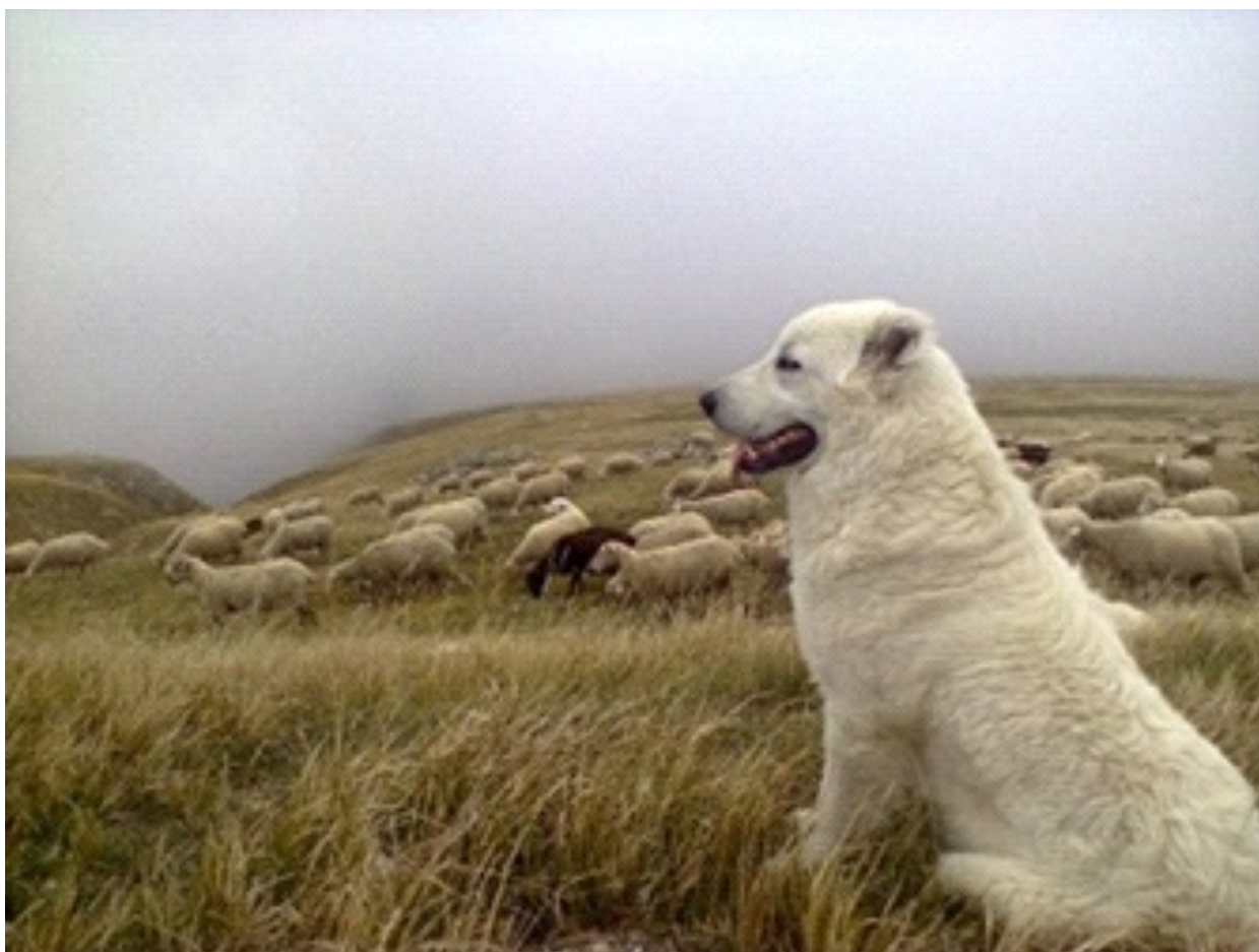
Herdehund med kuperad öron i arbete

Trots riskerna och svårigheterna lever en Maremmano Abruzzese som fårväktare ett av de bästa liv en hund kan ha. Den är aldrig bunden, lever i en naturlig omgivning med en liten social grupp där den är respekterad och inga artificiella restriktioner begränsar dess levnadssätt.