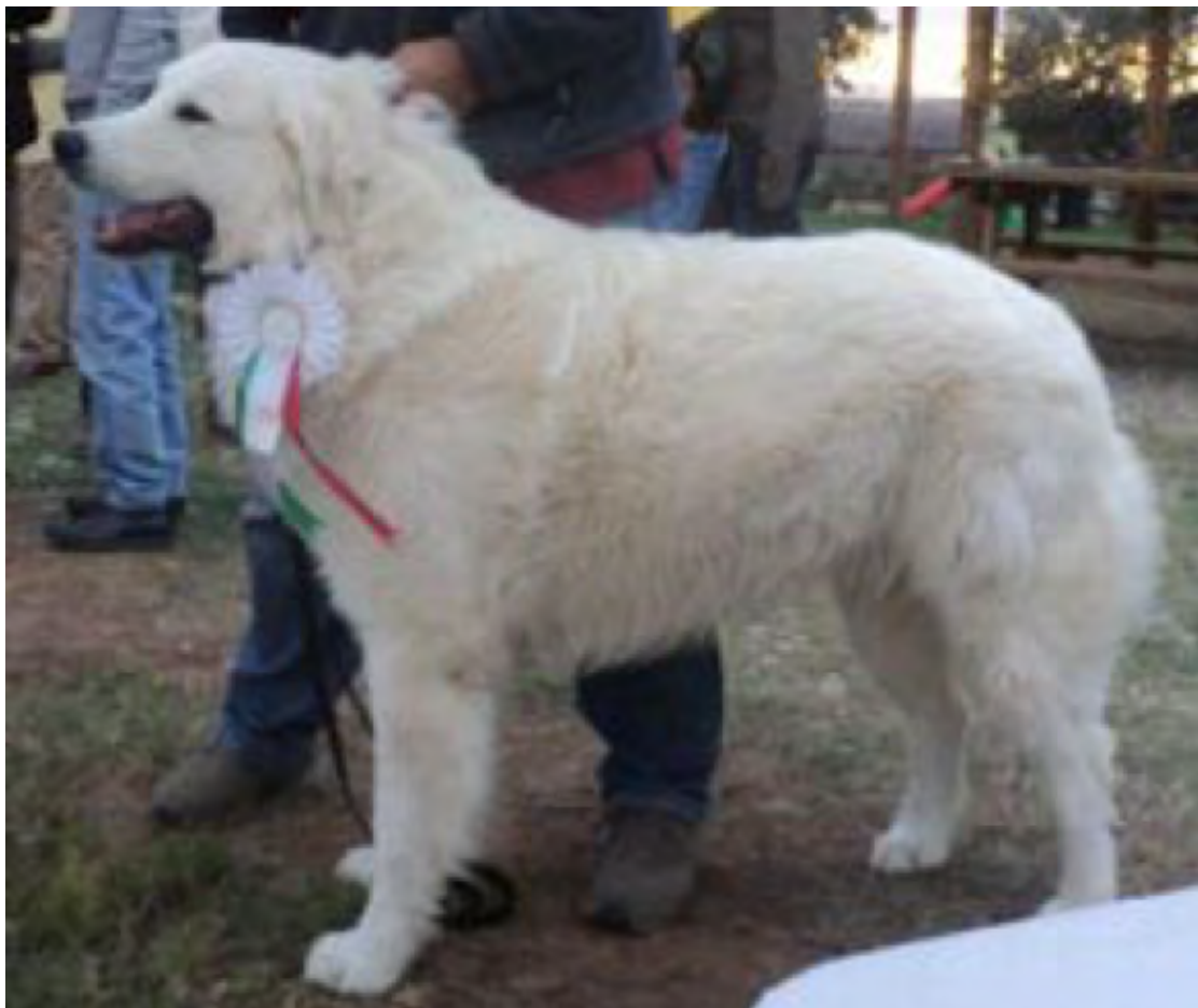
Välformat huvud och i övrigt en utmärkt hund