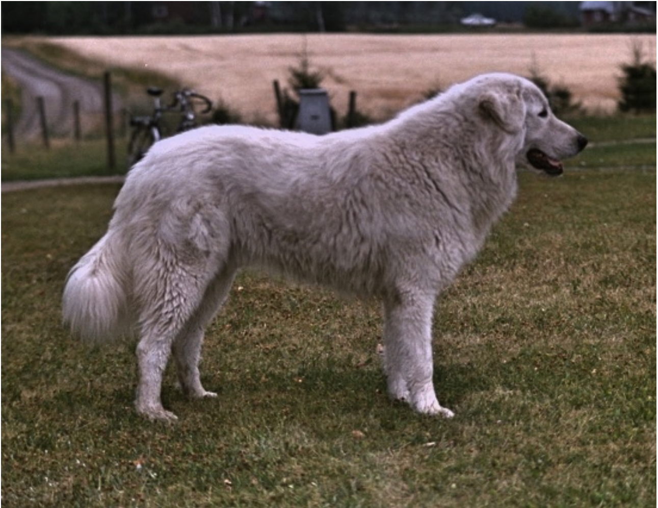
Utmärkt rygg och svans