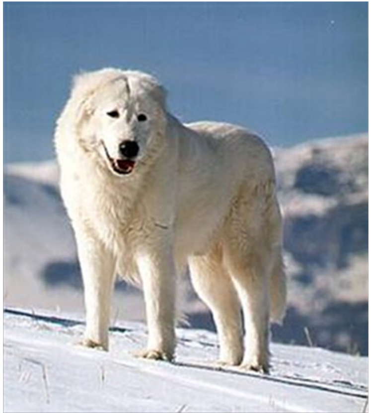
Arbete under vinterförhållande