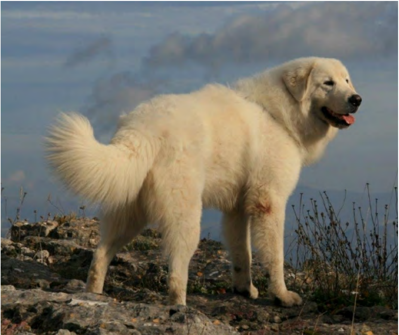
Bra bakställ kors och svans.