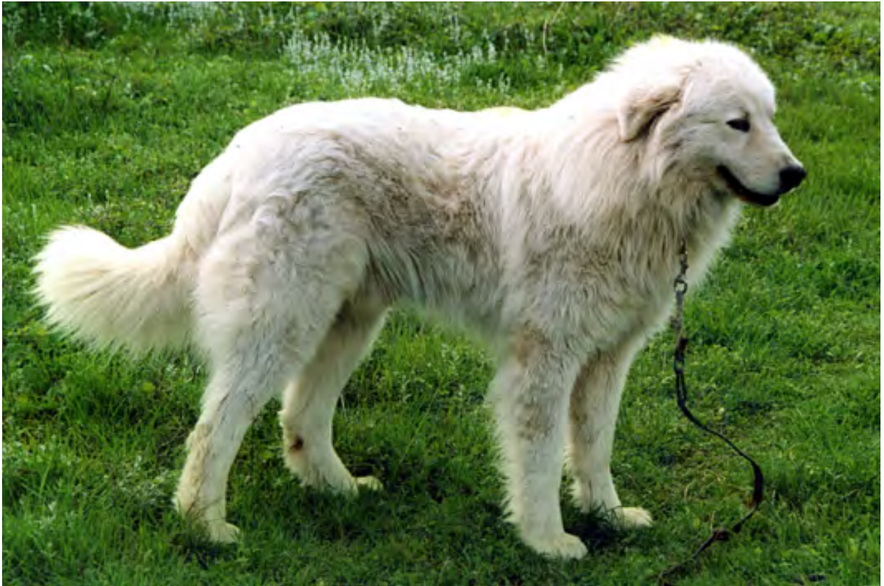
Svansen väl ansatt med bra längd