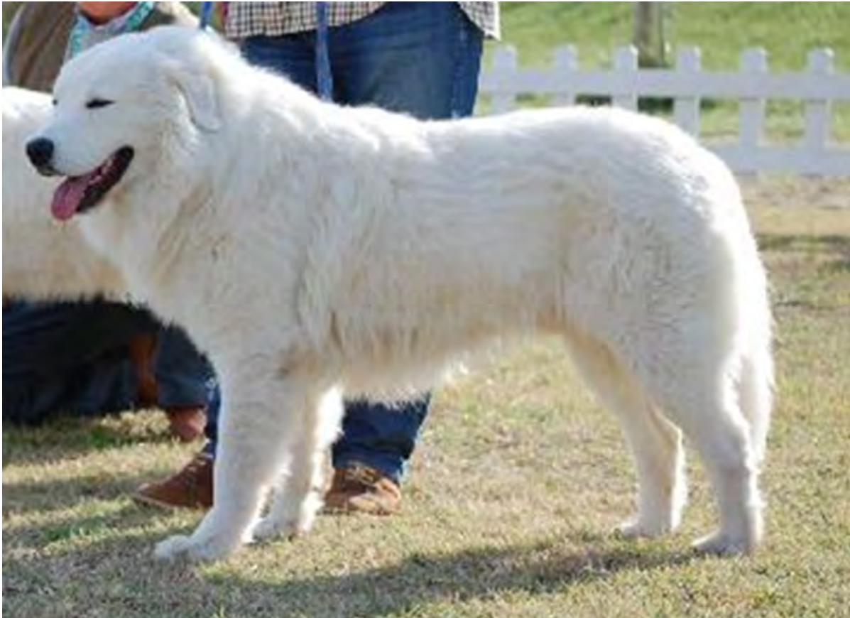
Hund med utmärkt helhet