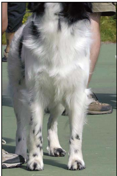
Mycket bra front i stående

Framtassar Framtassarna skall vara starka, kompakta och lätt ovala. Tårna skall vara väl välvda, slutna och framåtriktade.