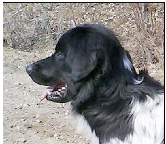
För markerat stop