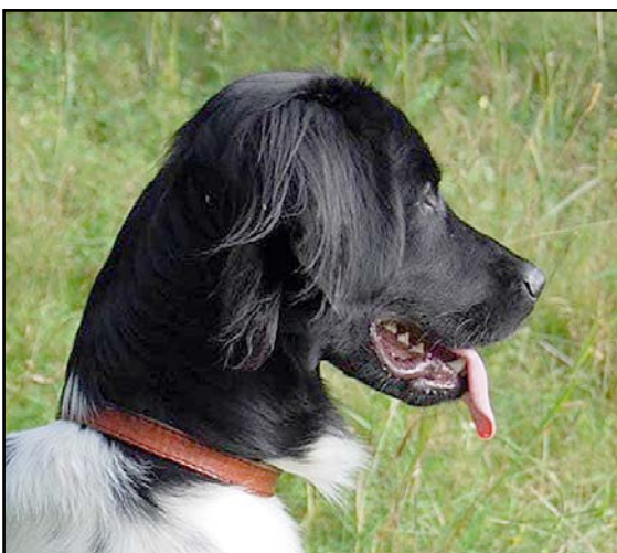
För rund skalle och för mycket mungipa

Stopet. Skallen skall slutta gradvis mot nospartiet. Sett från sidan verkar stopet mer markerat på grund av de utvecklade ögonbrynen.