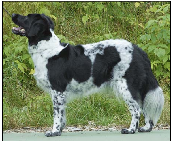
Överbyggd, vanligt fel på rasen