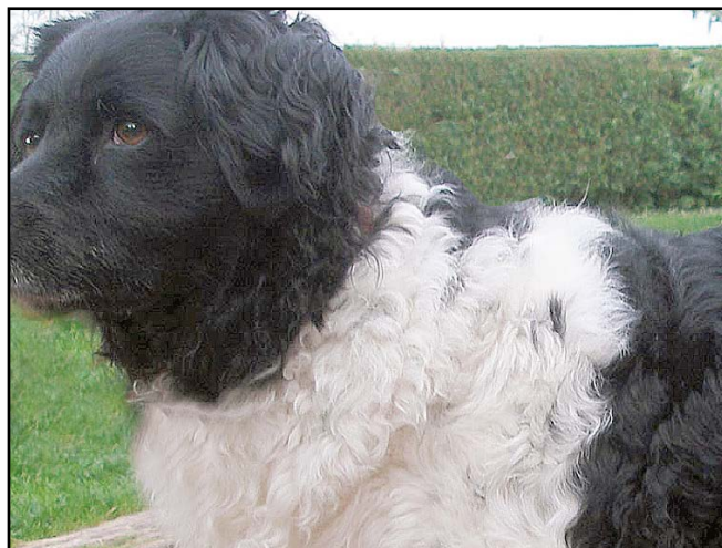
För lockig päls. Inslag av wetterhoun?

Färg Tvåfärgad i svart eller leverbrunt med vita tecken, men även svartskimmel eller brunskimmel är tillåtet. Prickar och/eller skimmelteckningar i det vita kan förekomma. Huvudet skall vara svart eller leverbrunt, med eller utan bläs. Båda dessa färger förekommer med eller utan stora fläckar. Päls med distinkt sadel är tillåtet. Tanteckning eller trefärgat är diskvalificerande.