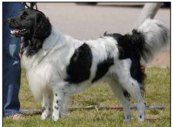
För lång rygg