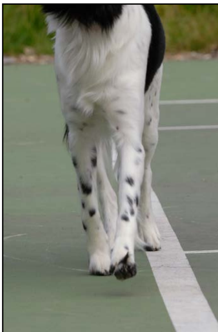
För smal front i rörelse