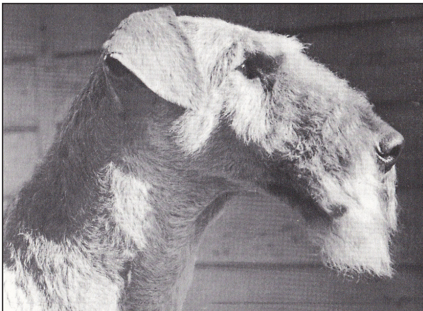
Vackert huvud med utmärkt profil och proportioner.

Från alla håll sett önskar man att huvudets form skall påminna om en tegelstens form. Det är också viktigt att skallens överplan ("hjässan" i standarden) har en flat yta och att hjässans plan och nospartiets plan sedda från sidan är så parallella som möjligt. En mycket bruten profil, s.k. down face, ser direkt fult ut. Det är också önskvärt med en väl utfylld underkäke, inte för smal.