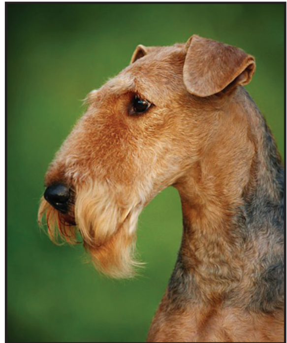
Tik med utmärkt huvud och uttryck.