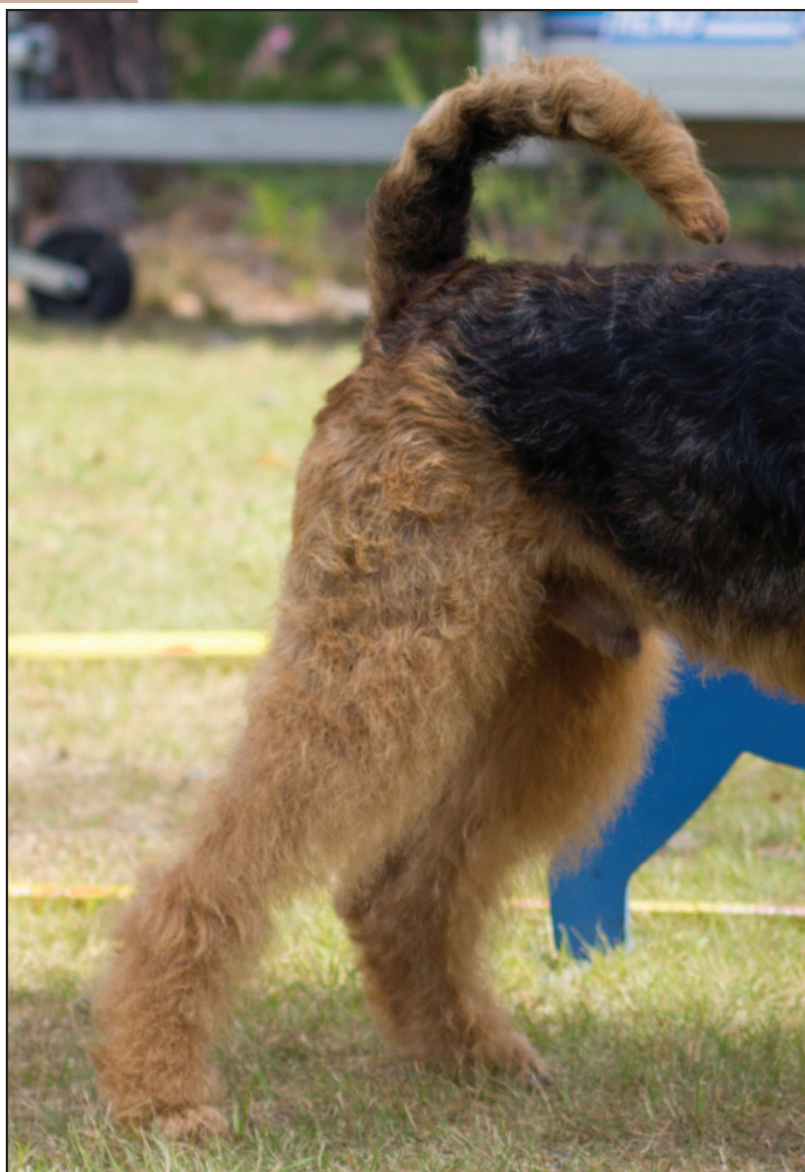
En okuperad svans bärs sällan bättre än detta.

Någon egentlig diskussion om hur okuperade svansar på airedaleterrier skall se ut har knappast förekommit. Vi har sedan förbudet mot svanskupering infördes sett och fått alla sorters svansar. Klart är att en lång, helt rättuppstående svans totalt spolierar balansen på en airedaleterrier. Den måste böja sig över ryggen, men hur mycket? I rasklubben anser vi att vi i vår numerärt sårbara ras inte kan se alltför allvarligt på hur mycket en svans böjer sig. Det viktiga är att den är högt ansatt och att det finns mycket "bakom svansen". Önskemålet är att svansen har tillräcklig höjd för att ge överlinjen ett bra avslut, innan svansen börjar böja sig.