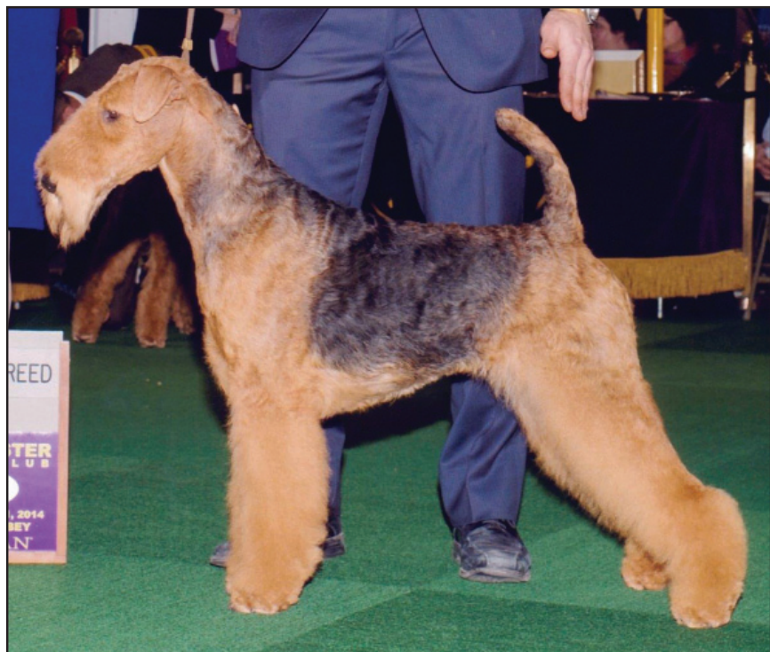
Tik av utmärkt typ.