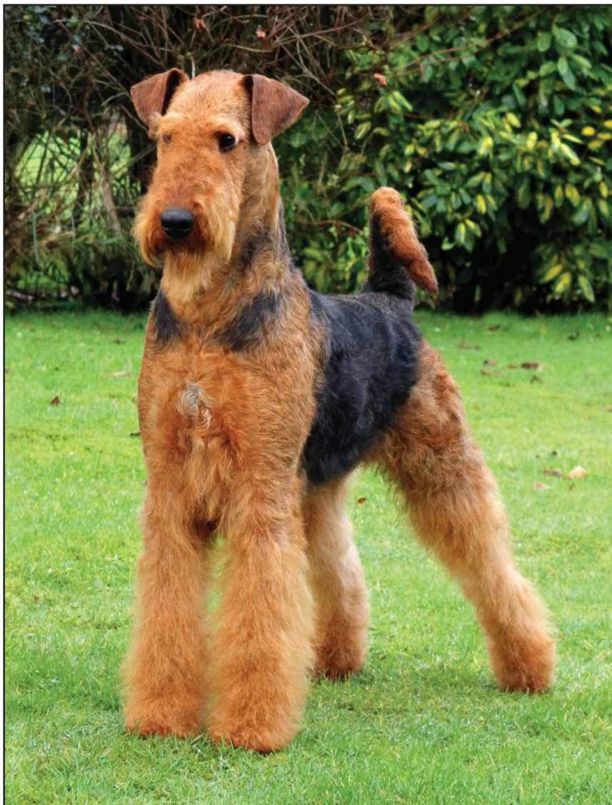
Samma hund som 5 mån.valpen till höger, i vuxen ålder. Denna hund har dessutom ett mycket vackert huvud och uttryck med utmärkta ögon och öron.

Den svarta sadeln och den varmt rödbruna färgen på resten av en airedaleterrier är oerhört attraktivt. Men registret är vidare. Tan-färg, vilket betyder en gul-brun läderfärg, ger utrymme för en rad nyanser. På samma sätt kan sadeln vara ganska melerad svart och grå och ofta med inslag av rödbrunt. Glädjande nog fäster nästan alla domare mer avseende vid att en airedaleterrier är väl konstruerad än vid vad den har för färg. Rätt kvalitet och struktur på pälsen är också viktigare än färgen. Många valpar har en vit bröststrimma som oftast växer bort, men en liten fläck är alltså tillåtet och skall inte påverka bedömningen.