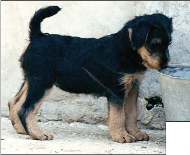
Päls och färg. Valp 7 veckor.