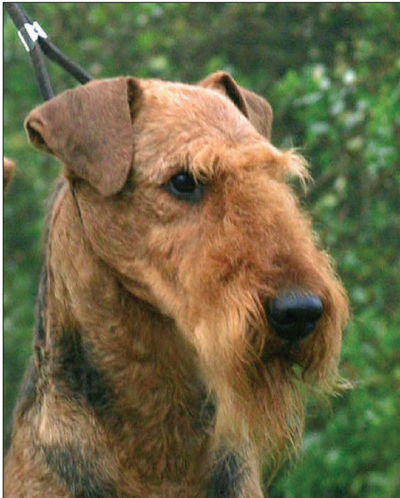
Hane med utmärkt huvud och uttryck.

En reslig hals med en stolt knyck på nacken är utomordentligt vackert på en airedaletterier, men det vill till att den också har en någorlunda väl tillbakalagd skuldra så att det inte blir en ful hjorthals. För lång hals är en sällsynthet. För mycket halsskinn är naturligtvis fult.