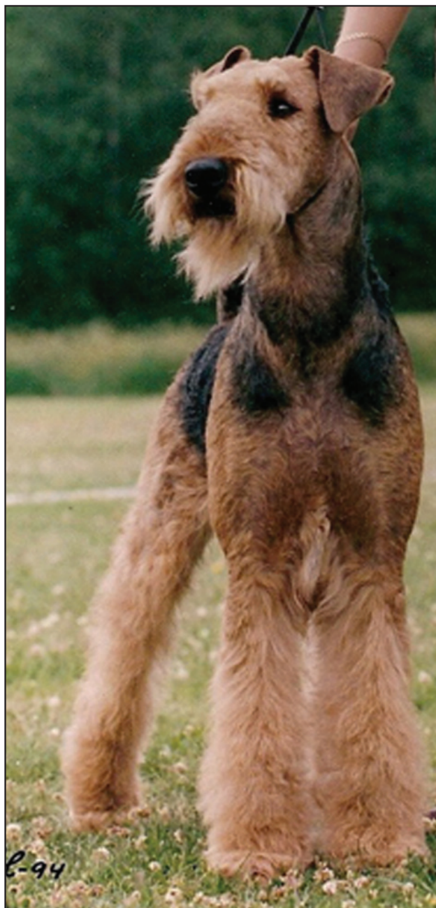
Förutom en utmärkt front har denna hund också ett utmärkt uttryck, utmärkta ögon och öron.

Sett rakt framifrån skall airedaleterriern stå med helt parallella framben som inte vrider ut eller in någonstans. Bakbenen skall bakifrån sett också de vara parallella men bredare isär. Ett något brett bakställ är långt att föredra framför ett smalt och trångt där hasspetsarna nästan skaver mot varandra när hunden travar.