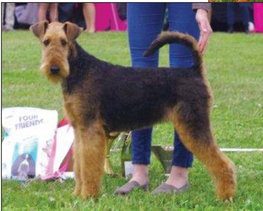
Päls och färg. 7 månader.