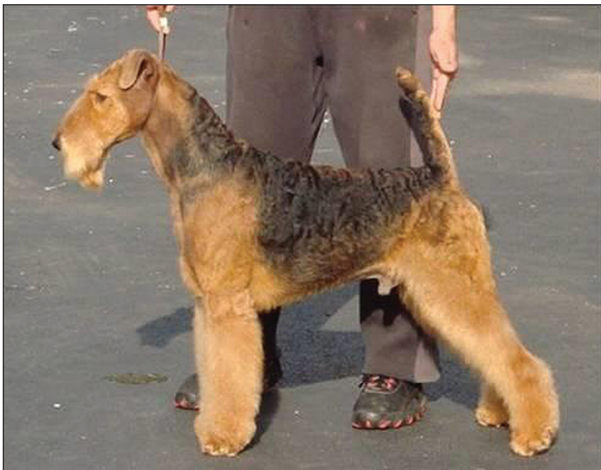
Hane av utmärkt typ.

Spänst, kraft, elegans, energiska rörelser - en beskrivning av det allmänna intrycket en bra airedaleterrier bör ge. Utöka den sedan gärna med önskemålet om en blandning av iver och överlägsen, rentav högdragen mildhet. Könsprägel skall vara tydlig.