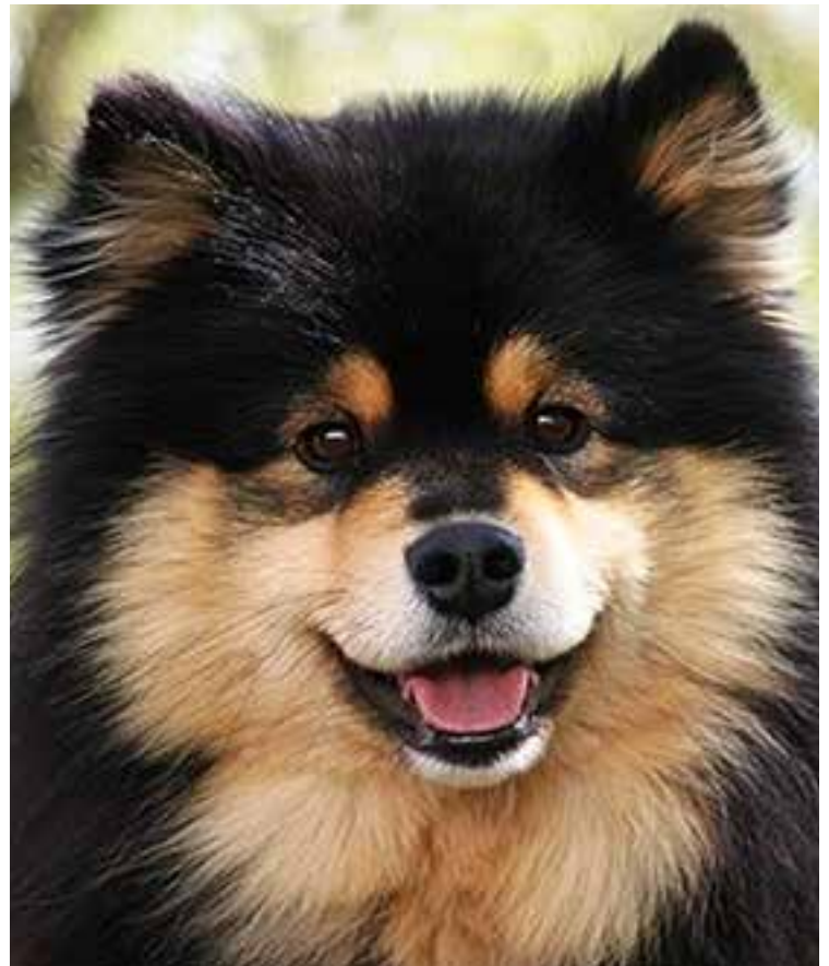
Tik och hane med välformade huvuden med bra form och utfyllnad av nos samt det korrekta vänliga uttrycket. Bra pigmentering och ögonfärg i harmoni till deras färg.