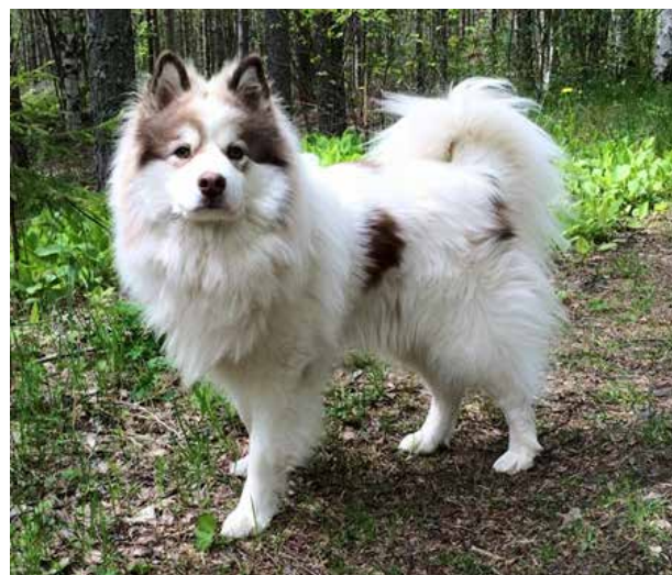
Vit med fläckar ( vitt dominerar)