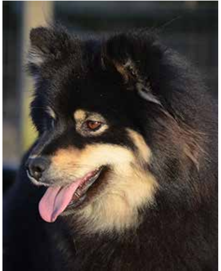
Tik med välformat huvud, vänligt uttryck och välformade väl behårade öron av bra storlek.