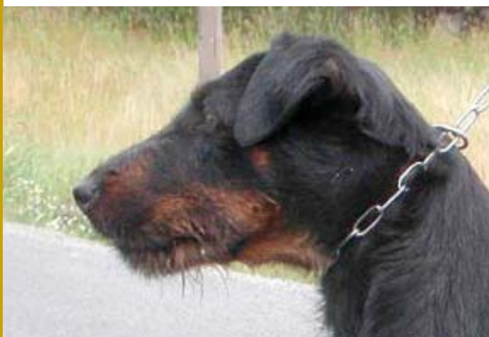
Maskulin hane. Utmärkt huvud i alla detaljer. Lägg speciellt märke till den flata skallen och det svagt markerade stopet. Mörkt tecknad. Fullt tillräcklig mängd tanfärg.