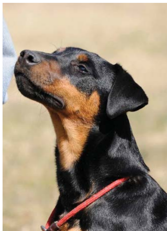
Utmärkt tikhuvud. Feminin tik, släthårig, utmärkta ögon och öron, aningen djupt stop, utmärkt haka och nosparti, färg och teckning.