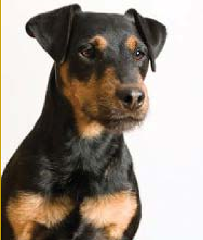
Utmärkt typ. Maskulin hane, aningen ljus nostryffel, aningen breda kinder, f ö ett utmärkt huvud med utmärkt uttryck.