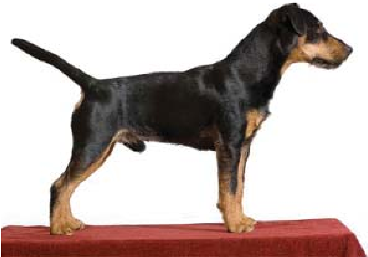
Maskulin hane av utmärkt typ med utmärkta proportioner. Något djupt stop, kunde ha flatare hjässa. Utmärkt svans. Välvinklad bak, kunde vara bättre vinklad fram.