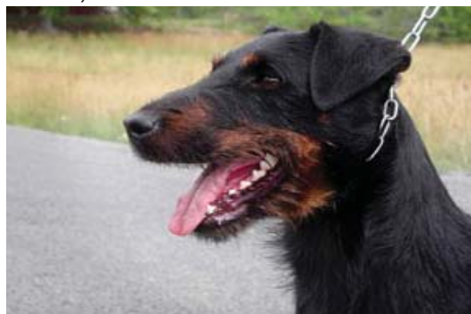
Maskulin hane. Utmärkt huvud med synnerligen bra käkparti, utmärkta öron, utmärkta ögon med intensiv blick.