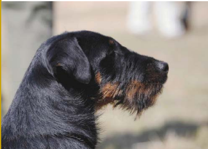
Utmärkt strävårig päls. Typiskt maskulint huvud med utmärkta detaljer och proportioner.