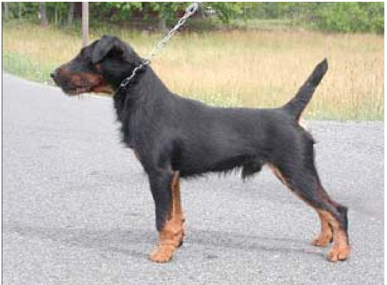
Maskulin hane av utmärkt typ. Välkonstruerad allt igenom. Utmärkt stark kropp. Utmärkt pälskvalitet.