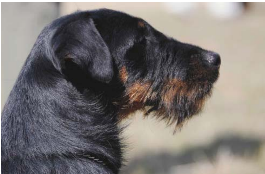
Utmärkt strävhaarig päls.

I den tyska versionen av standarden står det att färgen "är" inte "skall" vara svart osv. Färg och teckning är av underordnad betydelse. För mycket vitt bör dock alltid medföra sänkt kvalitetspris. För mycket = iögonfallande.