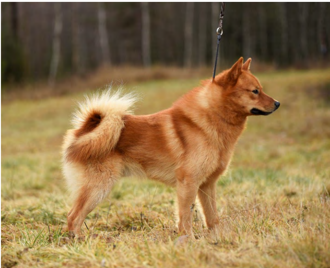
Ovan, en hane av utmärkt typ