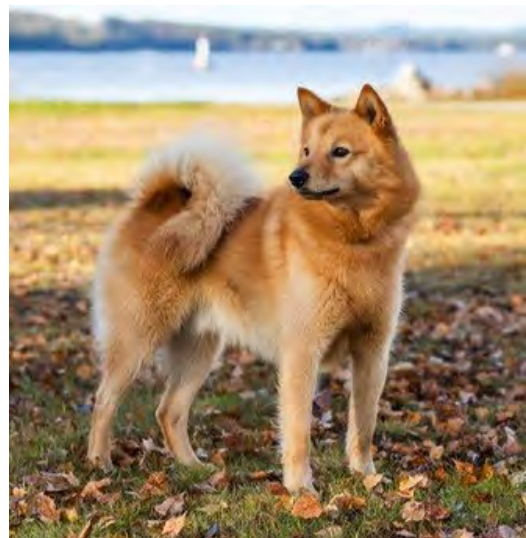
Hanar av utmärkt typ