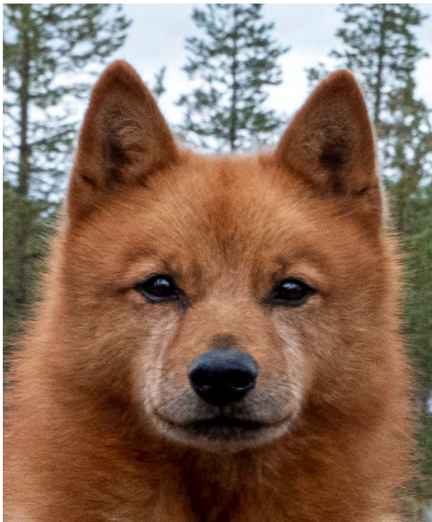
Utmärkt hanhundshuvud (äldre hane)