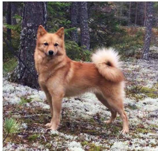
Tikar av utmärkt typ