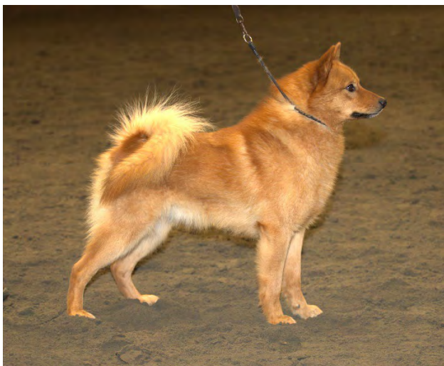
Hane av utmärkt typ

Hos hanhundar måste båda testiklarna vara fullt utvecklade och normalt belägna i pungen.