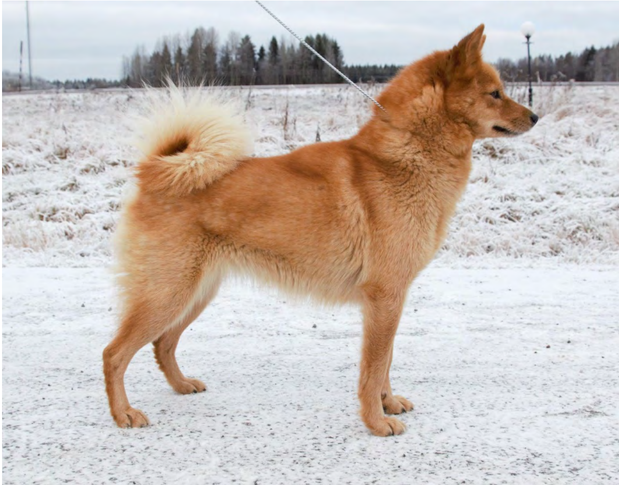
Tik av utmärkt typ

Den finska spetsen är en kvadratisk och stramt byggd spetshund. Den får aldrig vara tung. De skillnader i kroppsbyggnaden som betingas av könen skall vara tydliga.