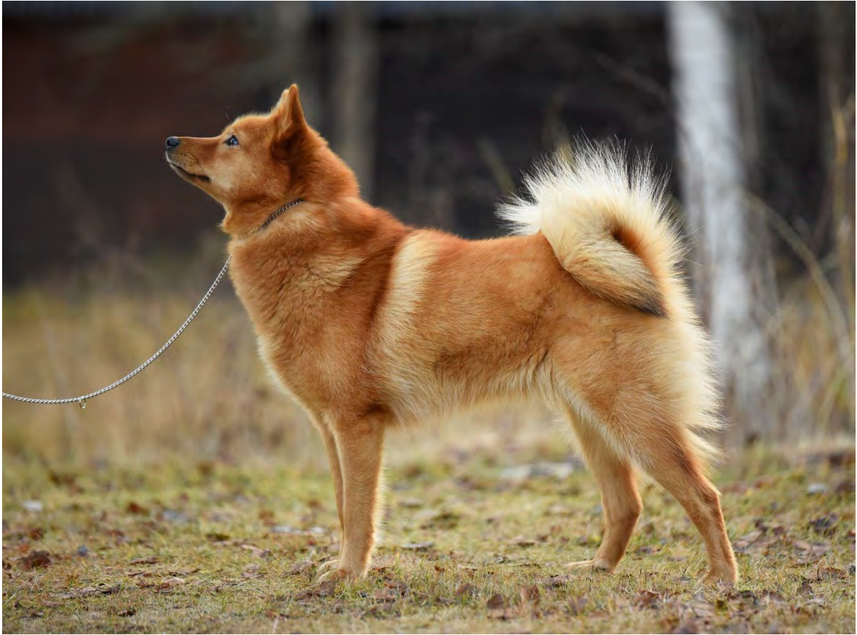
Två tikar av utmärkt typ