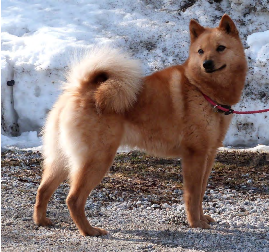
Ovan, en tik av utmärkt typ