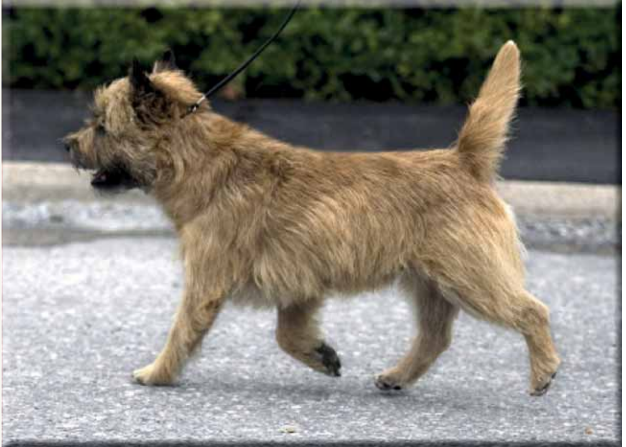
Korrekt, vägvinnande, fria och parallella rörelser.