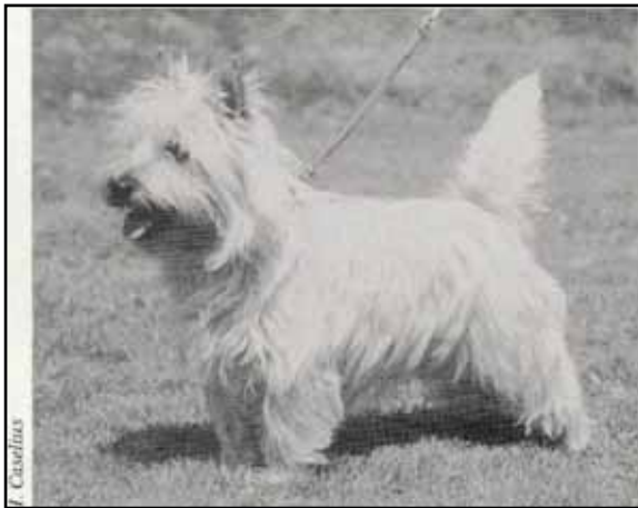
Ch Avenelhouse Golden Oriole 1973