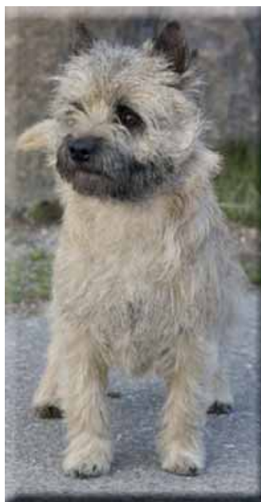
Korrekt front med tillåtet, lätt utåtvidna tassar, lika på båda benen.