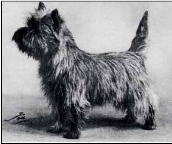
Ch Oudenarde Queen of Light 1952