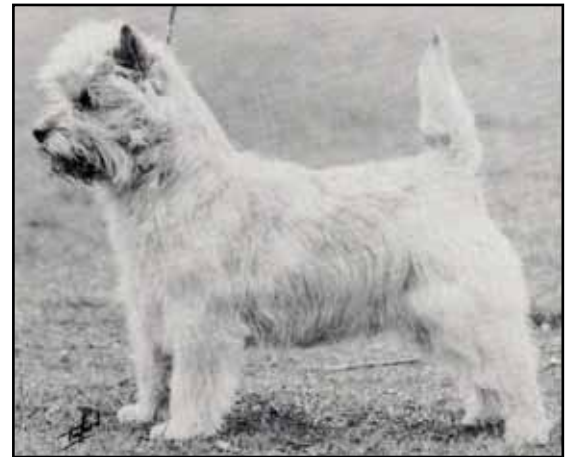
Ch Beaudesert Royal Viking 1988