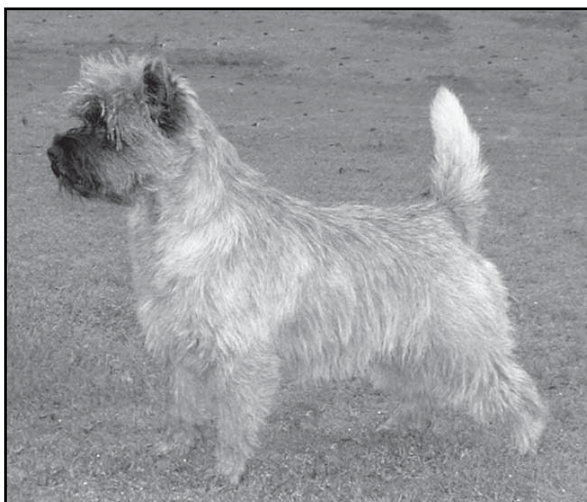
Ch Birselow Billy Fury 2001