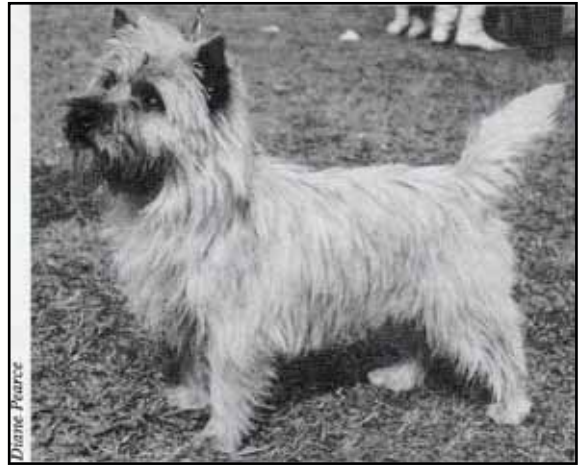
Ch Blencathra Brat 1968