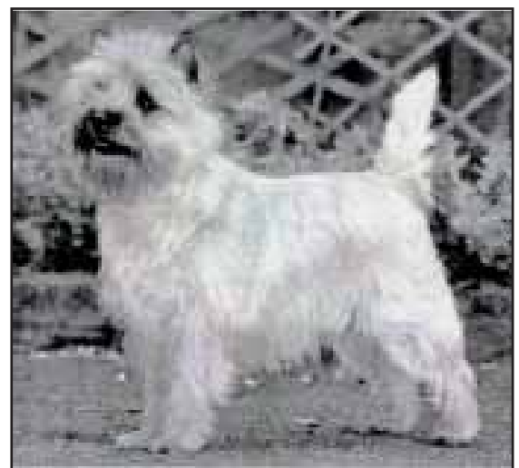
Ch Cloverbrook Cream O'The Crop 2012