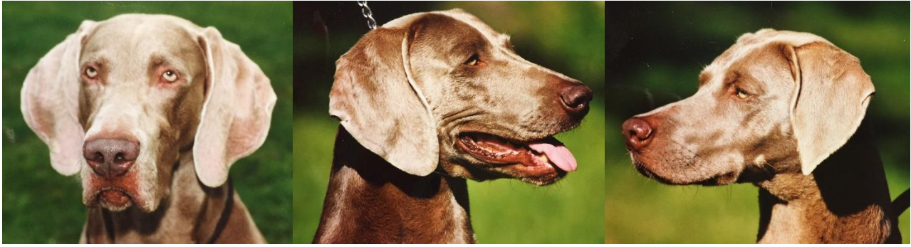
Tungt och löst huvud