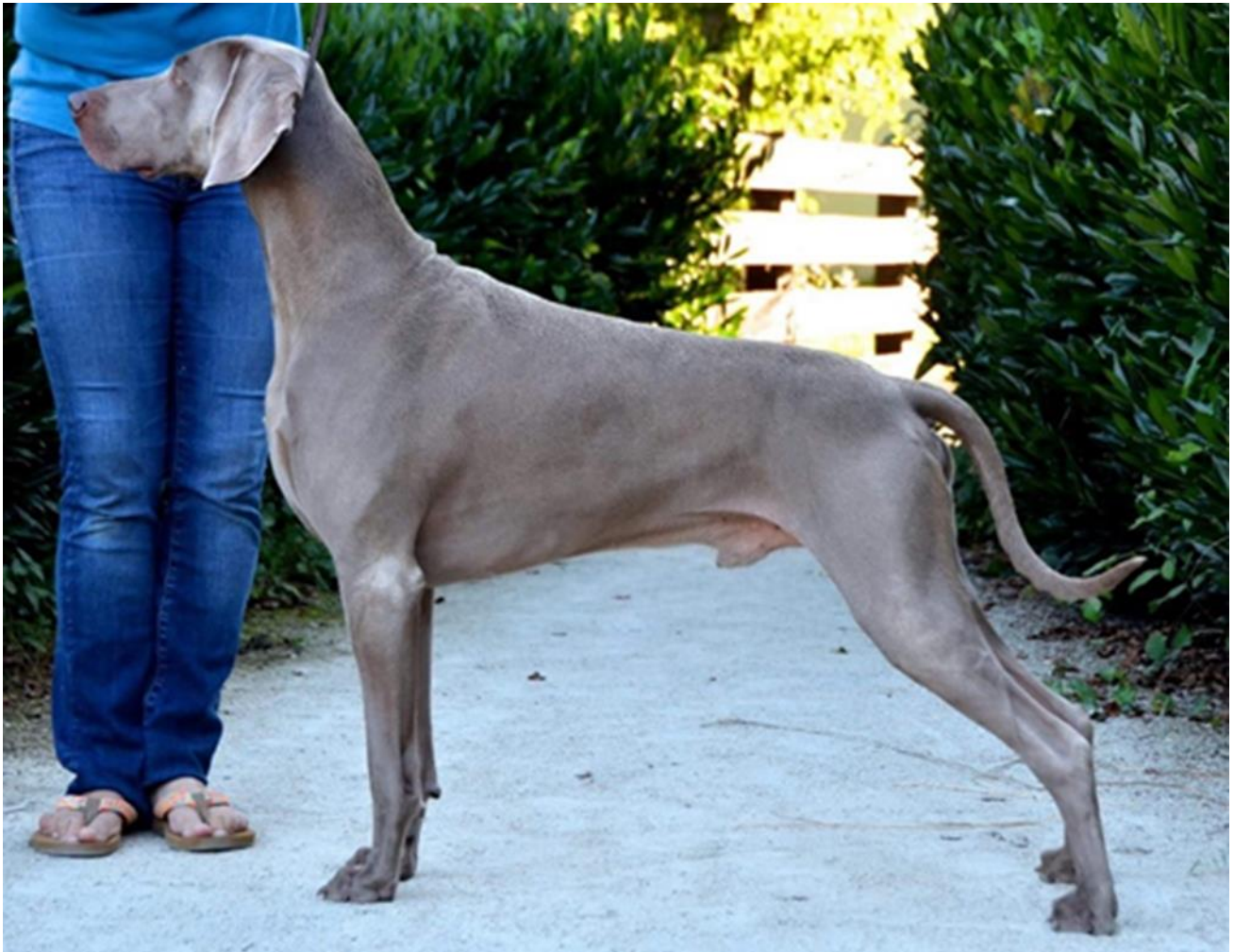
Hane av utmärkt typ.