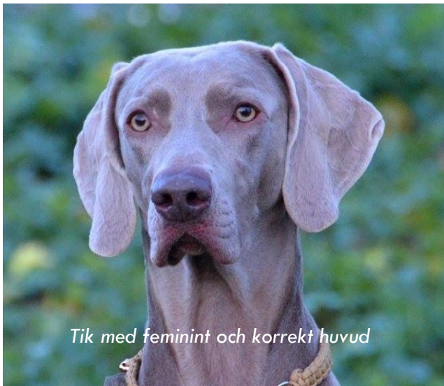
Tik med feminint och korrekt huvud