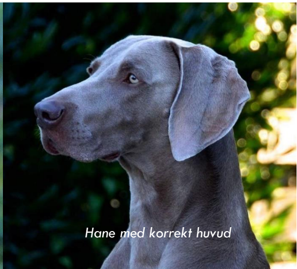
Hane med korrekt huvud