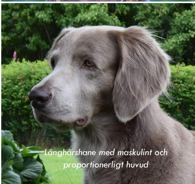
Långhårshane med maskulint och proportionerligt huvud