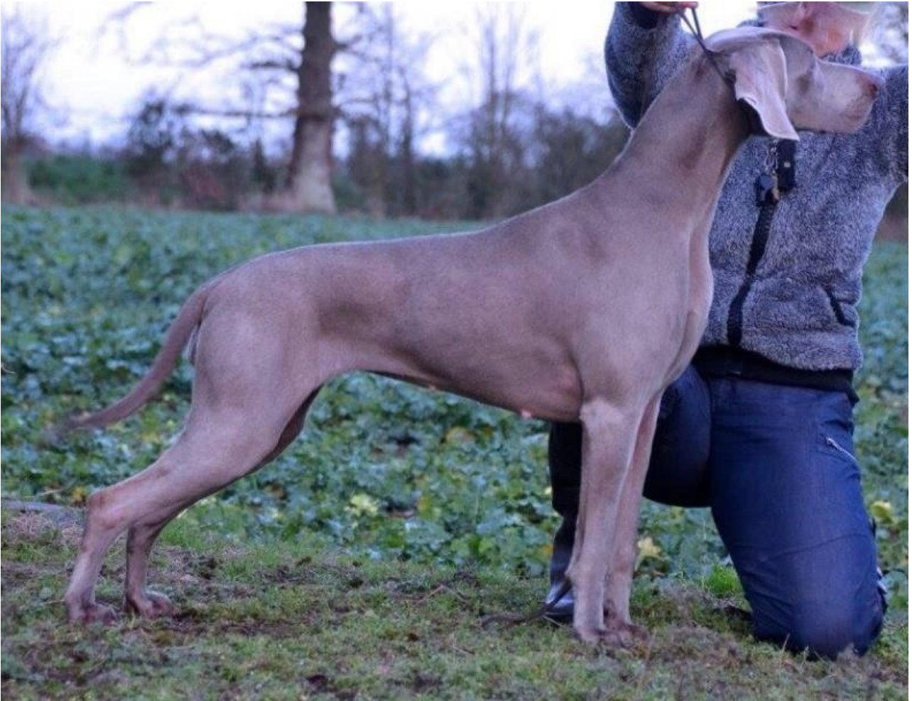
Tik av utmärkt typ och proportioner.