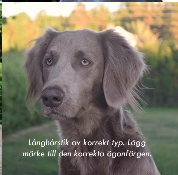
Långhårstik av korrekt typ. Lägga märke till den korrekta ögonfärgen.