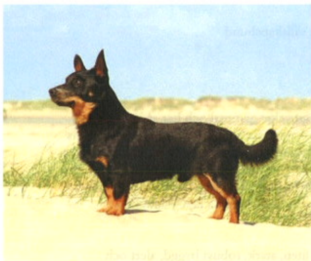
Tre championhanar av utmärkt typ