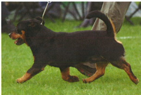
Tre hanar med utmärkta rörelser

Rörelser: Rörelserna skall vara snabba, livliga, naturliga och fria.