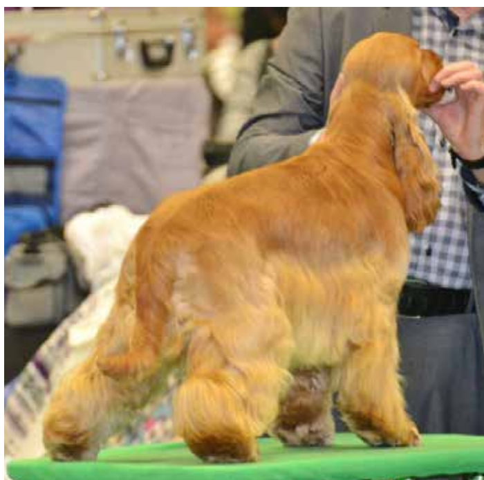
Hane med korrekt brett bakparti, välvinklad och med låga hasor.

Bakstället skall vara starkt, välmusklat med goda vinklar. Bredd över korset med goda breda lår är ett måste för rasen och för att uppnå de rastypiska rörelserna. Korrekt knäledsvinkel och korrekt längd på underbenet ger cockern ett sunt och balanserat intryck. Hasorna skall vara låga för att kunna ge det rätta påskjutet och det skall vara god bredd mellan hasorna utan att hunden får vara hjulbent.