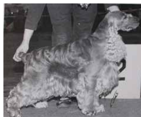
NOCH SV-89 Leavenworth It's A Pleasure, betydelsefull hane i aveln under -80, -90-talet.

Även om rasens registreringsciffror gått ned har den behållit sin ställning som