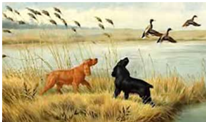
Målning av Boris Riab

FCI-KLASSIFIKATION: Grupp 8, sektion 2. Med arbetsprov