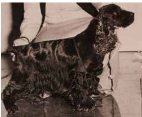
SH CH NUCH Lochranza Man of Fashion hade en karriär både i England och i Norden.

Rasen fick snabbt många hängivna uppfödare. Hundarna fungerade både som jakt- och utställningshundar, och det var länge ett krav på jaktprovsmärkning för championat. År 1931 var hela 1006 cockrar anmälda till Crufts. Vinnare blev den blue roan tiken Luckystar of Ware. Of Ware-kenneln, ägd av H S Loyd, hade stora framgångar på Crufts med flera Best in Show och hade även stort