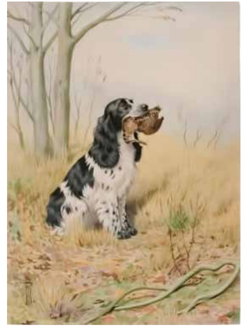
Målning av Boris Riab