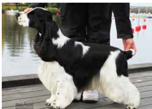
Svart och vit hane