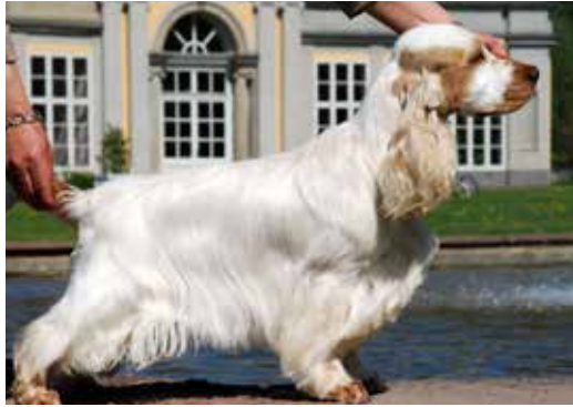
Orange roan tik