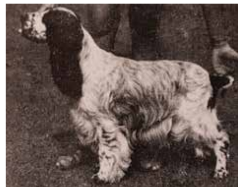
SH CH Bournehouse Starshine, är rasens rekordhållare i England.

1902 bildades The Cocker Spaniel Club. Då fick rasen en ny standard som varit i stort sett oförändrad fram till vår tid.