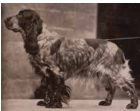
CH Tracey Witch of Ware 1935.

1885 grundades "The Spaniel Club". Arbetet med att förädla de olika spanielraserna började och det fanns en stor önskan att skilja på viktgränserna för field och cocker spaniel. Det skedde så sent som 1901.