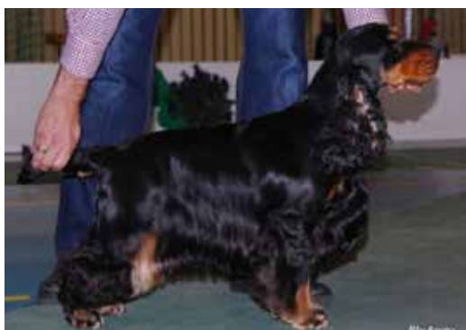
Svart med fantecken hane