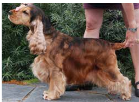
Sobel hane (inte längre önskvärd färg)

Sobel, såväl i enfärgad som brokig variant, finns inte längre med i standarden och är en icke önskvärd färg. En sobelfärgad cocker har tvåfärgade hårstrån, där hårtopparna är svarta eller bruna med röd/ljus botten.