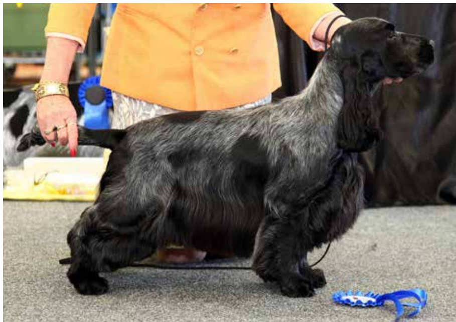
Hane med korrekt slät, inte för riklig, silkesaktig päls och tydliga fanor.

Under sin uppväxttid har en cocker varierande mängd av valppäls, från något ullig till massor av valpull. Mängden valppäls är inte alltid direkt korrelerad till mängden vuxenpäls. Många valpar/unga hundar släpper inte sin valppäls förrän i 9-10 månadersåldern. Man skall inte negativt bedöma valpar och juniorer med mycket valppäls.