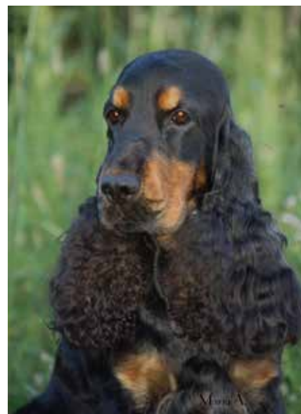
Svart hane med fantecken