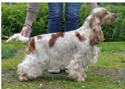
Orange roan tik