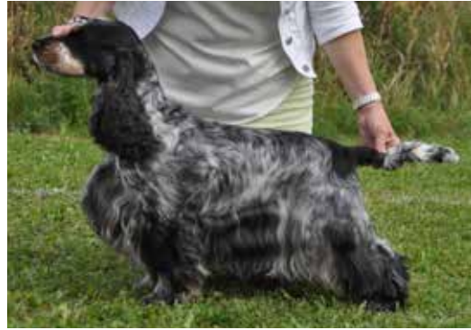
Blue roan och tan tik