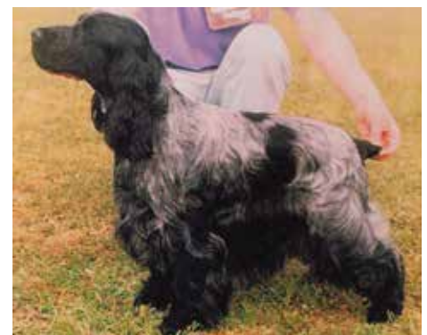
SH CH Bitcon Troubadour, mycket dominant avelshane som gett vinnande avkomor över hela världen.

Det har alltid funnits många hängivna uppfödare i Storbritannien och rasen håller hög standard i sitt hemland. Cockrar exporteras från Storbritannien till alla världens hörn, och engelska importörer har även haft ett stort inflytande på aveln i Norden.