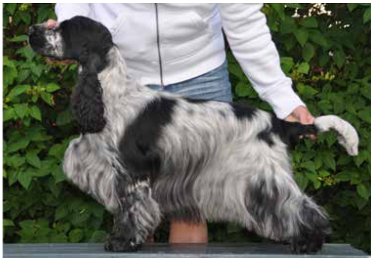
Hane med vacker siluett och korrekt halsansättning.

En vacker halslinje med en väl tillbakalagd skuldra spelar stor roll för hur en cockers helhet uppfattas. Halsen skall enligt standarden vara medellång och skall passa till hundens övriga proportioner. En för lång hals gör att en cocker ser obalanserad ut medan en för kort hals skämmer silhouetten ordentligt, och kan ofta kopplas ihop med en rak eller framskjuten skuldra. En väl tillbakalagd skuldra ger vanligtvis en mycket vacker övergång mellan hals och rygg och förstärker de mjuka linjer som en cocker skall ha.