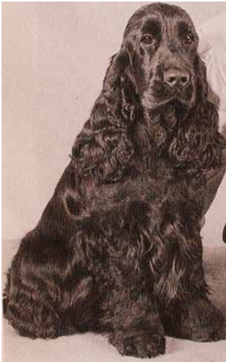
SH CH Asquannes Gonzales, inflytelserik avelshane.

Rasen fick snabbt många hängivna uppfödare. Hundarna fungerade både som jakt- och utställningshundar, och det var länge ett krav på jaktprovsmärkning för championat. År 1931 var hela 1006 cockrar anmälda till Crufts. Vinnare blev den blue roan tiken Luckystar of Ware. Of Ware-kenneln, ägd av H S Loyd, hade stora framgångar på Crufts med flera Best in Show och hade även stort