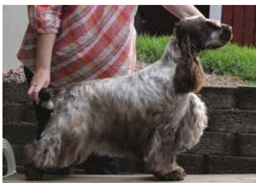
Brun roan hane