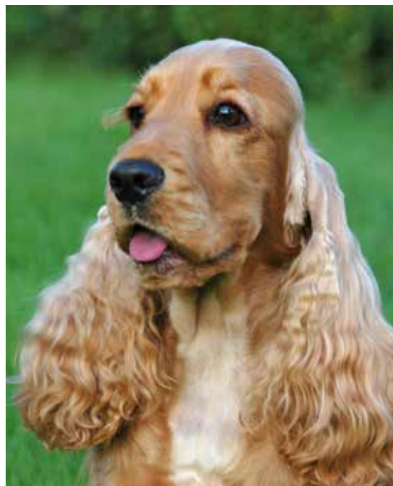
Tikar med vackra mörka ögon med mildt och vaket uttryck samt åtliggande ögonkanter.