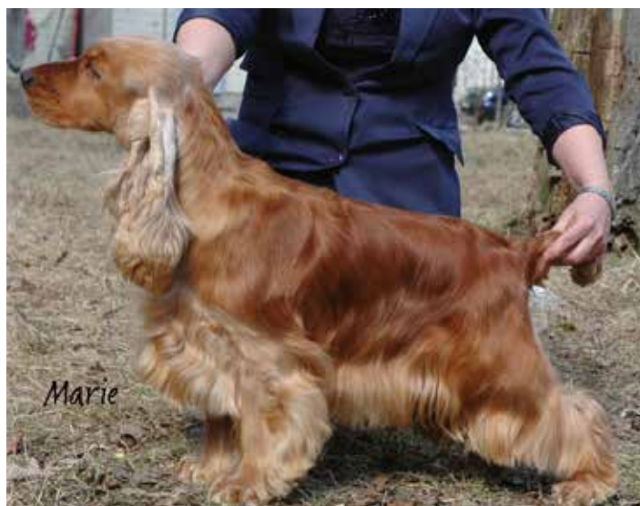
Hane och tik med starka och kompakta kroppar.