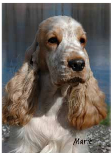
Orange roan fik