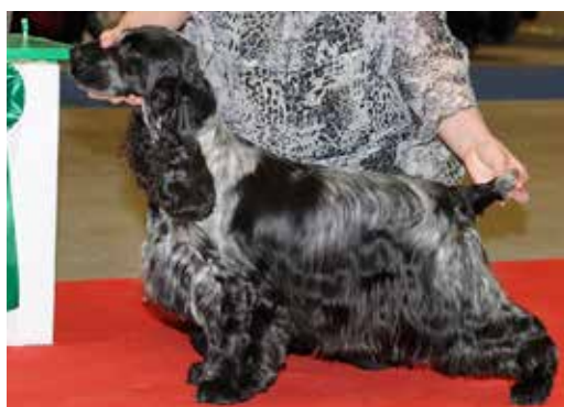
Blue roan fik