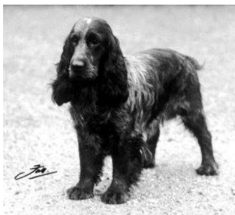
GB SH CH Luckystar Of Ware, won the title of Best In Show at Cruft's in both 1930 and 1931. He was the first dog to retain the title.