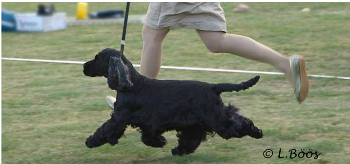
Hane med fria rörelser och kraftigt påskjut.

Idag ses hundar som springer alldeles för fort där hastigheten premieras före funktionaliteten. Som tidigare nämnts har cockern ofta bättre vinklar bak än fram, vilket kan göra att den blir obalanserad och kan ha frambensrörelser som blir höga, svävande, nystande eller trippiga. Detta kompenseras ofta med ett för uppdrivet tempo i utställningsringen. Man får inte missta sig på ett snabbt tempo och ett rastypiskt vägvinnande rörelseschema.