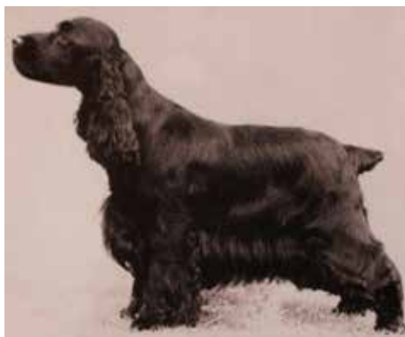
SH CH Charbonnel Fair Cher f-88.

Kvaliteten på hundarna var mycket varierad men importer från Canada och Amerika förbättrade kvaliteten. Rasen nådde sin höjdpunkt 1947 då hela 27 000 cockrar blev registrerade i England, vilket är den högsta registreringsciffran av en ras någonsin fram till då. 1958 infördes titeln SH CH och intresset för att starta på jaktprov minskade. Detta ledde sedan fram till att rasen blev uppdelad i en jaktvariant (working eller field trial cocker) och en utställningsvariant.