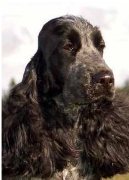
Blue roan hane