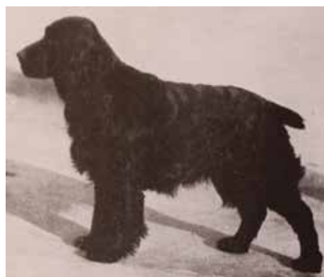
Otto of Ware 1928.