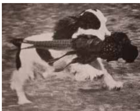
CH Colinwood Cowboy 1948.

På de första utställningarna ställdes alla spaniels i samma klass som field spaniels och blev indelade efter vikt. Ända fram till början av 1900-talet var det vanligt att man använde flera namn såsom cocker, clumber, field och springer spaniel. Stora spaniels blev på den tiden registrerade som springer, små som field spaniel och de små, som vägde under 11,5 kg blev registrerade som cocker spaniel. Detta medförde att valpar från en och samma kull kunde bli registrerade som olika raser, efter storlek och vikt.