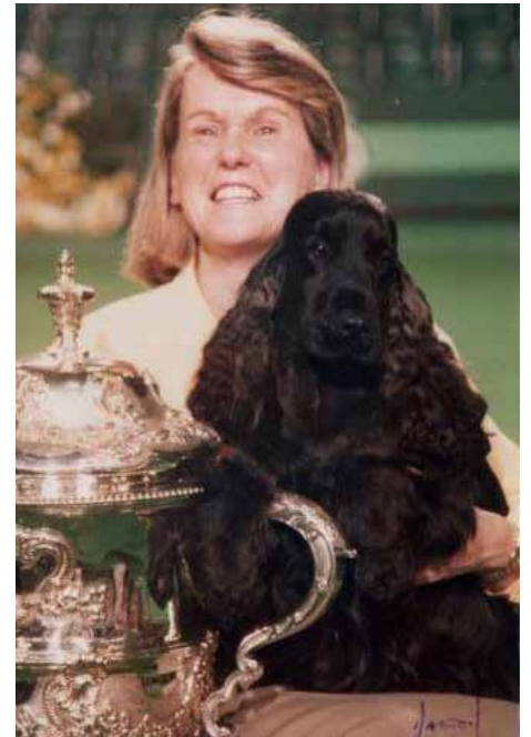
SH CH Canigou Cambrai var BIS på Crufts 1997.

extremt populär familje-, jakt- och utställningshund i sitt hemland, och den årliga specialutställningen samlar vanligtvis flera hundra cockrar.