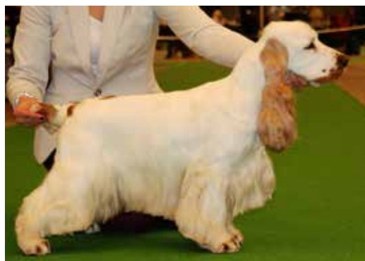
Röd och vit hane