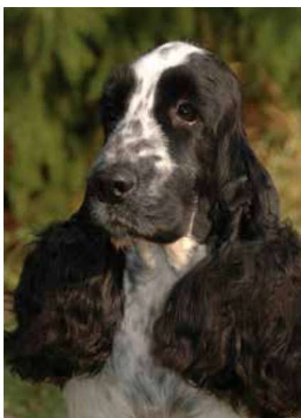
Svart och vit fik