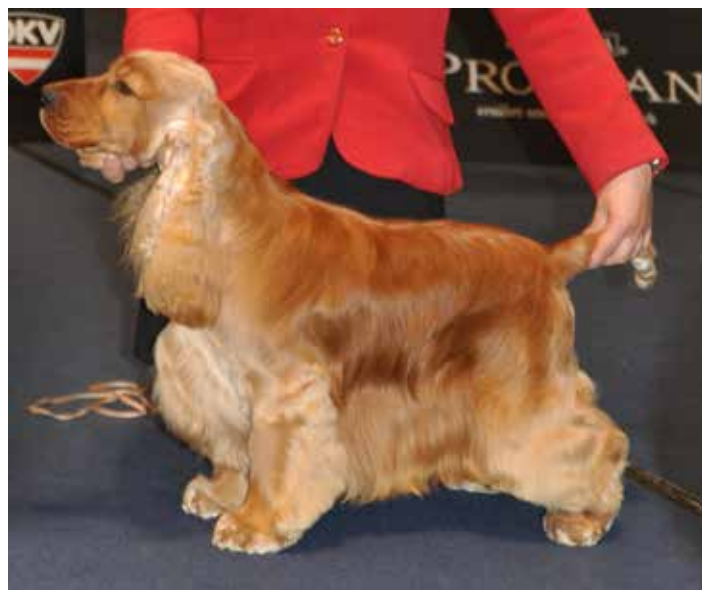
Hane med utmärkt benstomme, raka fina framben och kattlika fasta tassar.

Typiska cockertassar är väl rundade, fasta och väl slutna. De kan liknas vid en kattfassa och får aldrig vara platta, flata eller spretiga.