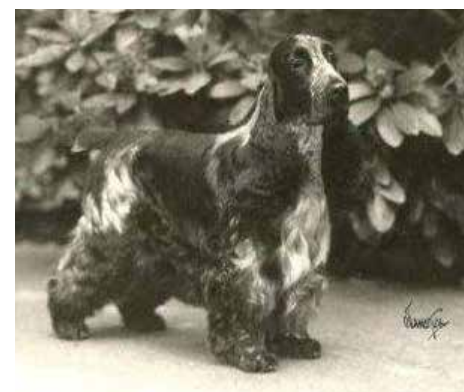
Ch. Kenobo Rabbit Of Nadou.

Från början var de flesta cockrarna enfärgade. Leverfärgade var ganska vanliga, men även svarta och svarta med tan-tecken. Brokiga cockrar var mer ovanligt. Röda cockrar var till en början ganska ovanliga, men runt 1930 ökade intresset för färgen och The Golden Cocker Spaniel Club grundades.