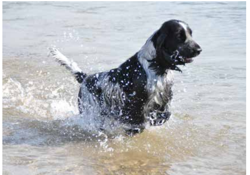
Cocker spaniel är en glad, aktiv och robust hund.

Cocker spaniel erkändes som en ras skild från field spaniel och springer spaniel kort efter att den engelska kennelklubben (the Kennel Club) bildades 1873. Rasen kallades ursprungligen för "cocking spaniel", ett namn som härör från att stöta morkulla (woodcock på engelska). Liksom inom ett flertal andra fågelhundsraser finns numera hos cocker spaniel en skillnad mellan hundar som används till jakt och hundar som används till utställning: utställningstypen är kraftigare och tyngre än jakttypen.