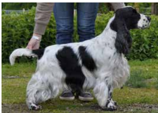
Svart och vit hane med ticking