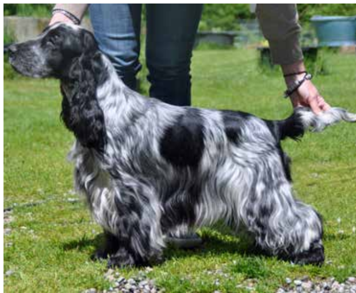
Korrekta svansar ansatta något under rygglinjen.