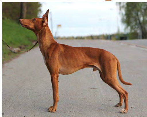
Tikar av excellent typ