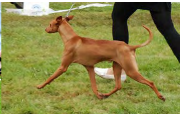
Hundar med typiska rörelser