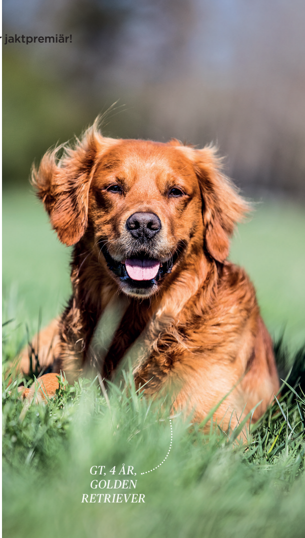
GT, 4 ÅR, GOLDEN RETRIEVER