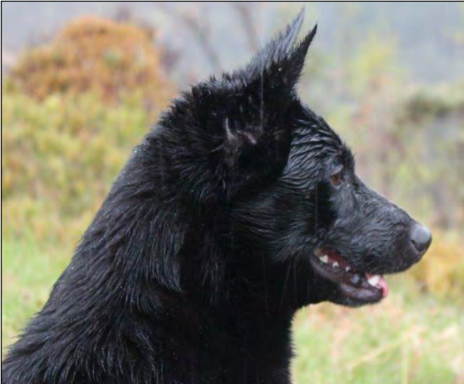
Utmärkt tikhuvud i sina proportioner, lämpligt stop, utmärkta ögon och öron, hals och nacke som ger god resning.