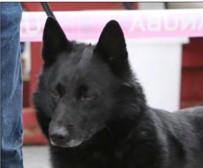
Utmärkt hanhundshuvud med bra proportioner i skalle och nos. Utmärkta ögon och öron ger fint uttryck.