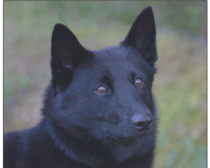
Utmärkt hanhundshuvud med tydlig könsprägel. Aningen stora öron.