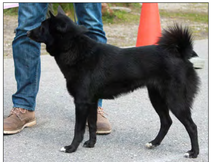
Good tik som inte får bli lättare och torrare i kroppen. Inte heller mera vitt på tassarna. Inte alltför bra överlinje och lågt ansatt svans.