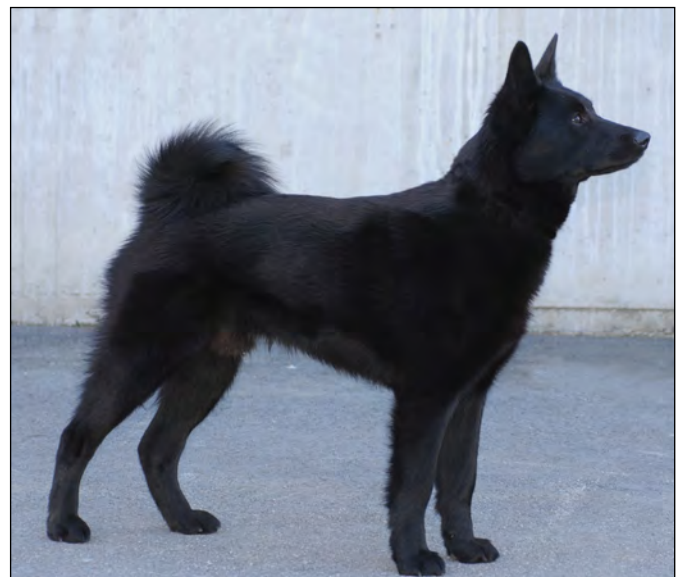
En tik och hane med utmärkt helhet.