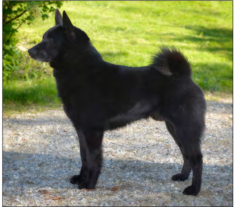
Hane med utmärkt helhet och uttryck.