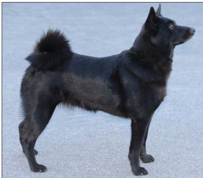
Excellent tik med utmärkt helhet.