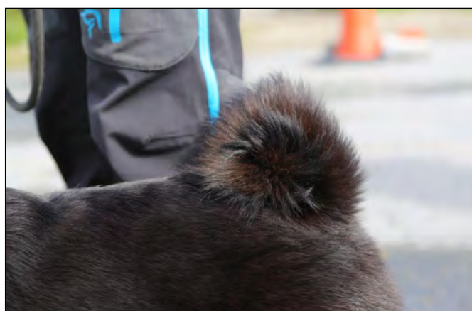
Korrekt buren svans.

T.h. Excellent hane med fint uttryck och god resning, stark överlinje, bra kors och svans. Utmärkta vinklar fram och bak. Markerat förbröst och bra längd i bröstbenet. Tillräckligt strama tassar.