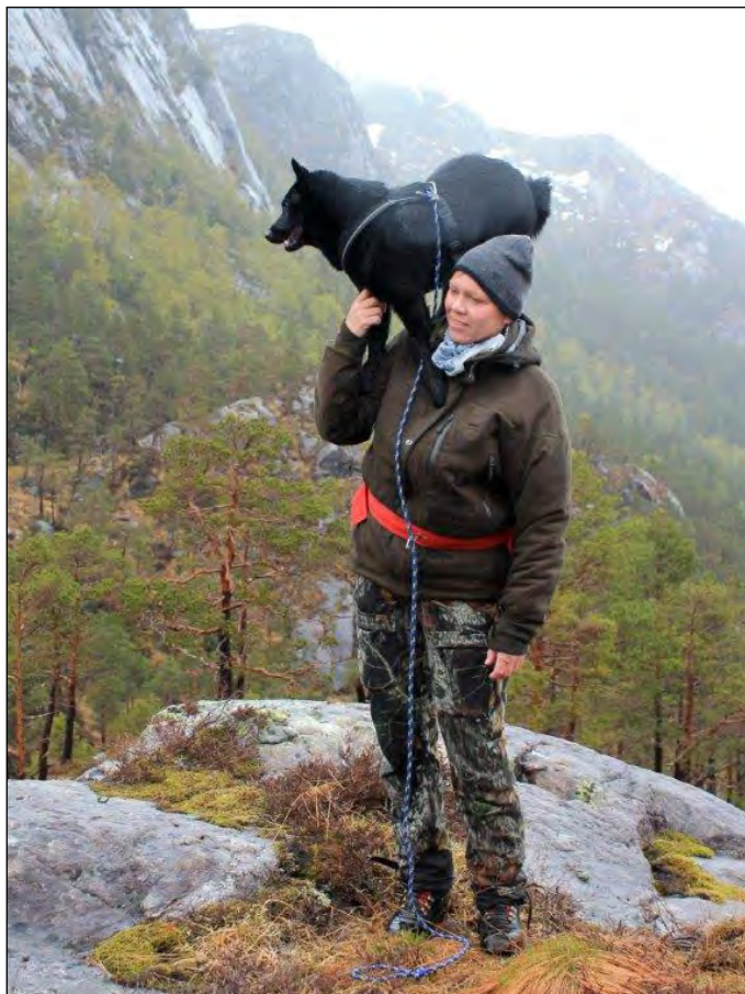
Norsk älghund svart används huvudsakligen som ledhund/bandhund på klövvilt.