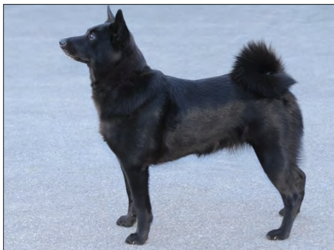
Tik med utmärkt helhet.