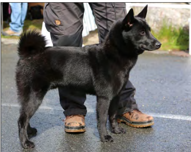
Excellent hane med lämpligt djup och välvning i bröst-korgen. Stark överlinje, och lämpligt uppdragen underlinje. Utmärkt svans.