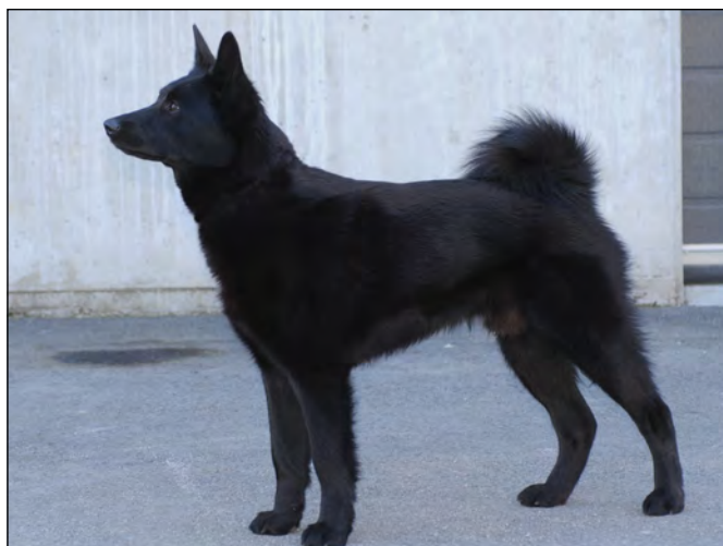
Hane med utmärkt helhet.