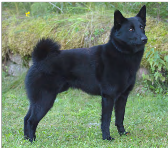
Excellent hane med utmärkta proportioner, utmärkt överlinje och svans. Utmärkta tassar.