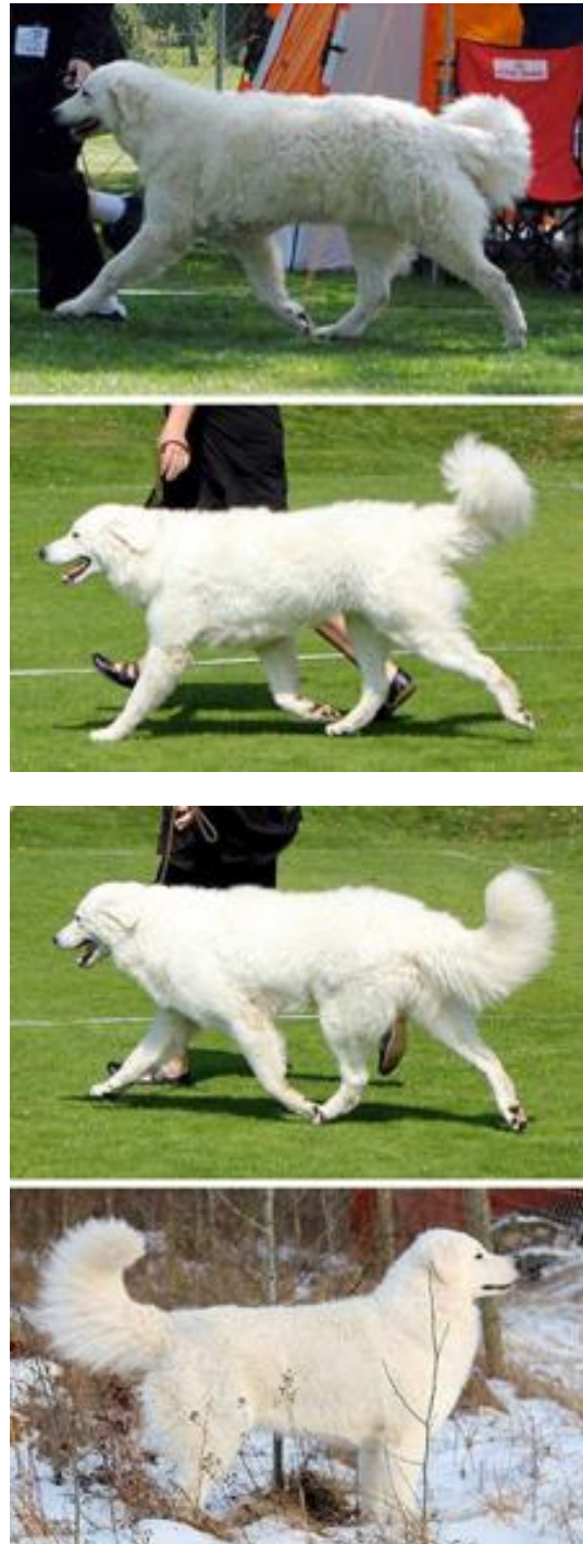
Den sista bilden visar en uppmärksam hund.