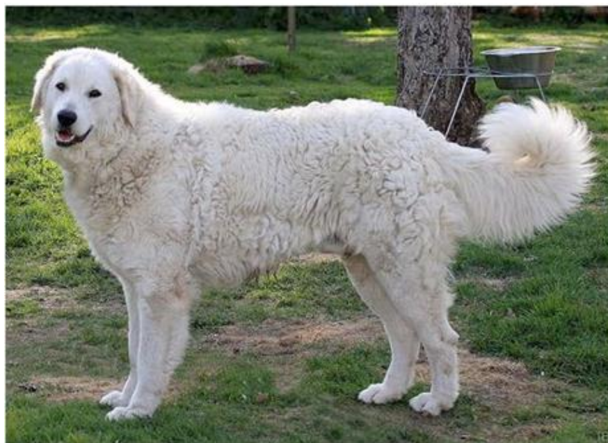
Goda exempel på pälsstruktur.