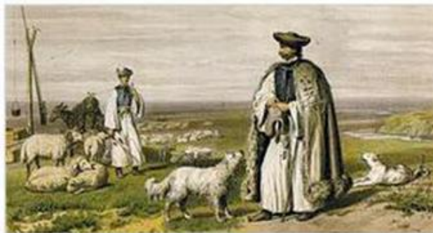
Prónav Gábor: Juhászok. 1855

Rasen är en urgammal ungersk herdehund. Dess förfäder kom med magyarerna till Karpater-bäckenet. Magyarerna använde hundarna till att bevaka och skydda djurhjordar mot rovdjur och tjuvar. Tack vare rasens jaktlust blev den använd till jakt under kung Mattias Corvinus tid (senare halvan av 1400-talet). Allt eftersom hjordarna blev färre blev rasens ursprungliga användning alltmer sällsynt och den blev i stället hemmahörande i byarna och senare till och med i städerna.