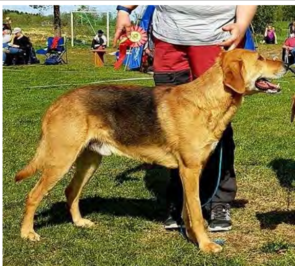
Kraftfull hane, huvudet får inte bli djupare.