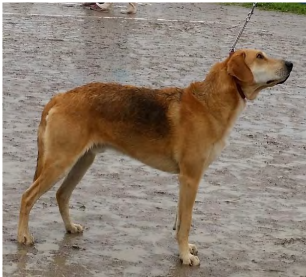
Välutvecklad kropp men lite avfallande kors och något tunn bestomme. Visar tydligt rasens temperament – vänligt och lugnt uttryck.