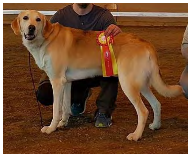
Kraftfull hane, utmärkt helhet.