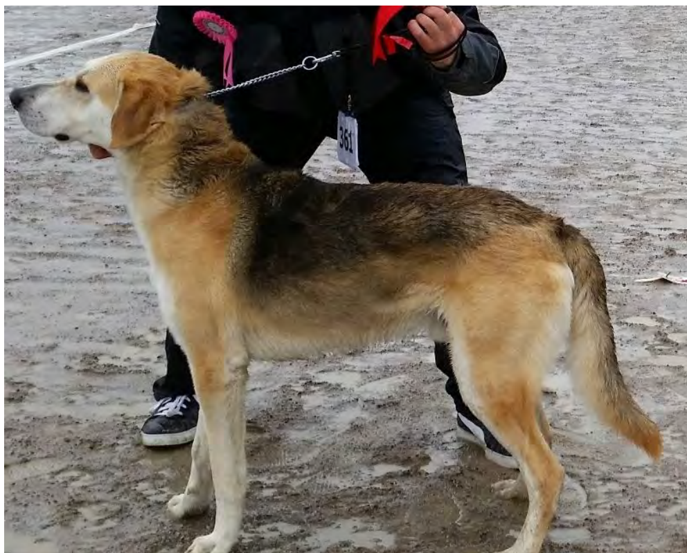
Hane av utmärkt typ, välkroppad, utmärkt rygglinje, bra ben och tassar. Moderat vinklad fram. Kunde ha mindre vitt på frambenen. Tät päls.