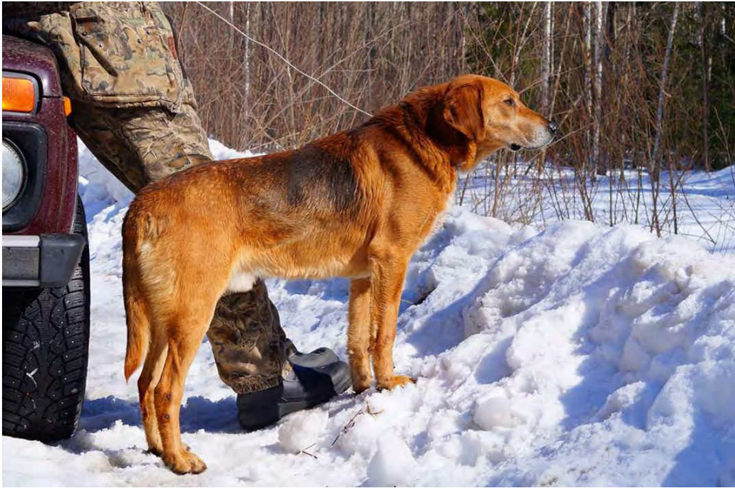
Stark, välbyggd och proportionerlig. Väl ansatt hals. Välvinklad fram, något öppen bak. Vackra färger, tät päls.