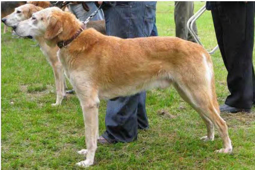
Proportionerlig hane som kunde ha lite kraftigare benstomme. Vackert huvud. Våltecknad i fina färger.