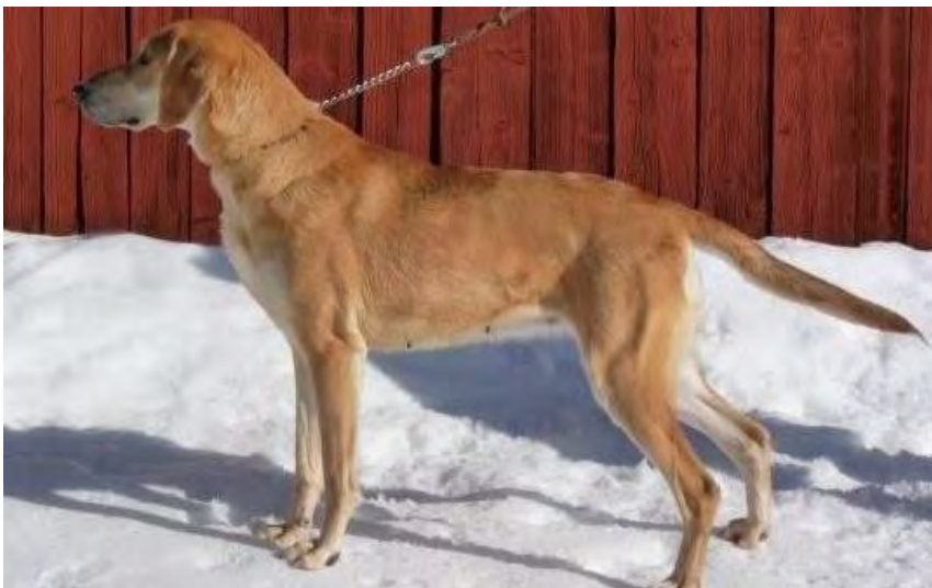
Tik med könspräglat välformat huvud, välkroppad, bra hals, stark rygg, bra kors, välvinklad och med utmärkt lårbredd. Bra päls och färg. Ser på bilden något kort ut.