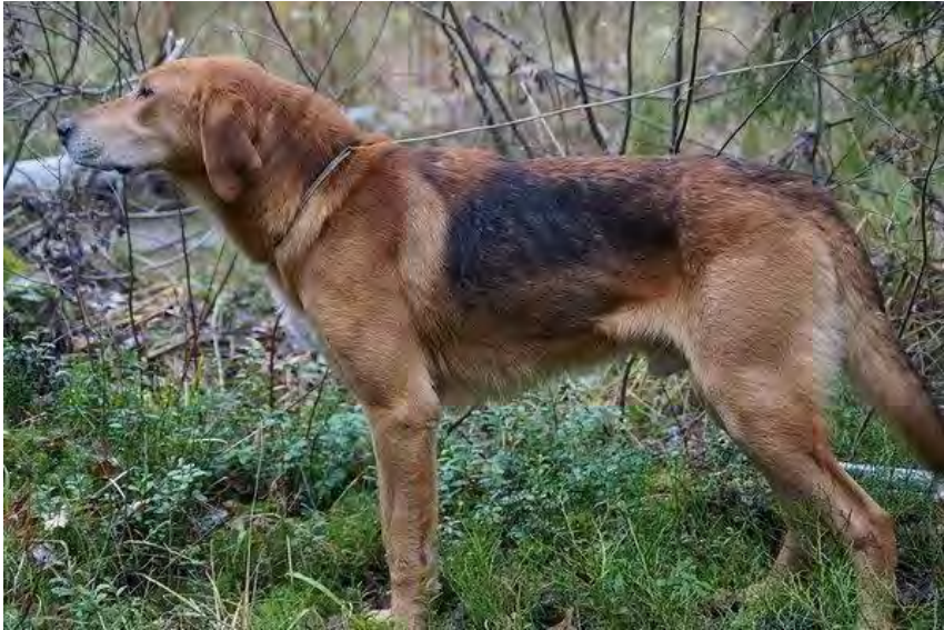
En till alla delar utmärkt hane.