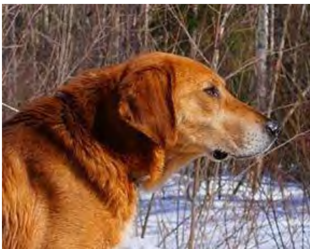
Välformat maskulint huvud med tydlig könsprägel i huvud och hals.