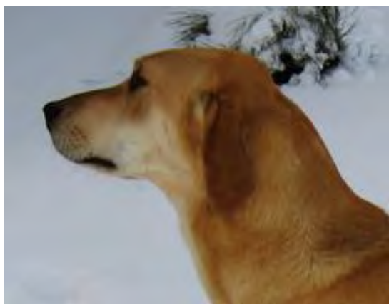
Hanhundshuvud med otydlig könsprägel och hals som saknar den rätta kraften. Något markerat stop.