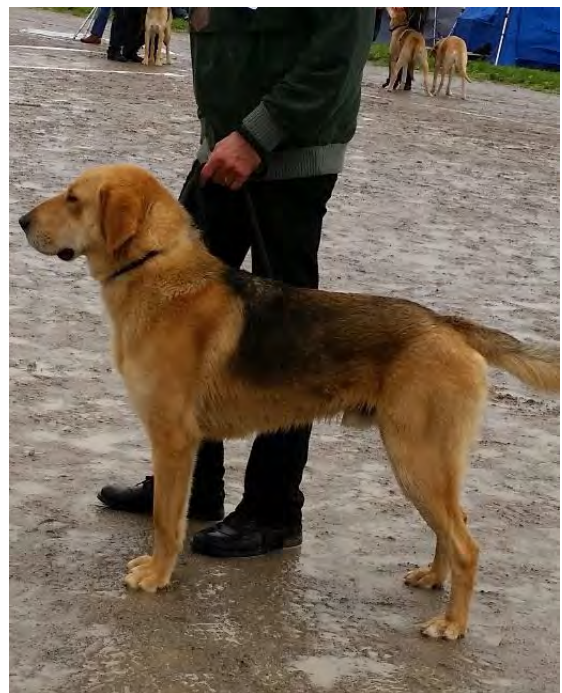
Tyngre modell, utmärkt kropp och benstomme. Aristokratisk huvudprofil, lite för mycket läpp och läppficka. Huvudet får inte bli tyngre!