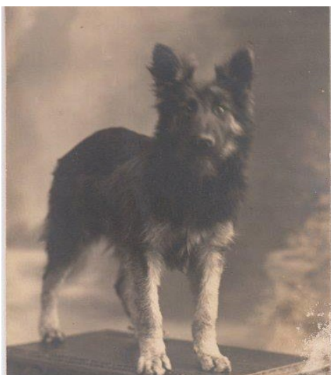
Bilden från ca 1915 fotograf okänd.

Under 1100-talet gick gränsen mellan Tjeckien och Tyskland igenom regionen Chodsko. Gränsen var viktig ur handelssynpunkt. Vid den här tiden ansvarade Chodskofolket för gränsskyddet och patrullerade gränsen med Chodský pes liknande hundar (pes betyder hund på tjeckiska). Hundarna har omnämnts i berättelser och historier som trogna, modiga och lojala. Därför är det inte förvånansvärt att Chodernas fana bär siluetten av ett hundhuvud. Det stiliserade hundhuvudet är sedan länge en tjeckisk symbol för försvarsvilja. Choderna ansvarade för gränsbevakningen fram till 1600-talet men i takt med att bevakningen fick minskad betydelse avtog även intresset för avelsarbetet kring regionens Chodský pes liknande hundar. Glädjande för oss behöll Choderna sina hundar och använde dem på senare tid som gårds- och vallhundar.