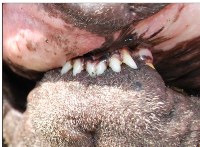
Hund behäftad med tight lip. Man ser den inrullade läppen och det kraftiga överbettet anas av tandställningen.