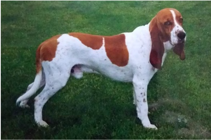
Hane med utmärkta proportioner och rejäl benstomme.

Låren skall vara långa och snedställda med kraftiga men strama muskler. Vinkeln mellan höft och lår skall vara ca 110°.