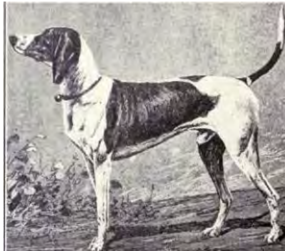
Schweizisk stövare från 1915.

Dagens varianter av schweiziska stövare återspeglar således delvis de kantonala skillnader mellan olika stövare som framkom i samband med inventeringen 1881.