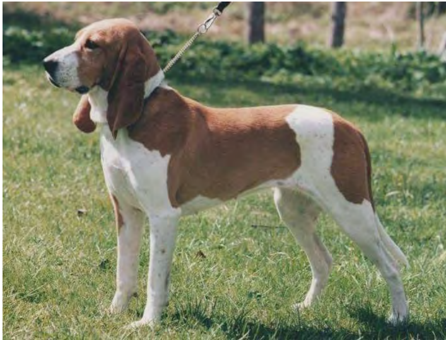
Proportionerligt byggd tik. Fina linjer, bra benstomme. Vackert huvud med välansatta öron. Bra färger.