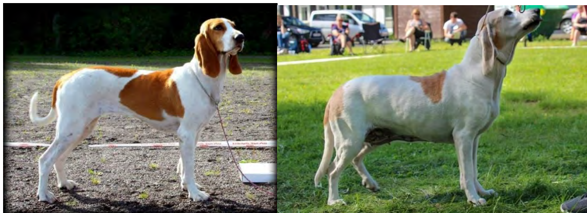
Lite lättare byggd tik med utmärkt hals.

Halsen skall vara lång, elegant och muskulös med halshud, dock utan nämnvärd dröglapp.