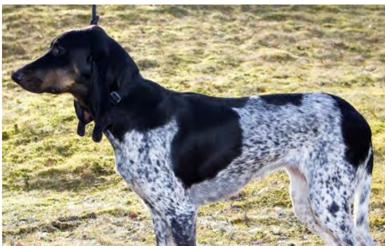
Övertecknad vit, ger inte det "blåaktiga" intrycket. Bör uppmärksammas i prissättningen. Kunde ha mer tydlig tanfärg.