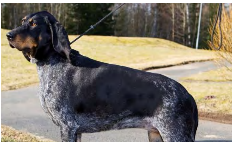
Manteltecknad, tillåtet enligt standarden.