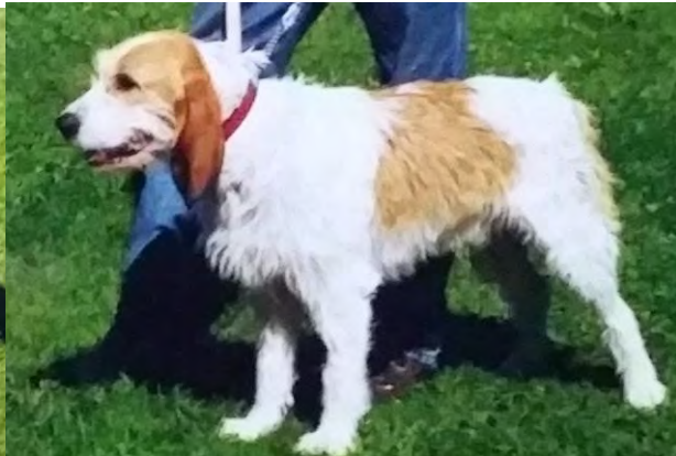
Halvlång päslängd. Här syns det som ofta präglar de strävhår som har mestadels strävt i stamtavlan - kortare proportioner i huvud och kropp och kortare öron. Detta bör påverka prissättningen.