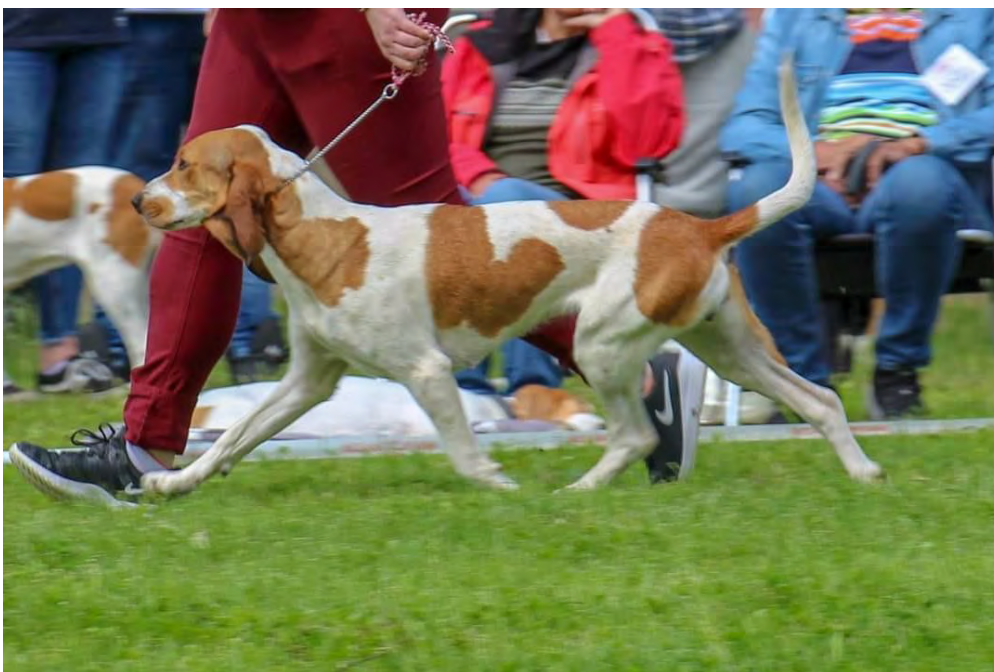
Effektiva, långa, vägvinnande rörelser.