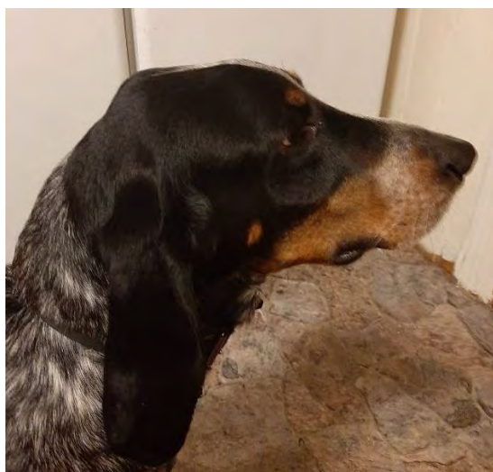
Ädelt huvud med fina linjer och markerad nackknöl.

Skallpartiet skall vara långt, smalt, torrt, ädelt och lätt avrundat med synlig nackknöl. Skallens och nosryggens plan skall vara något divergerande. Pannfåra eller rynkor i pannan får inte finnas.