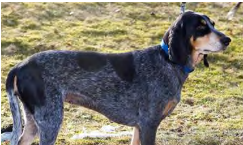
Hund med bra färg, ger det "blåaktiga" intrycket.

Hudfärgen hos luzernerstövare skall vara svart under den svarta pälsen och ljusare under den blåspräckliga.