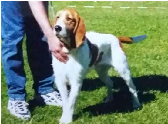
Detta är kvartslängd. Mycket bra proportioner i huvud och kropp, bra längd på öronen.

Strävhår är endast godkänt i Norge. Notera pälsens längd i kritiken; kvart-, halv- eller trekvartslängd.