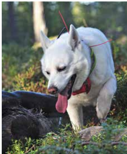
Svensk vit älghund

De ställande hundarna föds i princip utan undantag upp för jakt. Ett bra råd är att kontrollera föräldrarnas jaktprovsmärker och framför allt att försäkra sig om att de används för jakt på det viltslag man själv tänkt att jaga. Som familjehund är den ställande hunden vänlig och social, och många hundar bor idag tillsammans med sina familjer i hemmet, inte i hundgården.