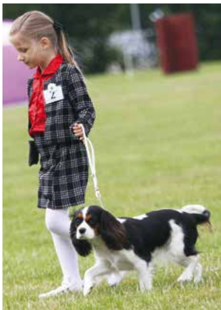
I handling finns olika åldersklasser. Här syns en minior handler som visar en cavalier king charles spaniel på Ungdoms SM. Minior handling är till för de som är mellan 6 och 9 år.

Domaren ska bedöma varje hund i jämförelse med den rasstandard som finns nedskrivna för alla rashundar som får delta på officiella utställningar. Domaren tittar på hur hunden ser ut när den står och hur den rör sig från olika vinklar. Domaren fingranskar också hunden, känner igenom hundkroppen med sina händer och tittar närmare på hundens tänder och bitt. Handlarnas uppgift är att följa domarens instruktioner om var hunden ska stå, hur den ska springa (i vilken figur) och även hjälpa till när domaren ska titta närmare på hunden. På en handlingstävling är det i första hand samarbetet mellan handler och hund som domaren tittar på. Vidare bedöms handlarnas uppmärksamhet mot domaren och andra funktionärer. Men mycket viktigt är också hur en tävlande uppträder mot sin hund och även sina medtävlare; att visa god sportsmannaanda och att vara trevlig och artig.