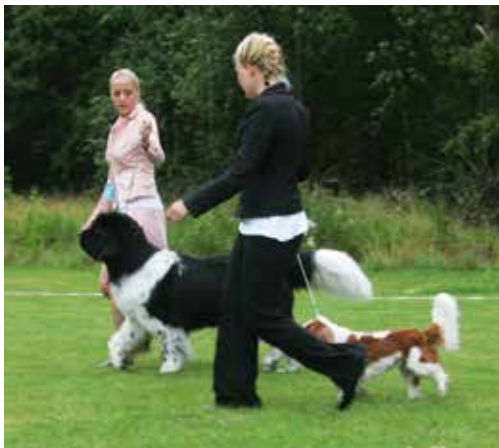
Vid parvisning får handlern med den större hunden anpassa sitt tempo till den mindre hunden.

På hundutställningar, där det är hunden och inte handlern som ska bedömas, får man oftast visa hunden i en triangel och fram och tillbaka.