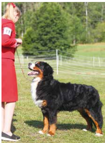
Att få sin hund att stå stilla och känna sig trygg och glad är viktigt i handling. På bilden en berner sennenhund.

Figureorna är till för att domaren ska kunna titta på hur hunden rör sig bakifrån, från sidan och framifrån. Liksom på hundutställningar vill oftast domaren se hunden springa i en triangel, men även fram och tillbaka. Hunden ska visas i trav och helst bör den inte dra i kopplet. Är det flera ekipage i ringen samtidigt ska man hålla lagom avstånd till de andra. Man får absolut inte störa sina medtävlare eller deras hundar. En duktig handler ska lära sig visa många olika typer av hundar och raser.