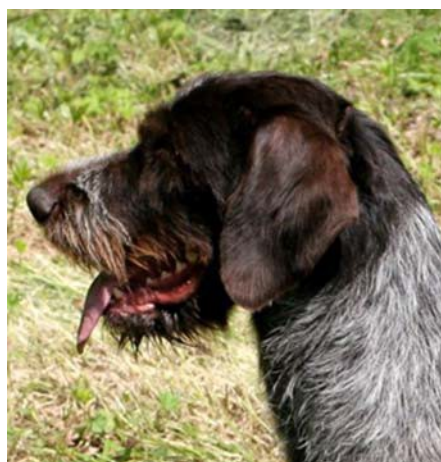
Utmärkt tikhuvud där nosryggen kunde vara mer välvd.