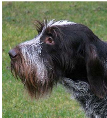
Hanhundshuvud med fina proportioner, dock något lågt ansatta öron.

Käk- och kindmuskulaturen skall vara kraftig och framträda mycket tydligt. Rasen skall ha kraftigt och fulltaligt saxbett.