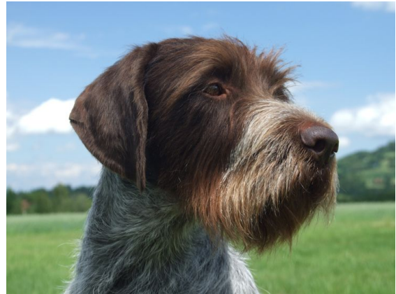
Välskuret huvud med fint uttryck.