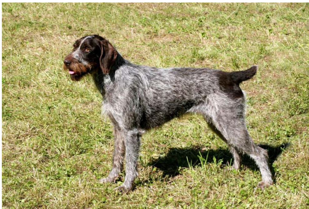
Bra proportioner i huvudet, något ljusa ögon. Även här skulle framstället vara bättre vinklat. Utmärkt päls.

Hos hanhundar måste båda testiklarna vara fullt utvecklade och normalt belägna i pungen.