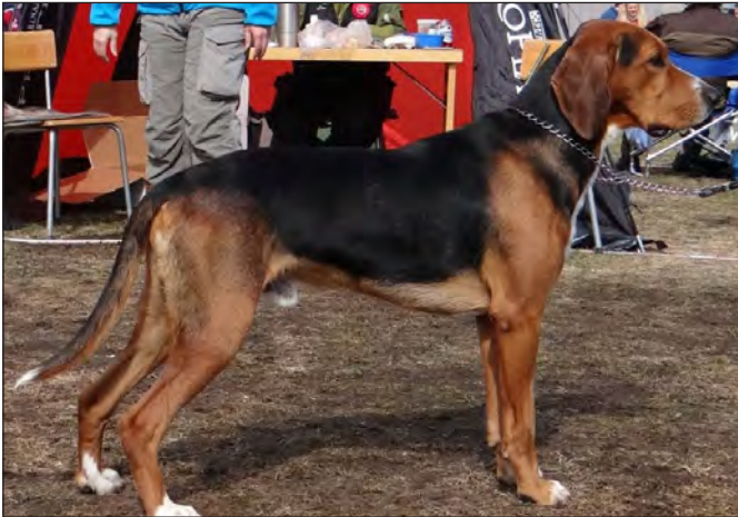
Stark välbyggd kropp med mycket bra över- och underlinje. Kunde ha något ädlare huvud.