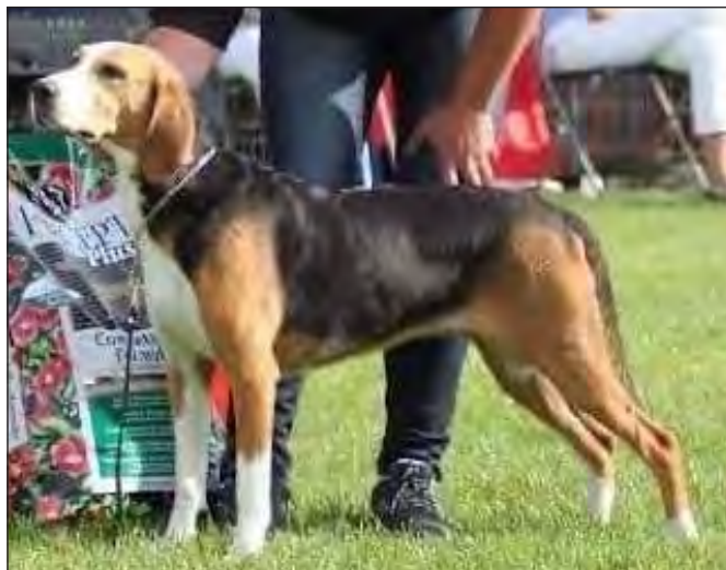
En vacker och till alla delar utmärkt tik.