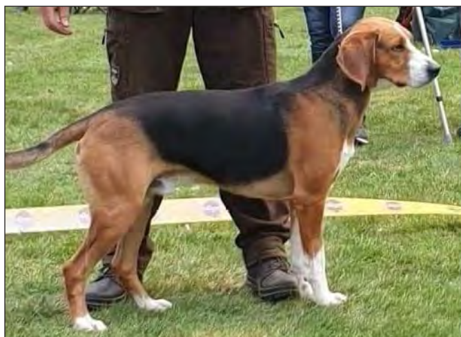
Hane med utmärkt helhet, välutvecklad, bra benstomme och vinklar, breda lår. Vackra färger.