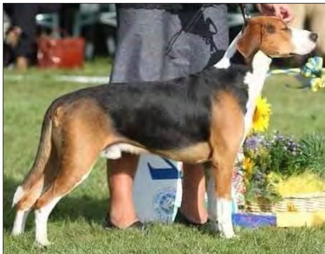
Vacker och till alla delar utmärkt hane – utmärkt kropp och hals. Utmärkt över- och underlinje.