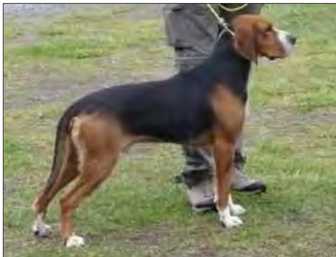
Utmärkt hane med utmärkta vinklar och huvud. Fina väl avgränsade färger.