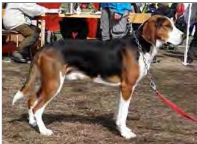
Utmärkt hane. Bra helhet och utstrålning. Tydlig könsprägel. Utmärkt kropp, benstomme och vinklar. Har vita tecken på ena knät, kan vara avgörande vid konkurrensbedömning.