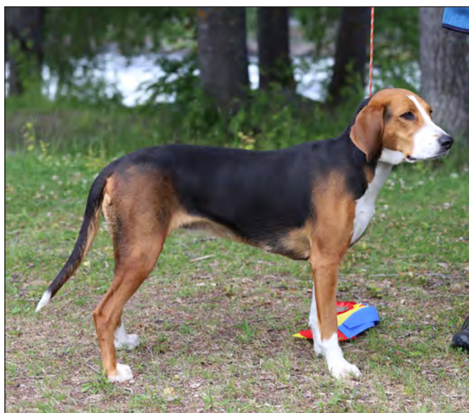
Utmärkt tik med något kort bröstben.