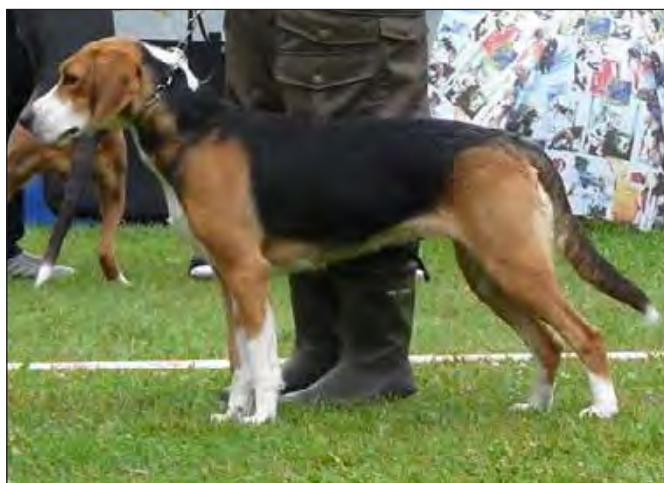
Tik med vackert och väl könspräglad huvud, mycket bra hals, stark rygg och utmärkt kors. Vål kroppad, välvinklad bak. Mycket bra päls och färg.