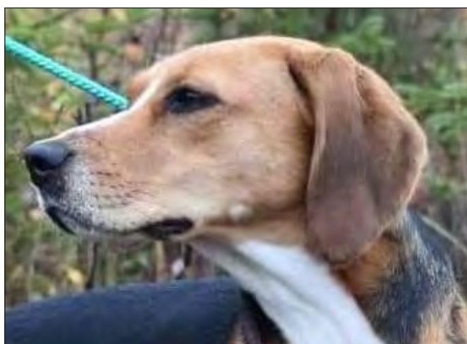
Utmärkt parallellitet och fint jämbrett nosparti. Utmärkta öron.