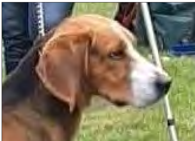
Utmärkt parallellitet och utmärkta läppar.