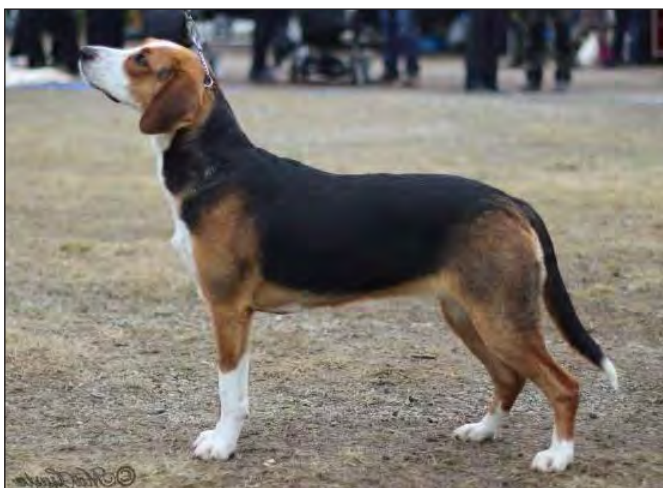
Mycket lovande juniortik. Ännu sotig i tanfärgerna vilket är vanligt vid yngre ålder.