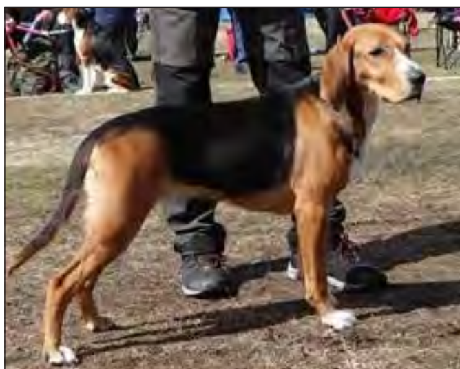
Utmärkt tik med de rätta proportionerna. Korrekt harmoniskt uttryck. Vålvinklad, bra benstomme och muskler, utmärkt förbröst och bröstdjup. Fina väl avgränsade färger.