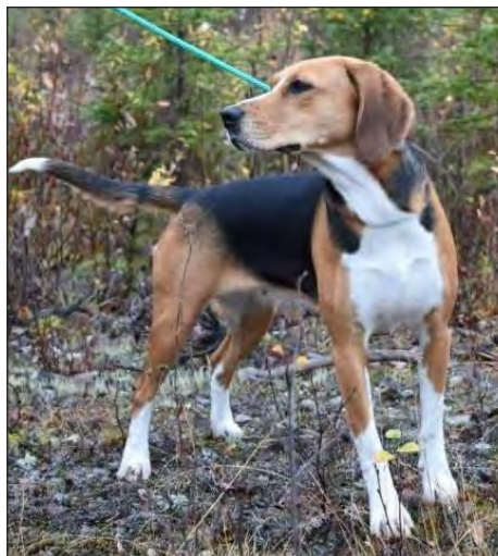
Utmärkt tik med fina färger – den ljusare "ursprungliga" färgen på tantecknen.