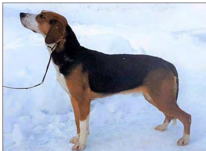
Välvinklad tik med utmärkt helhet.