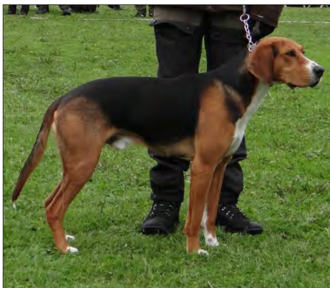
Maskulin hane med mycket bra rastypiska detaljer. Korset är dock en aning brant.