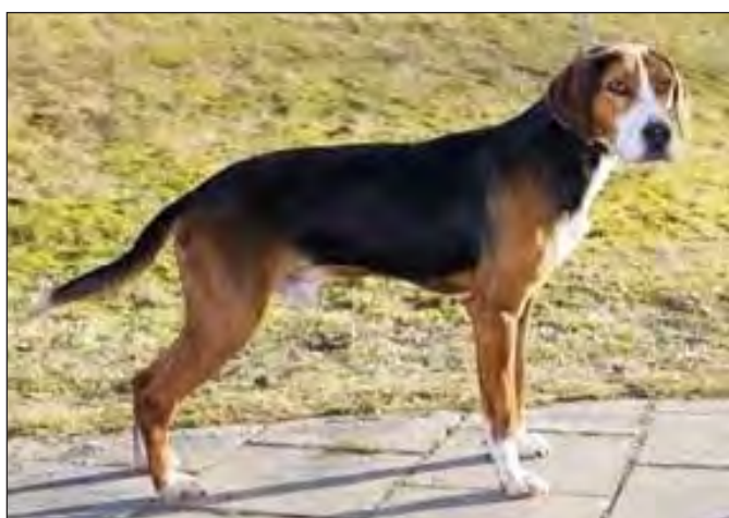
Vuxen hund. Något sotig i sina färger och har pannmask, bör uppmärksammas i prissättningen. Förekommer även andra detaljfel.