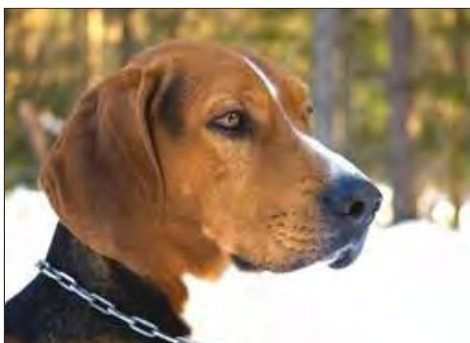
En aning ljusa ögon vilket kan vara avgörande i konkurrensbedömning.