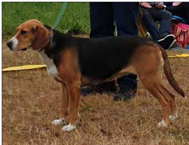
Harmoniskt vinklad tik av utmärkt typ. Kraftig och välutvecklad men lite tung för dagen. Bra färger.