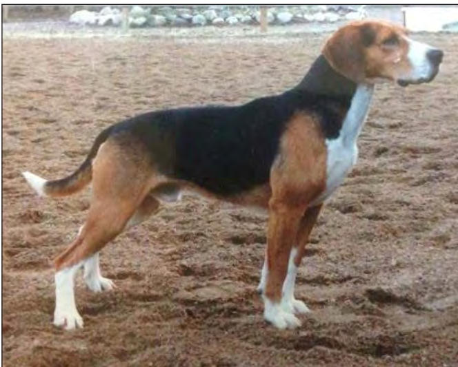
Stark och välbyggd hane med utmärkt benstomme. Utmärkt maskulint huvud.