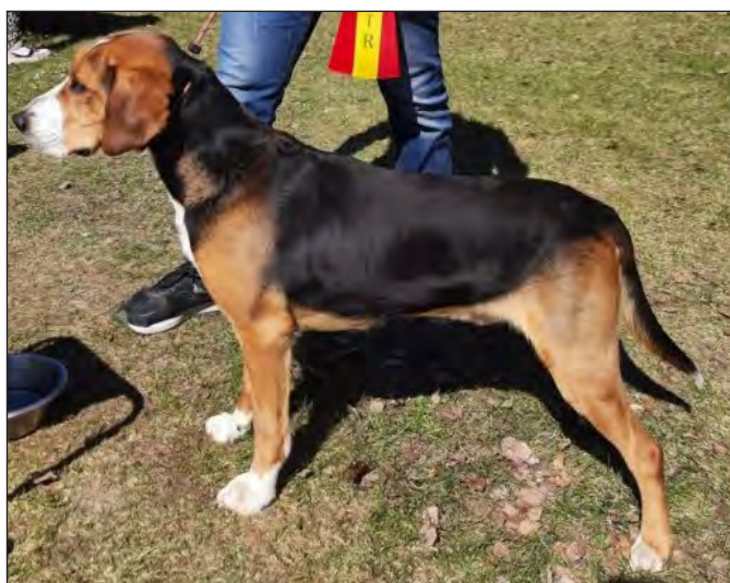
Hane med vacker helhet. En sund utstrålning och bra benstomme.