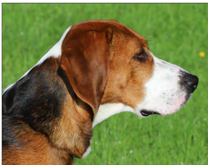
Vackert maskulint huvud med bra proportioner. Parallella linjer i hjässa och nos. Har dock en aningen mycket halsskinn.