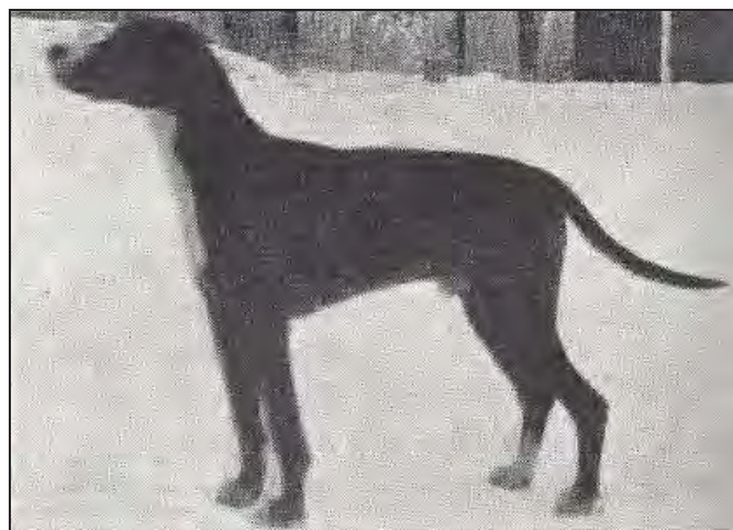
Larsbo Buster (f. 1958) SUCH, SBCH

Dessa individer har bevisligen påverkat rasen mycket positivt och ligger i mångt och mycket bakom de hundar vi har idag.