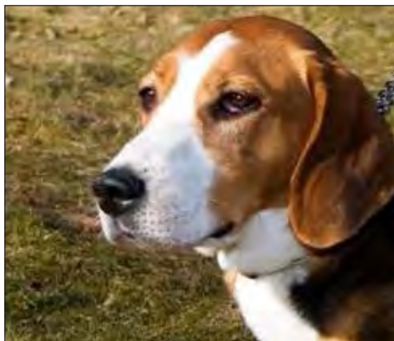
Lägg märke till den lugna harmoniska blicken.