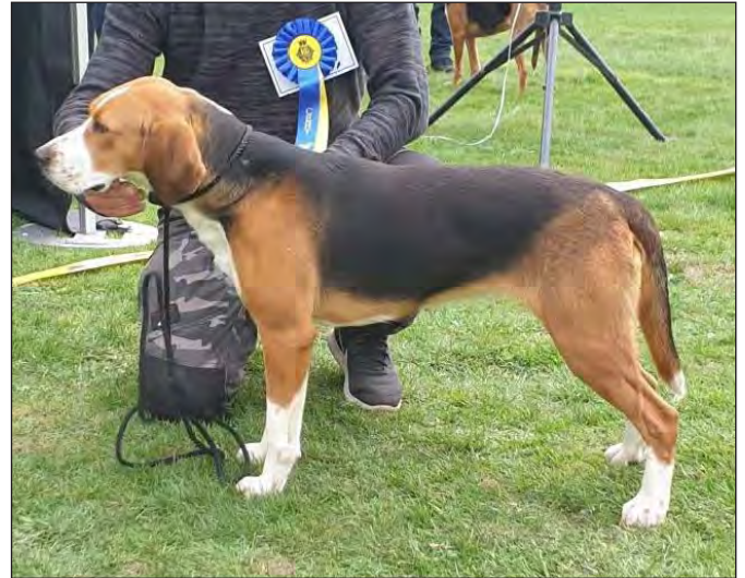
Utmärkt helhet, kraftfull och välutvecklad tik med utmärkt benstomme och vinklar. Lite stora öron och en aning mycket läpp.