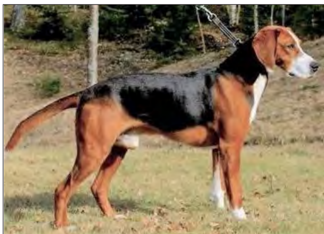
Proportionerlig, stark hane. Rastypiskt huvud. Våltecknad med rena färger. Observera även hundens helhet och lugna harmoniska uttryck.