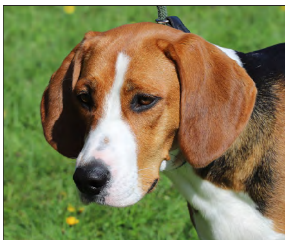
Ett vackert tik huvud med härligt uttryck och utmärkta öron.