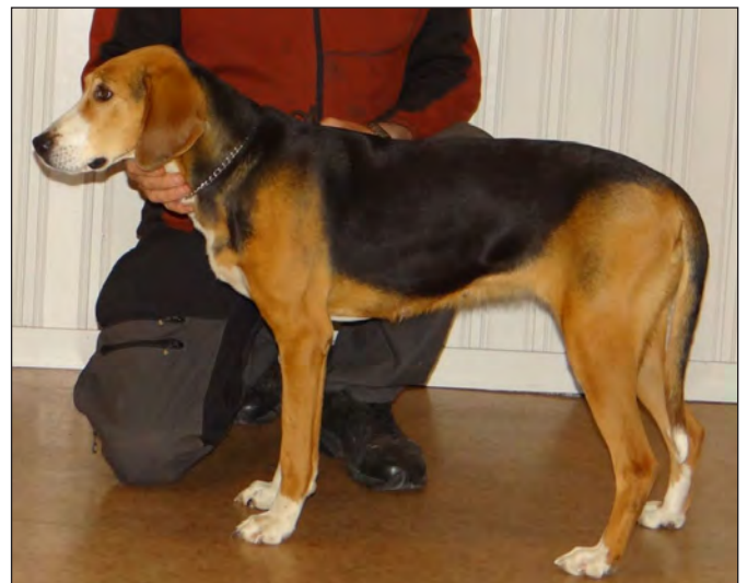
En utmärkt tik i sin helhet. Utmärkt överlinje med mycket bra kors.