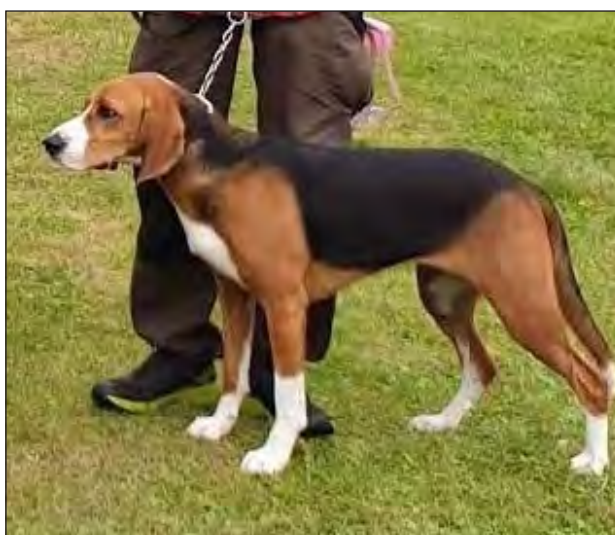
Tik av utmärkt typ och med många utmärkta detaljer dock något uppdragen buklinje.