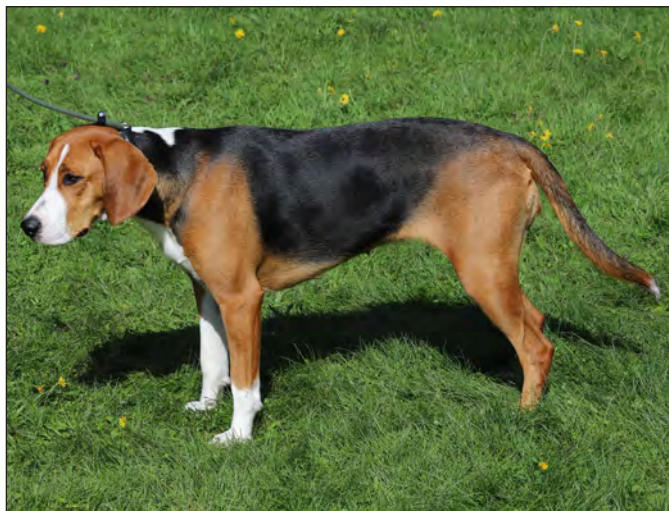
Stark tik med fin päls och färg. Kunde dock ha en ett längre kors.