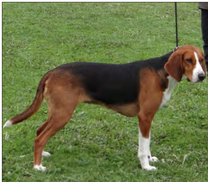
En utmärkt tik med rätta proportioner. Utmärkt kors. Tydlig könsprägel och utmärkta vinklar. Vackert huvud med mörka vackra ögon och med det rätta harmoniska uttrycket.