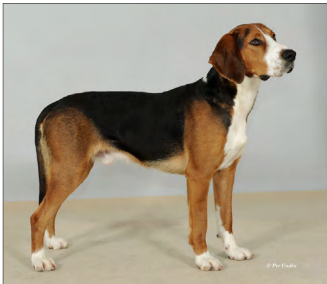
Utmärkt, välkroppad hane. Maskulint huvud med rastypiska öron.