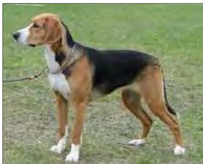
Utmärkt tik. Något tunn underkäke. Bra tanfärger (åt det lite mer brungula, den "ursprungliga" hamiltonstövarefärgen).