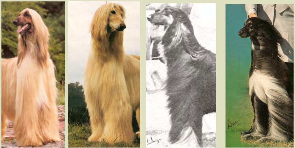
En lång hals är viktig för funktionen och för typ, balans och elegans.

En vacker halsansättning är viktig för helheten. Mankens lutning återspeglas i korsets lutning och skapar en harmonisk balans.