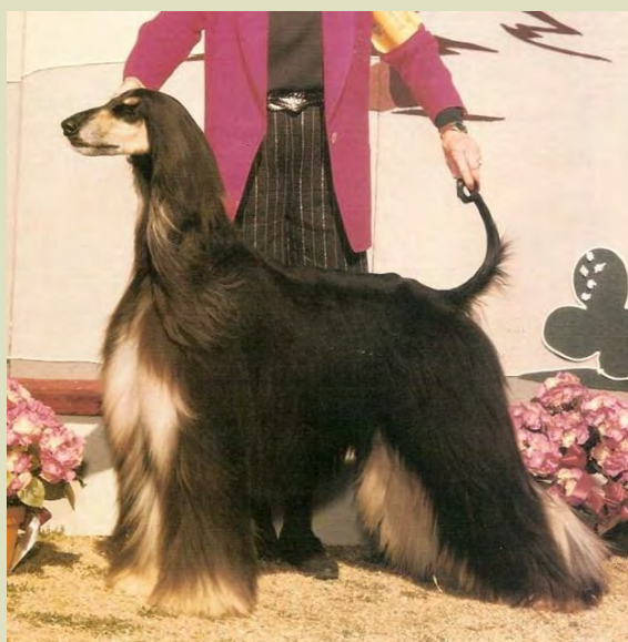
Två utmärkta exempel på maskulina, men samtidigt eleganta hanhundar.

På önskemål av Svenska Afghanhundklubben beslöt SKK om obligatorisk mätning av afghanhundar på utställningar under 2020 och 2021. På grund av coronapandemin har mätningarna förlängts till och med 2022. Hittills har det utförts 97 mätningar på hanhundar och 98 mätningar på tikar. Merparten av mätningarna ligger inom intervallen för idealhöjden för respektive kön. Se diagram 1.