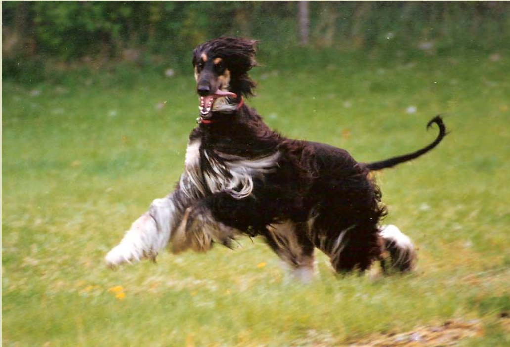
En afghanhund ska ge ett tydligt atletiskt och vilt intryck.

afghanhund ska vara en explosiv och atletisk hund och ska ge ett tydligt intryck av detta både i stående och i rörelse.