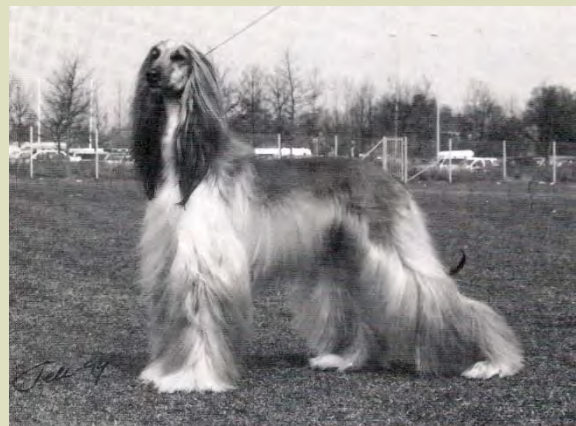
Hanhund och tik med utmärkt pälsmönster som framhäver silhuetten.