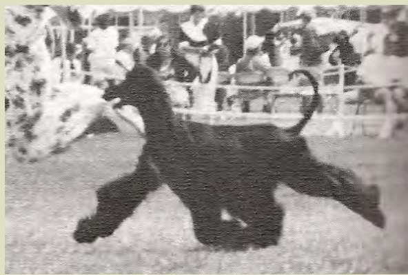
Två hundar som visar korrekt balans, typiska silhuetter och stilfulla rörelser.