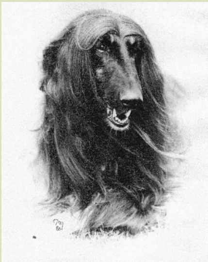
Optimalt uttryck med aggressiv vildhet – "a certain keen fierceness".

FCI-standarderna skriver "a certain keen fierceness" vilket innebär ett tydligt element av aggressiv vildhet i uttrycket. Man betonar att hunden naturligtvis inte ska vara aggressiv, men den får mer än gärna se ut som om den är det, i uttrycket. Detta till skillnad från sin släkting salukin, som också är orientalisk i sitt uttryck, men betydligt mildare.