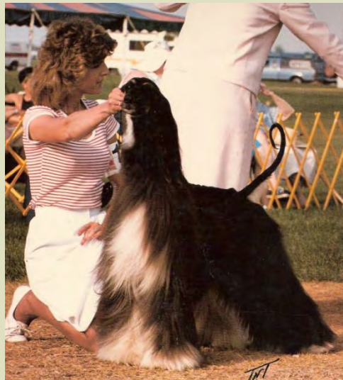
Hanhund och tik med utmärkta svansar.