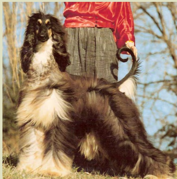
Två vackra hanhundar med tydlig könsprägel, utmärkta proportioner, kvalitet, utstrålning och stolt värdighet. De illustrerar särskilt väl att en afghanhund bör stå stadigt på sina tassor.

Å andra sidan innebär överdriven tyngd och substans nedsatt funktionell förmåga i form av lägre fart. En afghanhund ska alltid ge ett uttalat atletiskt och vilt intryck, den ska vara lätt på foten, ge intryck av ädelhet och ha en mejsling, torrhet och detaljering. Det kan knappast påtalas tydligt nog att en