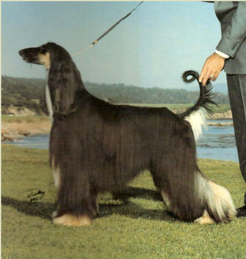
Mankens lutning återspeglas i korsets lutning och skapar en harmonisk balans.