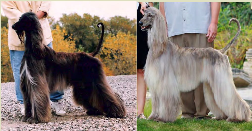
Två högresta hanhundar med vackra silhuetter, proportioner, resning och generellt hög kvalitet.

Huvudet ska alltid bäras högt. Naturlig, stolt resning är ett speciellt viktigt adelsmärke hos rasen och en nödvändighet för att en afghanhund ska kunna tilldelas CK. Detsamma gäller svansföringen.