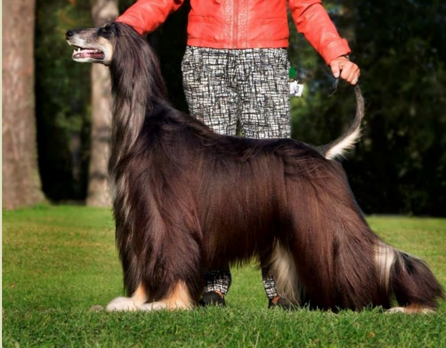
Tik med lång hals och utmärkt halsansättning.