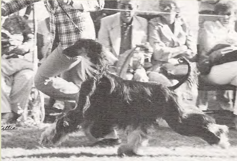
Samma hanhund som ovan i rörelse, illustrerar atletisk helhet och bra resning.

Afghanhunden är, liksom de övriga vindhundraserna, byggd för en kombination av fart och kraft. Detta innebär att hunden ska visa upp en kombination av kraft och styrka samt elegans . Elegansen ska komma som en funktion av styrkan, och inte som ett resultat av att hunden är överdrivet förfinad eller späd. Elegans är ofta en bristvara hos rasen.