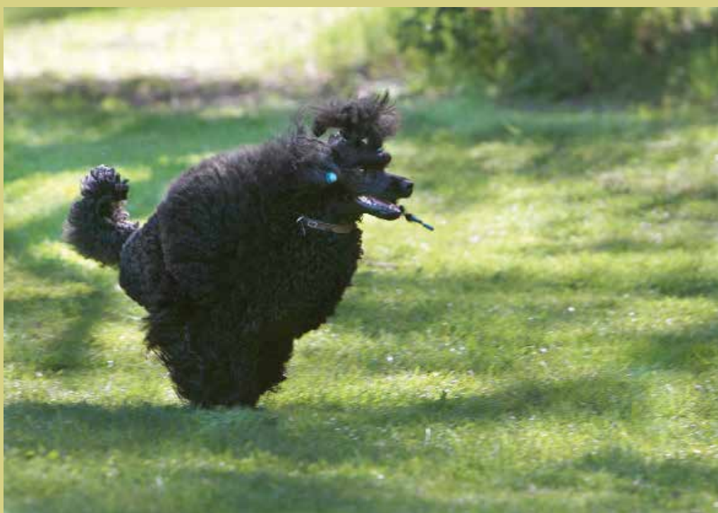
Lekfull och livlig på sant pudelmanér! Drygt ettåriga mellanpudeln Ilex (Love Yummies Piece of Cake) i full fart på BPH-banan!