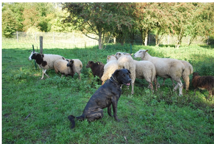
Till vänster: Kuperad, vuxen hund.