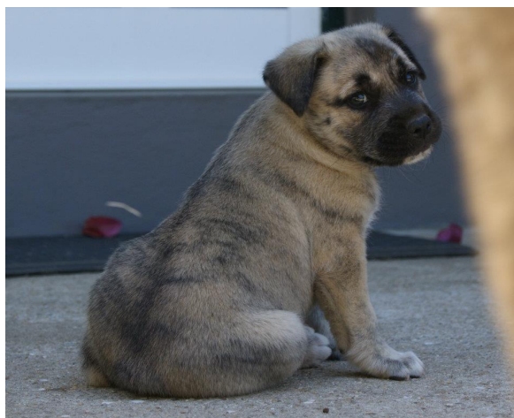
Nedan: Okuperade valpar