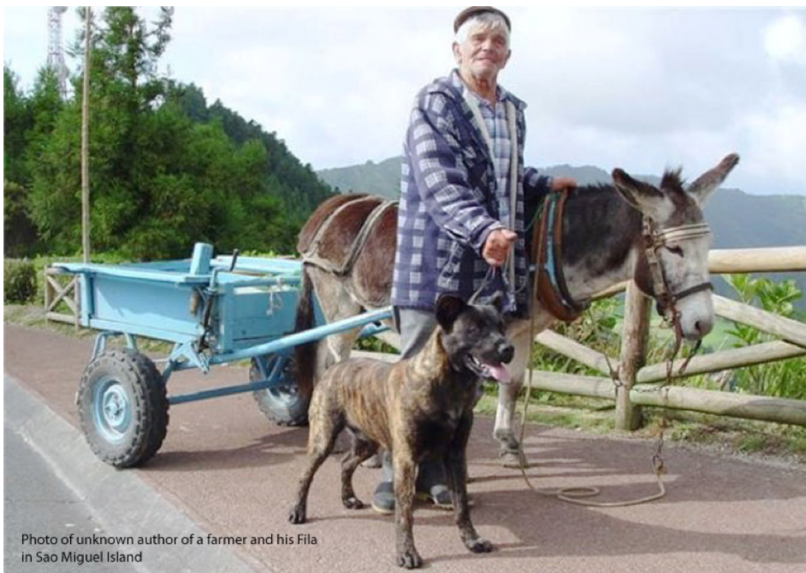
Photo of unknown author of a farmer and his Fila in Sao Miguel Island