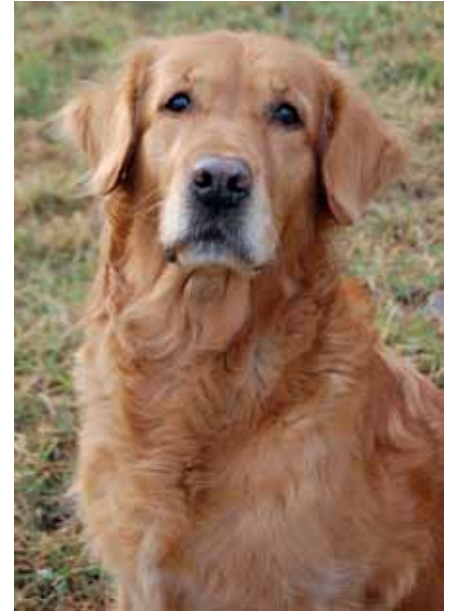
I dagsläget har man identifierat tre olika PRA-former hos golden retriever. Men fler återstår, tror forskarna.