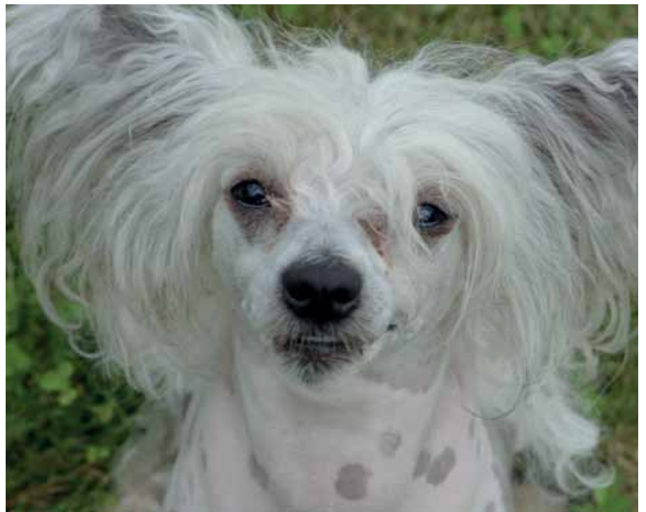
Hos chinese crested förekommer flera ärftliga ögonsjukdomar, bland annat den nyupptäckta näthinne degenerationen pigmentös chorioretinopati. Sjukdomen är mycket lik en av människans vanligaste synnedsättningar, "gula-fläcken sjuka".