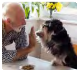
Stötta vårt arbete för dig och din hund i samhället