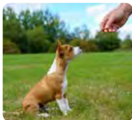
Gå på kurser och träningar med din hund