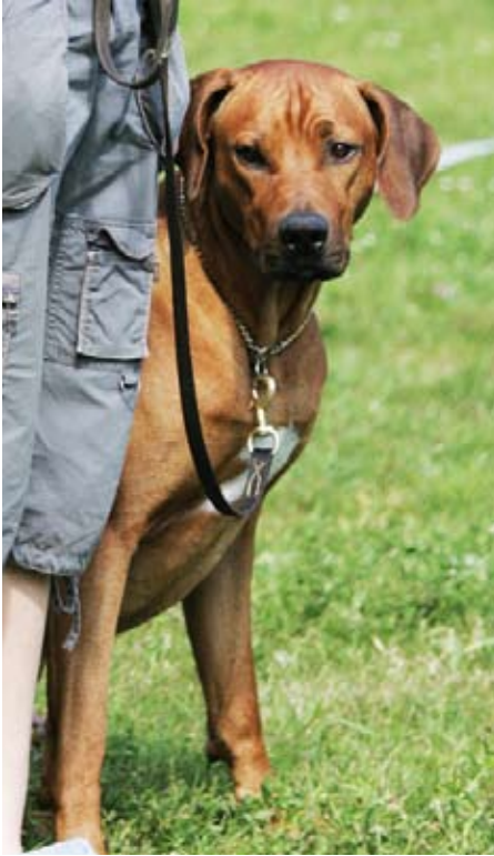
Rhodesian ridgeback som snart ska in på tävlingsbanan.