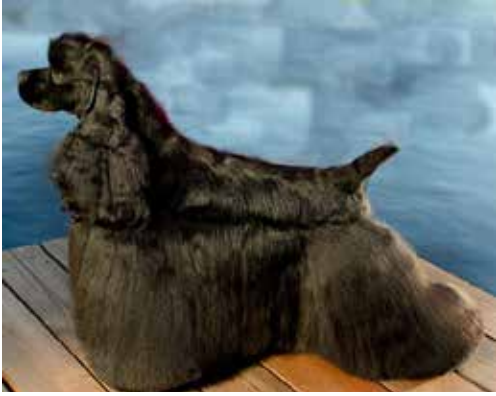
Kort välbyggd hane med något tunt nosparti.