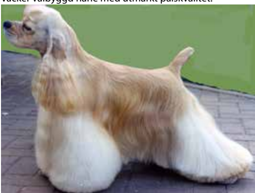
Hane med utmärkta proportioner, något brant skuldra.