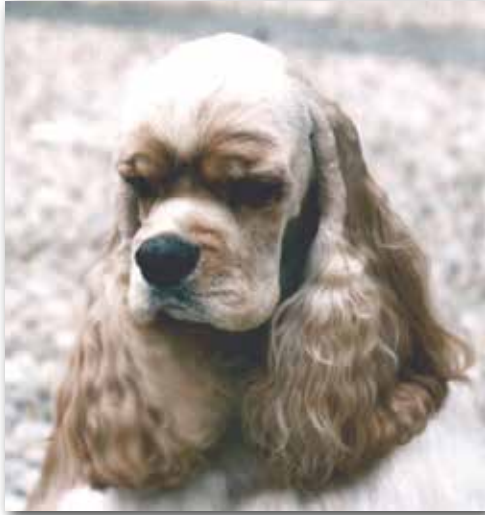
Notera mejslingen och den breda nosryggen. Ett mycket vackert hanhundshuvud.