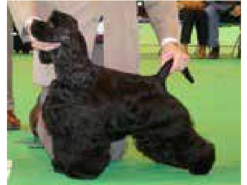
Härlig juniorhane med alla rasdetaljer.