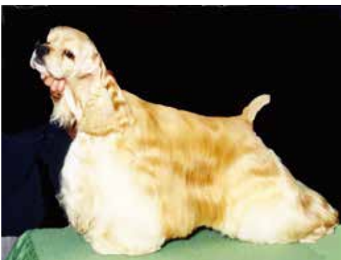
Vacker välbyggd hane med utmärkt pälskvalitet.