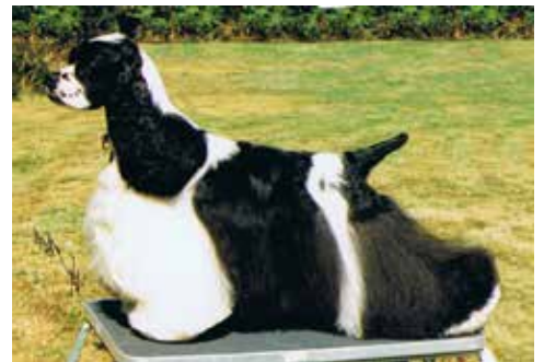
Flott tik. Något överdrivet uppställd.