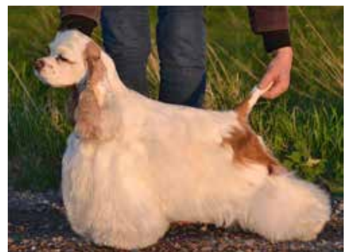
Vacker partitik. Färgen? Notera teckningen. 10%??