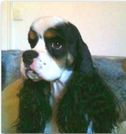
Vackert hanhundshuvud! Vita blinkhinnor är fullt acceptabelt hos partifärgade hundar.