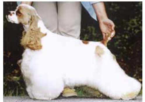
Välbyggd, något lång hane med utmärkt päls längd och kvalitet.