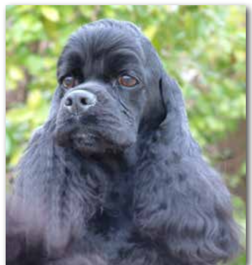
Mycket vackert tikhuvud med underbart mildt uttryck.