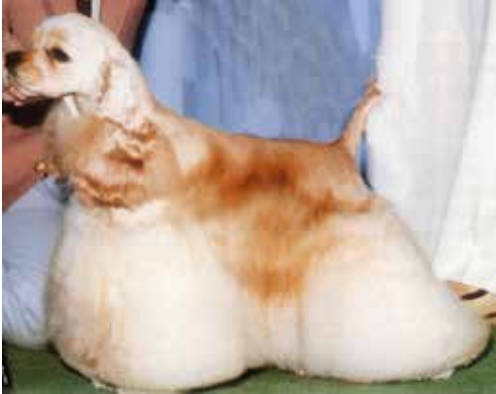
Tiltalande tik med alltför riklig päls.