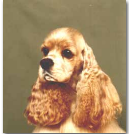
Feminint tikhuvud med vackra mörka uttrycksfulla ögon.