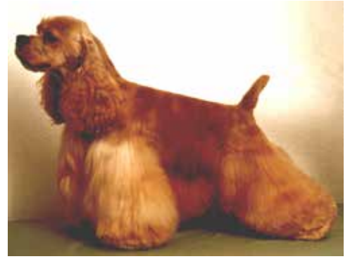
Vacker välbyggd hane med utmärkt pälsmängd..