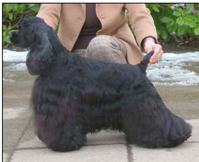
Denna tik är Field trial och Show champion