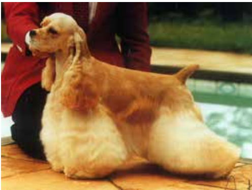
En mycket vacker tik utan överdrifter.